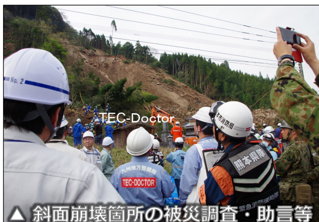
△ 斜面崩壊箇所の被災調査・助言等 (H30年中津市土砂災害)