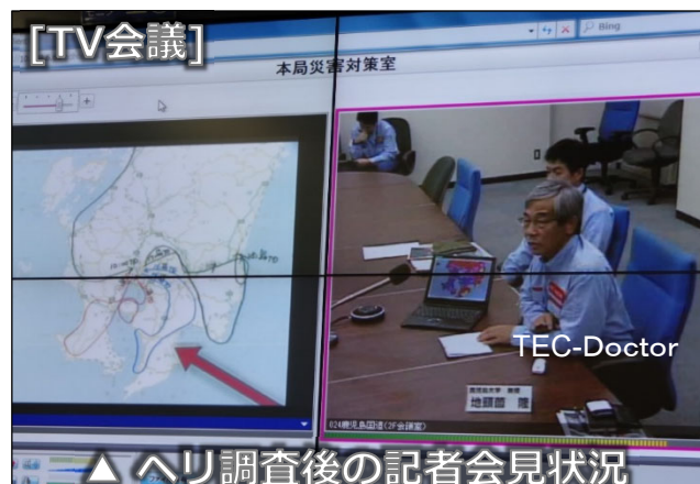
△ ヘリ調査後の記者会見状況 (R元年梅雨前線・鹿児島県上空)