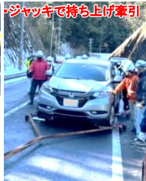
・ジャッキで持ち上げ牽引