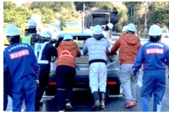
・国、県、地元建設業者協同で放置車両11台を移動