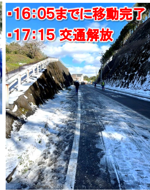
・16:05までに移動完了 ・17:15 交通解放