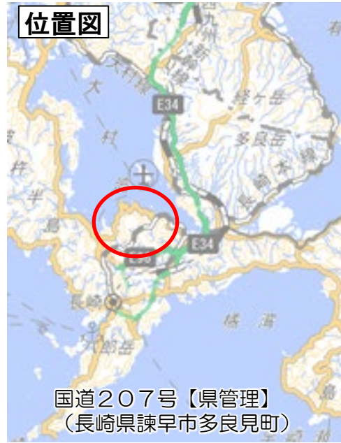
国道207号【県管理】 (長崎県諫早市多良見町)