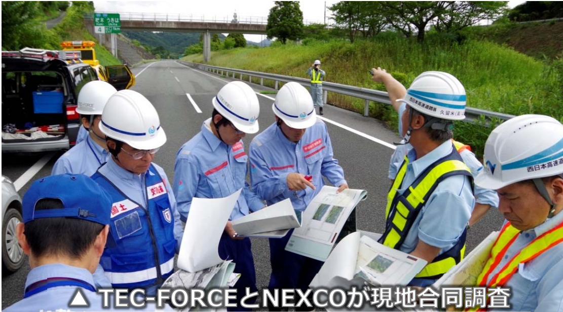
△ TEC-FORCEとNEXCOが現地合同調査

○ H29.7.10（月）NEXCOからの要請を受け、大分自動車道高山トンネル付近の土砂流出箇所において、TEC-FORCEが現地調査を実施し、安全が確認されたことから通行止め規制が解除されました。