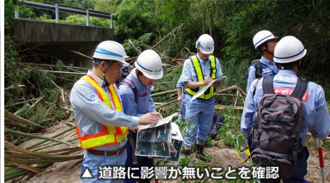
△ 道路に影響が無いことを確認