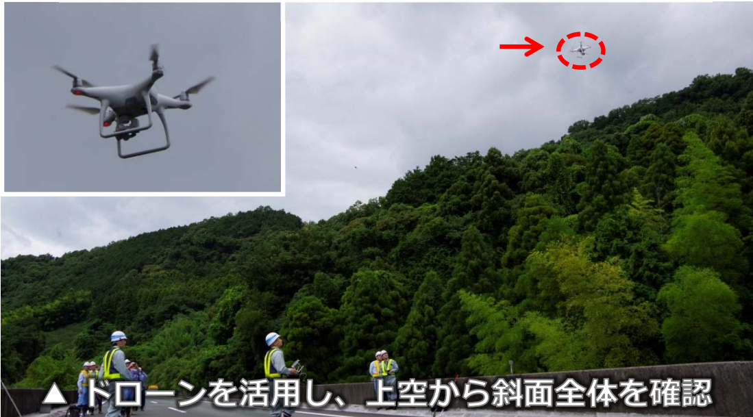
△ ドローンを活用し、上空から斜面全体を確認