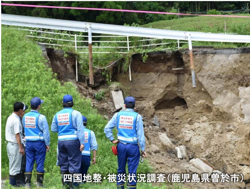
四国地整・被災状況調査(鹿児島県曾於市)