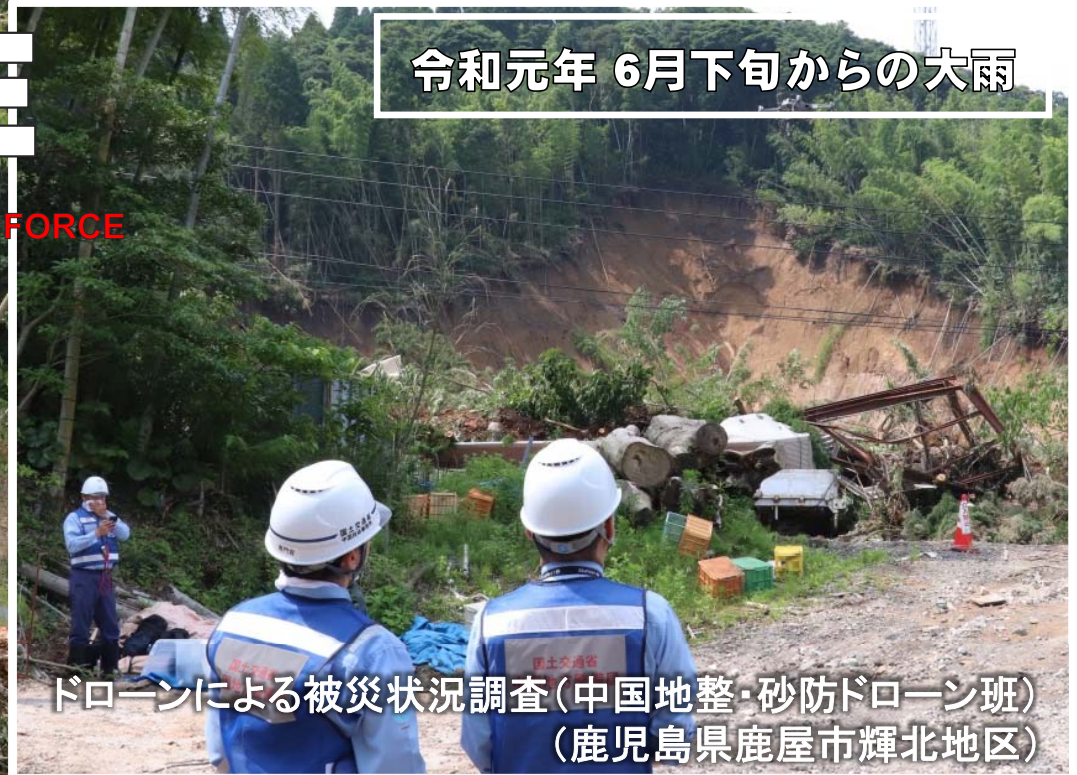
ドローンによる被災状況調査(中国地整・砂防ドローン班) (鹿児島県鹿屋市輝北地区)