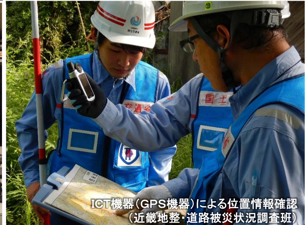
ICT機器(GPS機器)による位置情報確認 (近畿地整・道路被災状況調査班)