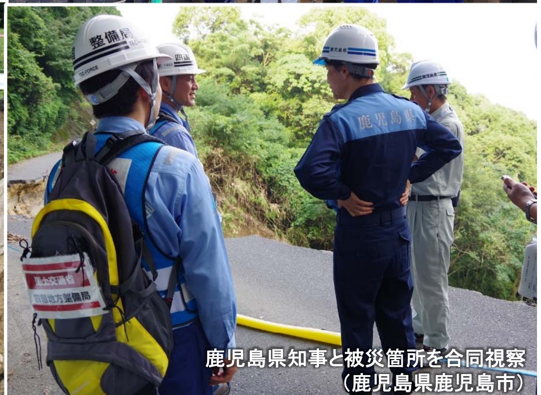
鹿児島県知事と被災箇所を合同視察 (鹿児島県鹿児島市)