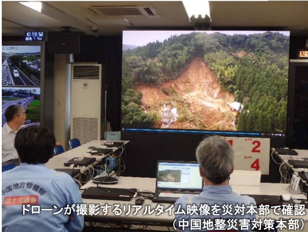
ドローンが撮影するリアルタイム映像を災対本部で確認 (中国地整災害対策本部)