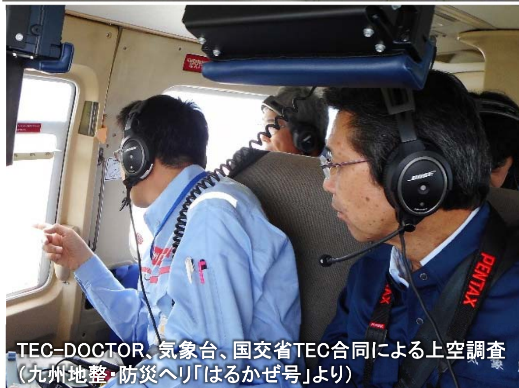
TEC-DOCTOR、気象台、国交省TEC合同による上空調査 (九州地整・防災ヘリ「はるかぜ号」より)