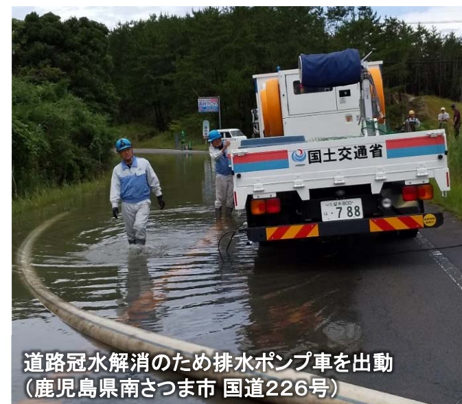
道路冠水解消のため排水ポンプ車を出動 (鹿児島県南さつま市 国道226号)