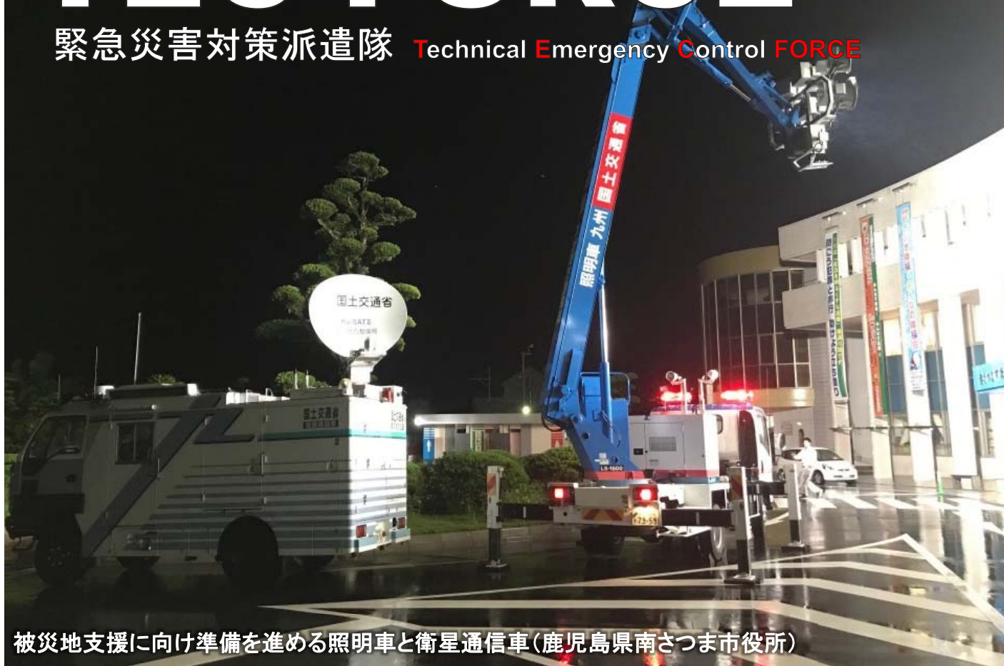
被災地支援に向け準備を進める照明車と衛星通信車(鹿児島県南さつま市役所)

緊急災害対策派遣隊 Technical Emergency Control FORCE