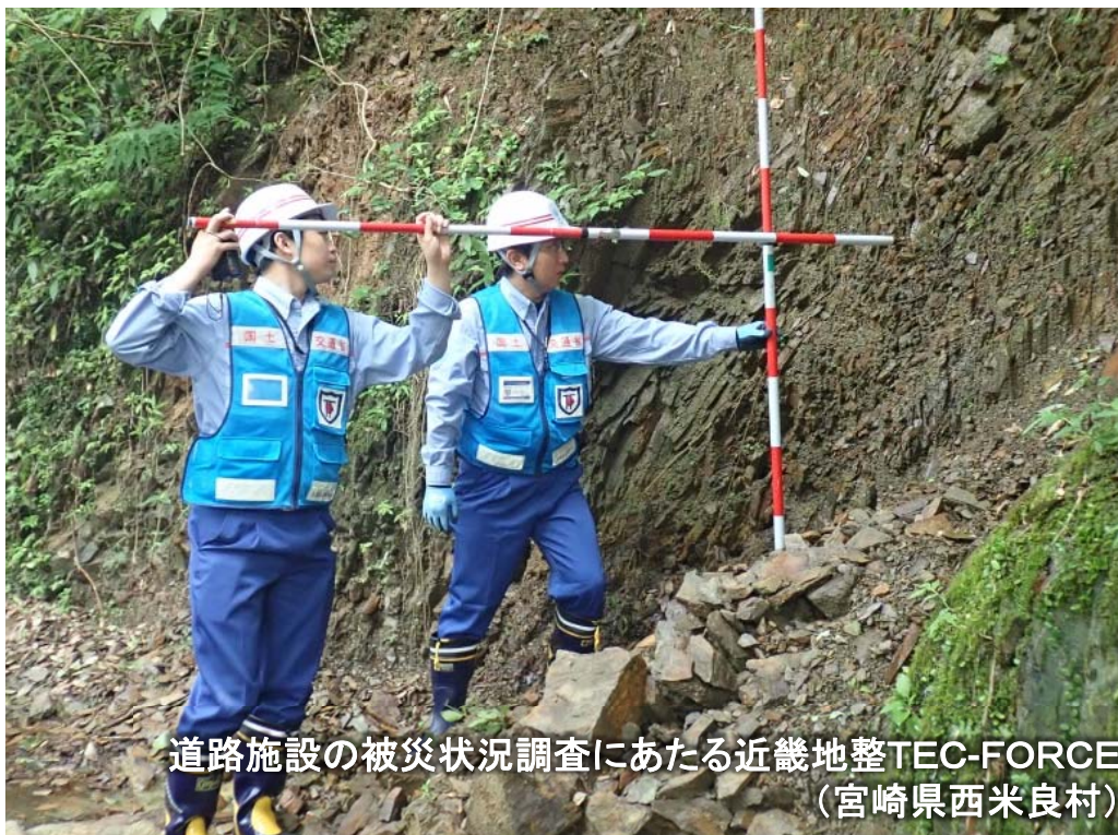
道路施設の被災状況調査にあたる近畿地整TEC-FORCE (宮崎県西米良村)