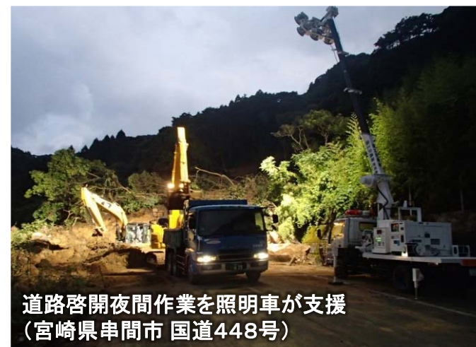
道路啓開夜間作業を照明車が支援 (宮崎県串間市 国道448号)