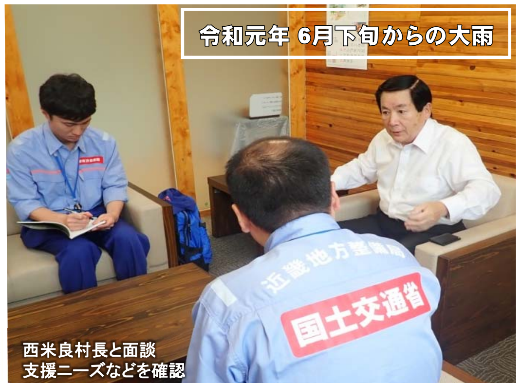
西米良村長と面談 支援ニーズなどを確認