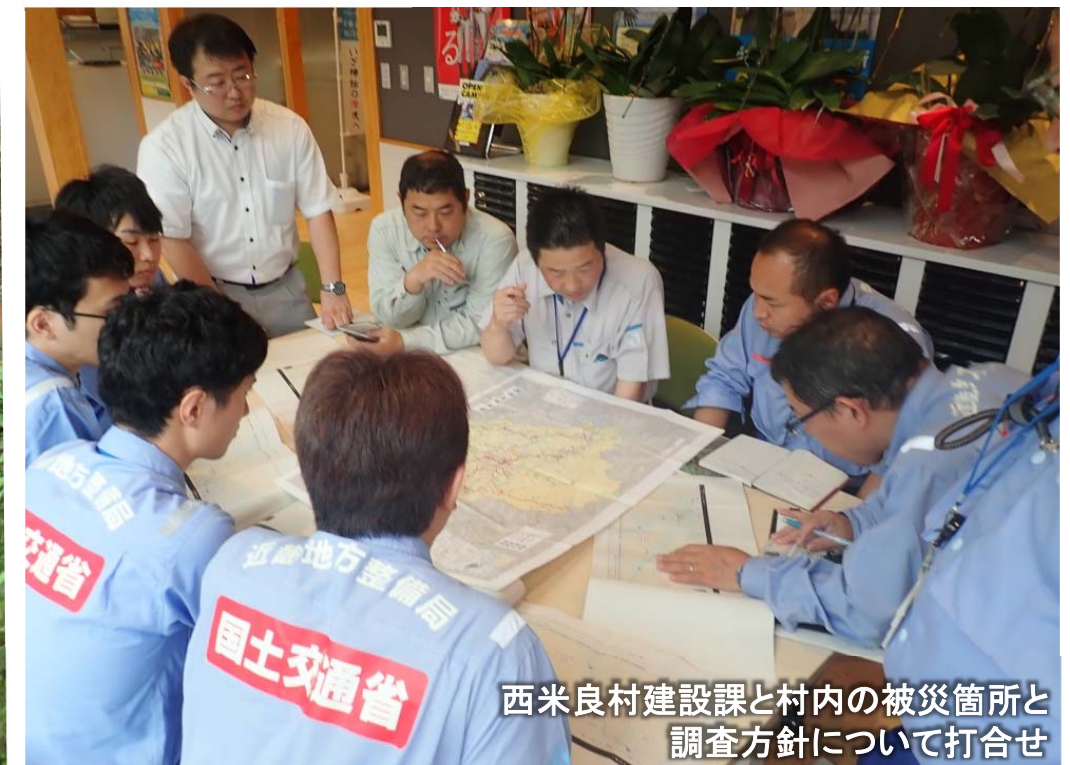
西米良村建設課と村内の被災箇所と 調査方針について打合せ