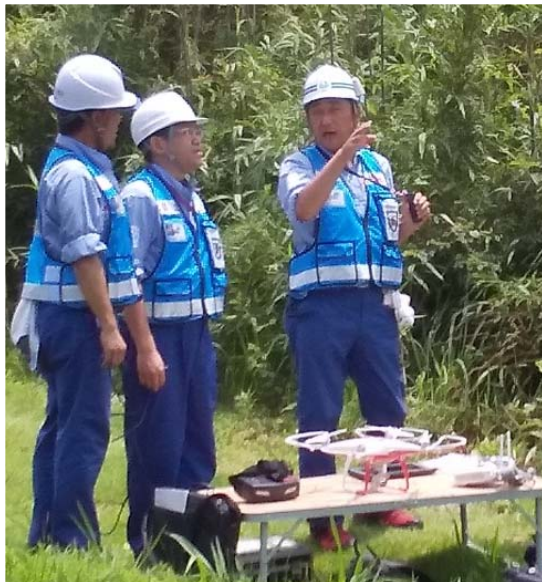
▲飛行前の安全確認