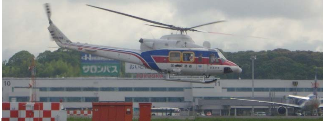
上空調査のため「はるかぜ号(九州地整・防災ヘリ)」を発進 (福岡空港離陸)