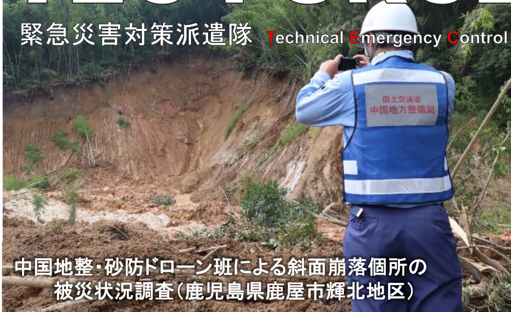
中国地整・砂防ドローン班による斜面崩落個所の被災状況調査(鹿児島県鹿屋市輝北地区)