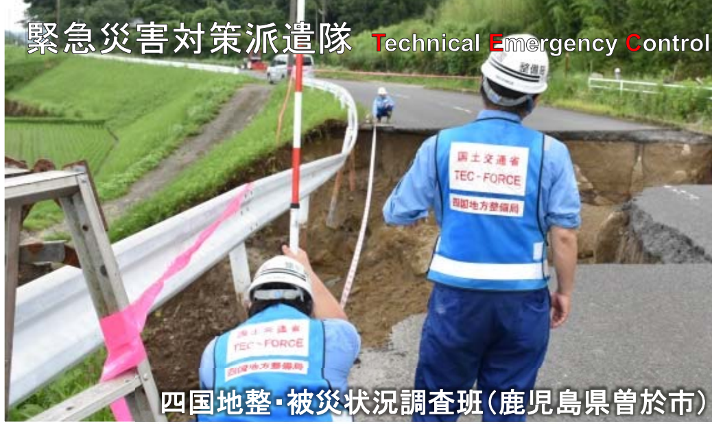
四国地整・被災状況調査班(鹿児島県曾於市)