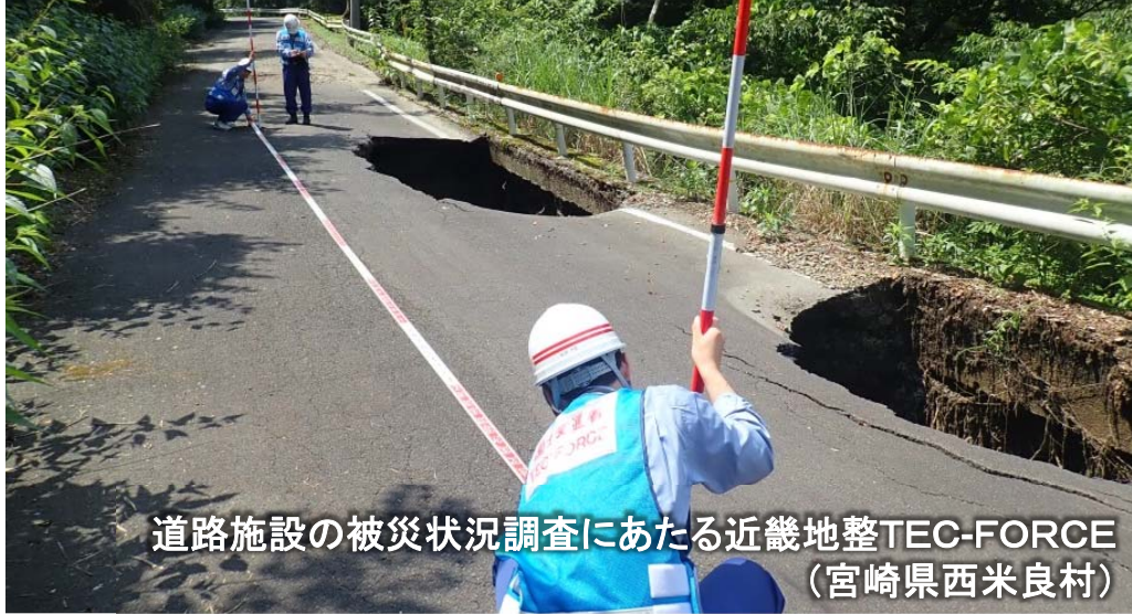
道路施設の被災状況調査にあたる近畿地整TEC-FORCE (宮崎県西米良村)

緊急災害対策派遣隊 Technical Emergency Control FORCE