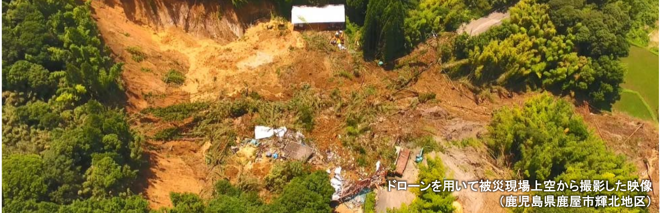
ドローンを用いて被災現場上空から撮影した映像 (鹿児島県鹿屋市輝北地区)