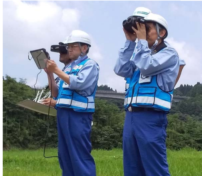
▲安全に運行するためドローンの進路を監視