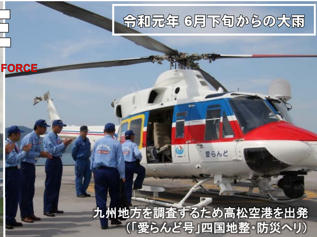
九州地方を調査するため高松空港を出発 (「愛らんど号」四国地整・防災ヘリ)