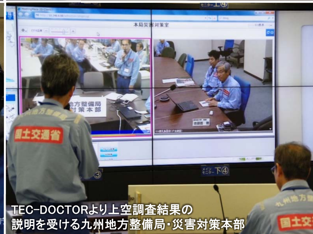
TEC-DOCTORより上空調査結果の 説明を受ける九州地方整備局・災害対策本部