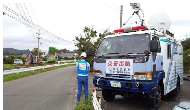
被災箇所のリアルタイム映像を被災自治体に配信 (鹿児島県南さつま市(大王川決壊箇所))