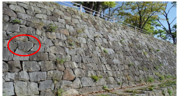
石積みに隠されたハートの石