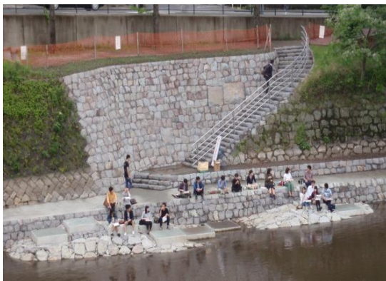
水辺でくつろぐ人々