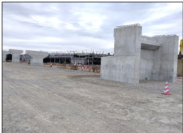
橋梁下部工工事現場