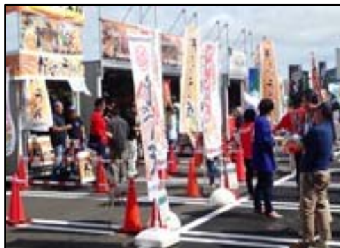
「みなとオアシス」における地域振興イベント