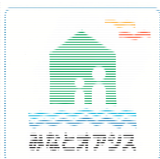
みなとオアシス標章（シンボルマーク）

※ みなとオアシス： 旅客船ターミナル、文化交流施設、みなとの資料館、情報提供施設、地元産品の物販施設や飲食施設などで構成されています。「みなとオアシスほそしま」の詳細については、別紙－1、別紙－2 をご参照願います。