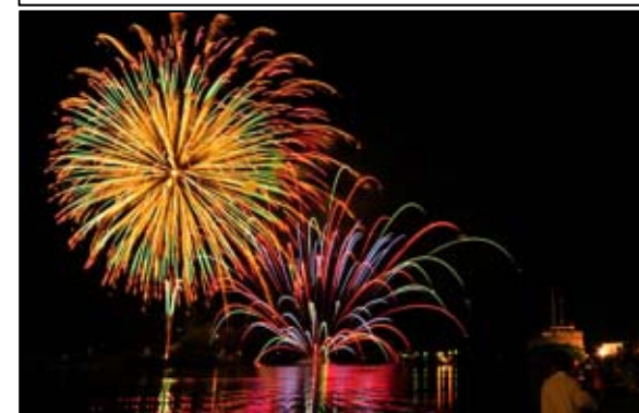
日向みなと・夢・みらい花火大会(7月)