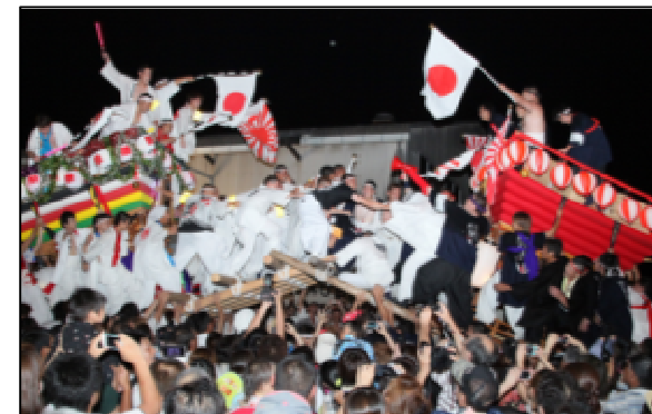
細島みなと祭り(7月)