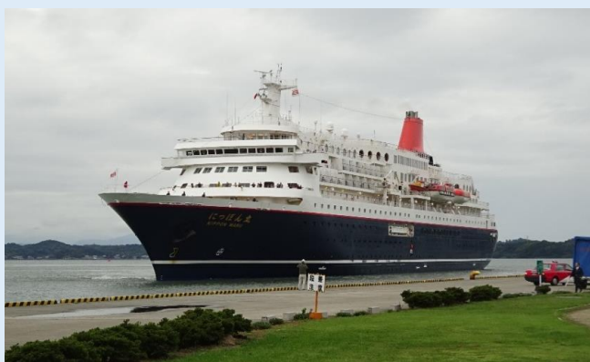
三角港 にっぽん丸（平成29年10月21日撮影）

日本の商船三井客船が運航する「にっぽん丸」（総トン数22,472トン）が、2017年10月16日に博多港を出発し、九州の別府港・宮崎港・鹿児島港・平土野港を經由して10月21日に三角港に寄港しました。船内では寄港を記念した歓迎式典が行われ、地元の子供達による太鼓の演奏でおもてなしをしました。乗客約290人の多くは、上天草市や熊本市などへの日帰りツアーを楽しんだとのこと。