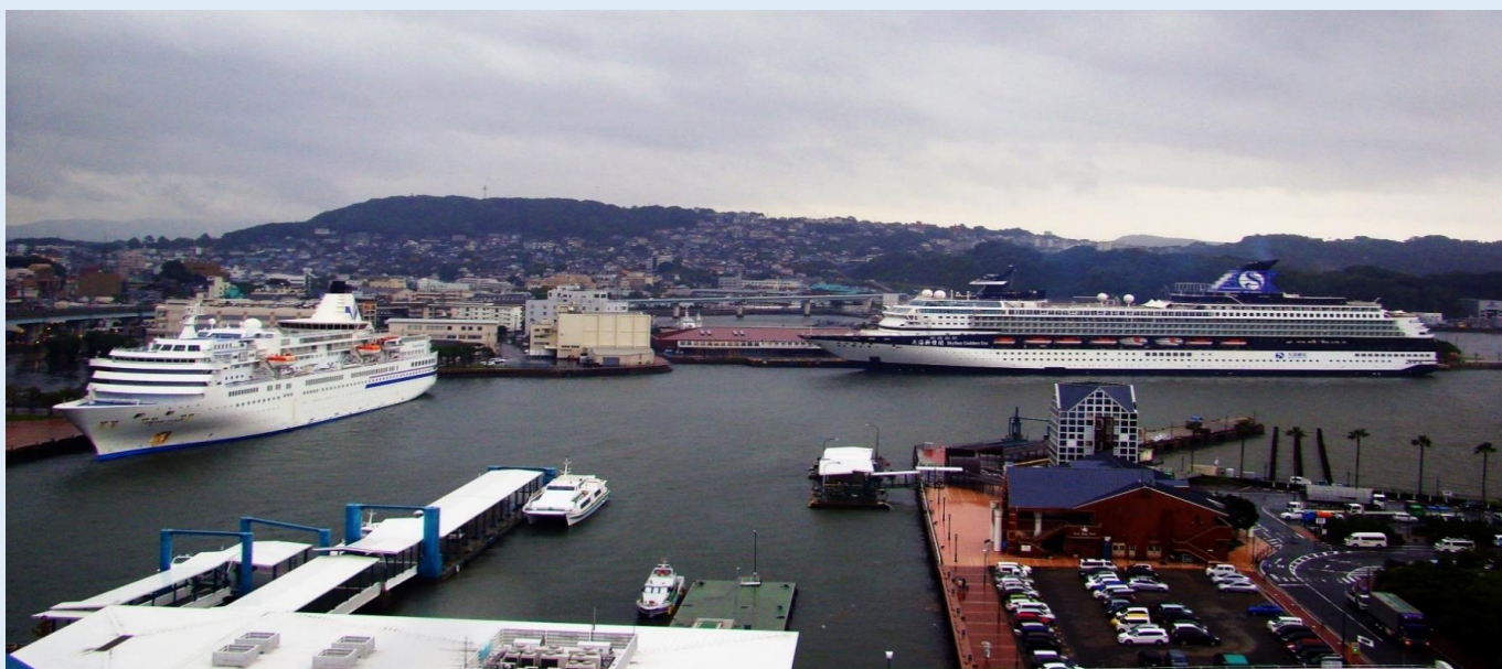
左ぱしふいっくびいなす 右スカイシー・ゴールデン・エラ 佐世保港同時寄港時の様子（平成29年10月2日撮影）

佐世保市港湾部は、今後もクルーズ客船だけでなく、多くの船舶が佐世保港に寄港し、2隻着岸する風景が佐世保港の日常の風景となったらと思いを馳せています。