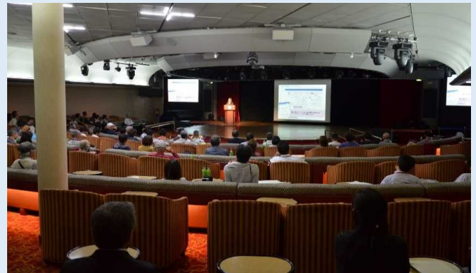
クルーズセミナーの様子