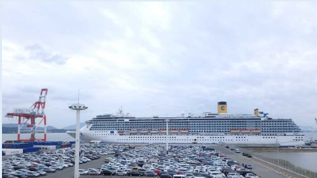
コスタ・アトランチカ(下関港)

夕方には岸壁で下関の特産品販売が行われ、乗客たちは下関の土産品を買って乗船し、着地港である天津港へ向けて出港しました。