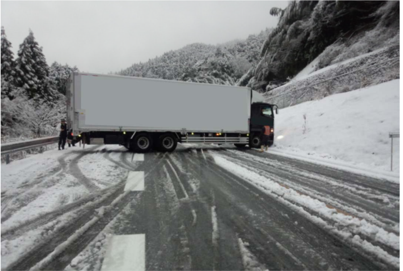
平成30年1月10日 国道201号 八木山バイパス スリップ車両発生状況