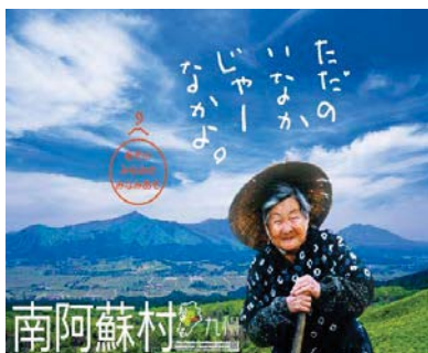
潜在的な南阿蘇村の魅力ある地域資源を創造します。

本学「篠原ゼミ」学生及びジャルパック企画担当者によるプロジェクトのキックオフ会議を5月24日(木)10:40より、本学文京キャンパスにて開催いたします。 ご多忙の折恐縮ですが、取材の場合には、 5月22日(火)正午までに、5ページ目の用紙に必要事項を記入の上、FAXにてご返信いただきますようお願い申し上げます。