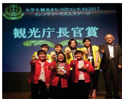
多数の地域活性化実績を誇る 跡見学園女子大学 篠原ゼミチーム