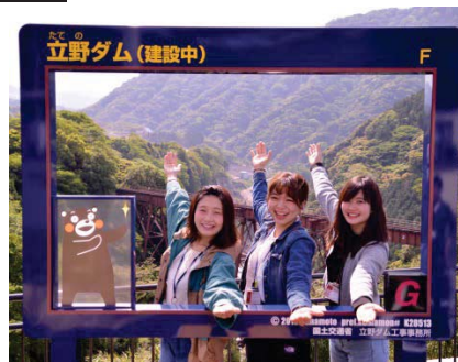
今話題のインフラツーリズム 完成を目指す 立野ダムと阿蘇の大自然が融合