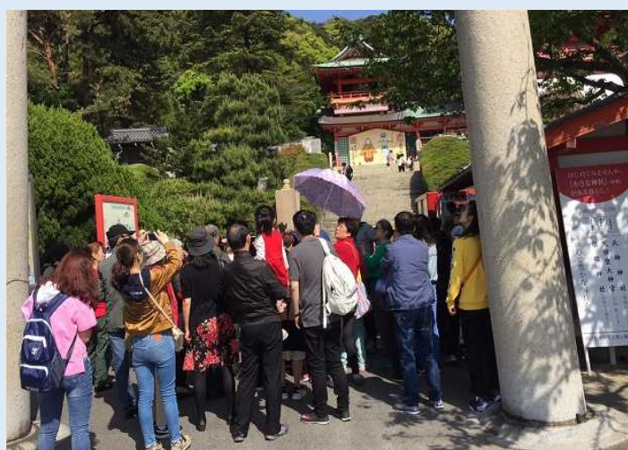
「赤間神宮」に訪れる乗客たち