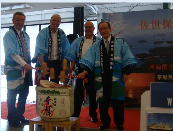
地酒の鏡開きの様子