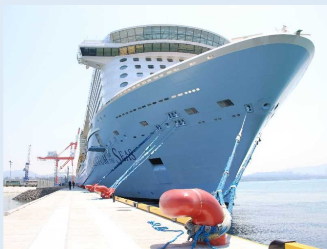
「クアンタム・オブ・ザ・シーズ」 下関港

また、今回の寄港において、港に税関検査を行う簡易施設が初めて設置されました。簡易施設の設置により、天候に左右されず、出入国手続きが速くなることから、クルーズ船乗客の市内滞在時間が増える効果が期待できるとのことです。