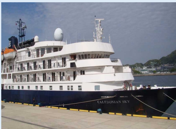
「カレドニアンスカイ」 佐世保港

セレモニーの最後は、佐世保市と同船の繁栄を祈念して、出席者の代表による地酒の鏡開きが行われるなど、温かいムードの歓迎となりました。