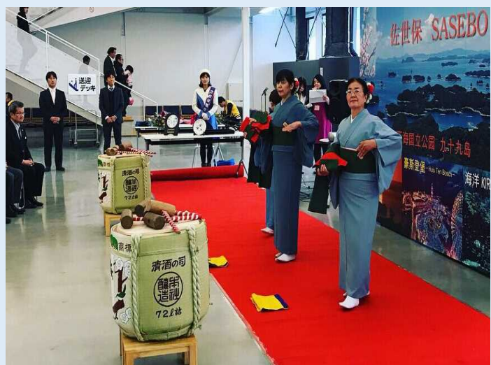
歓迎の「帯舞（おびまい）」の様子