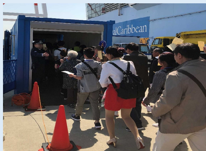
簡易施設で税関検査に向かう乗客