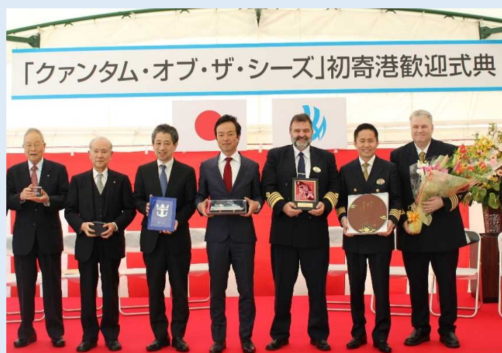
歓迎セレモニーの様子