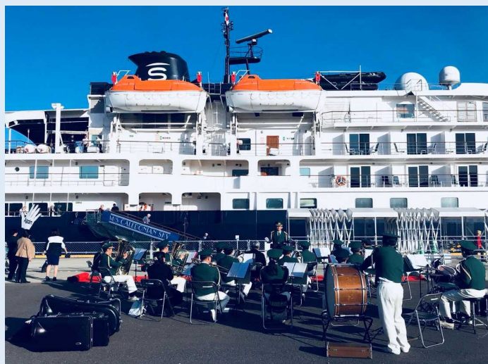
消防音楽隊による歓迎演奏