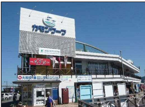
構成施設のイメージ