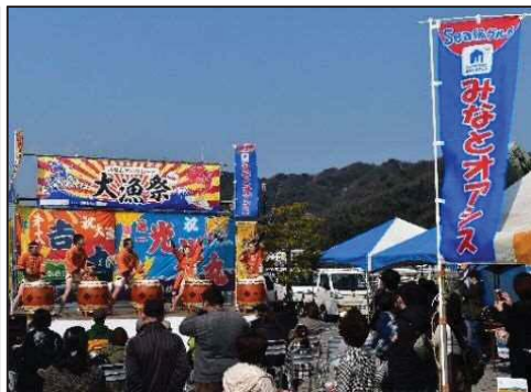
地域振興イベントの開催状況