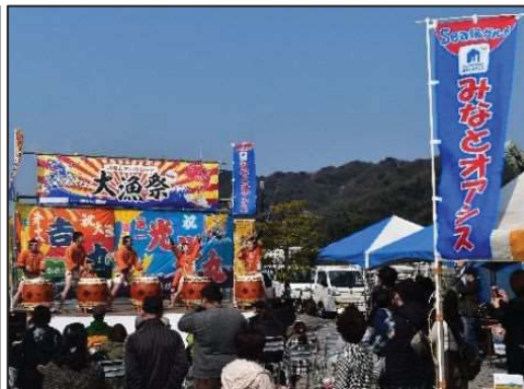
地域振興イベントの開催状況