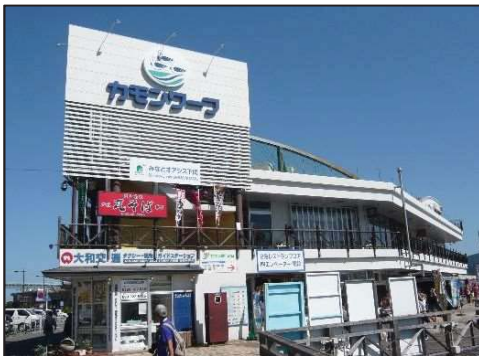
構成施設のイメージ