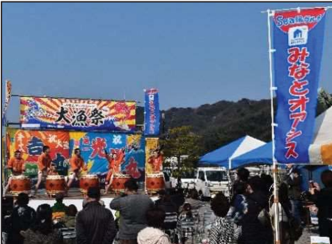
地域振興イベントの開催状況