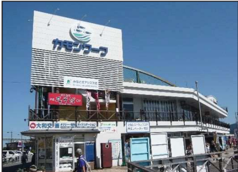
構成施設のイメージ