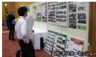
2Fポスターセッション