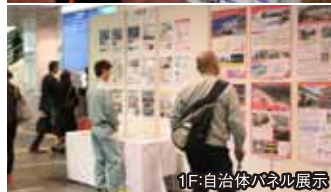
1F自治体パネル展示