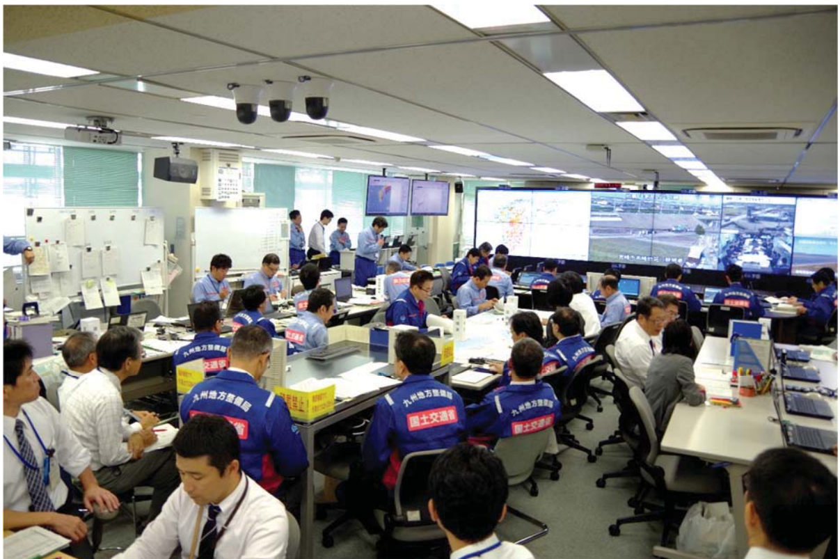
【災害対策本部運営訓練イメージ】