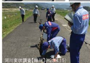
河川・道路の被災状況調査