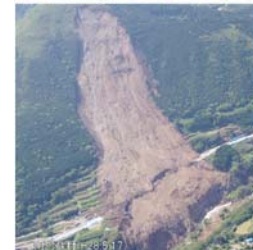
上空からの被災調査