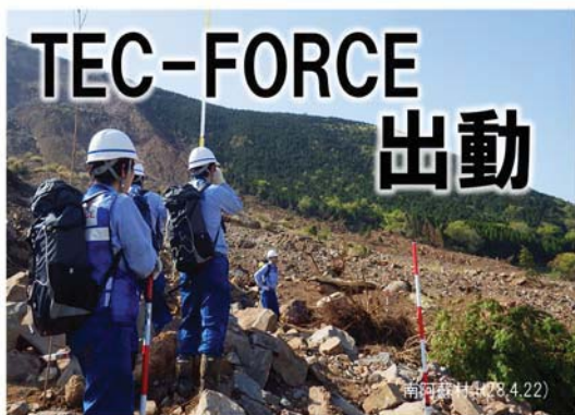
大規模崩落箇所の被災状況調査