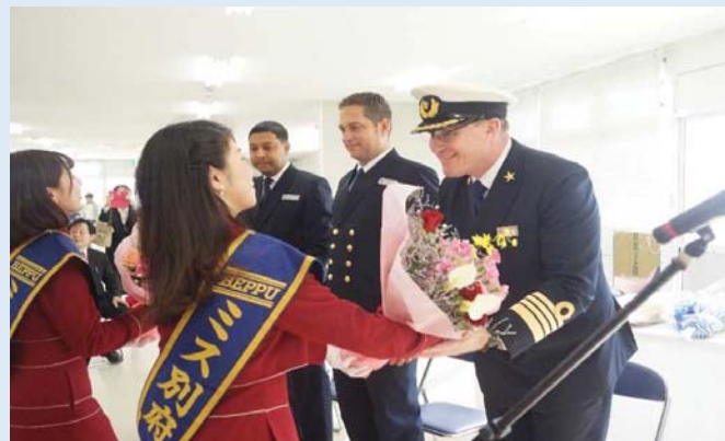
ミス別府から同船船長らへの花束贈呈の様子(別府港)