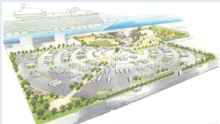
八代港クルーズ拠点 コンセプト図

写真左より 熊本県 営業部長兼しあわせ部長「くまモン」 熊本県 蒲島知事 ロイヤルカリビアン社 ジョン・ターセック副社長 九州地方整備局 村岡副局長