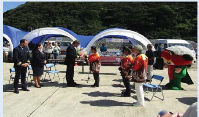
花束贈呈の様子（青方港）