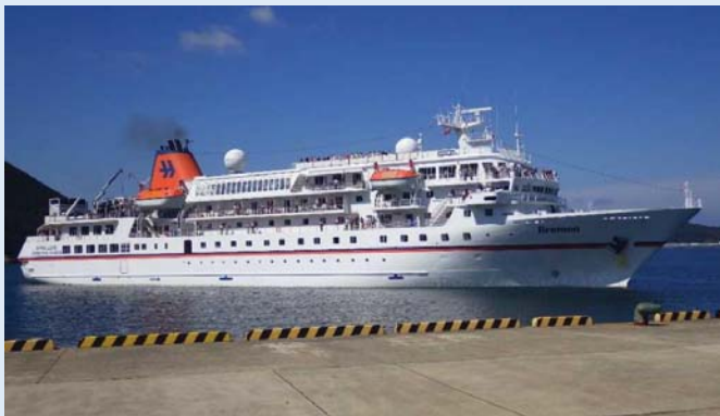
「ブレーメン」（青方港）

唐津港では、乗客が唐津市内や焼き物で有名な有田町、伊万里市の観光地を訪れ、天候上の理由により入港時の歓迎行事は中止されましたが、出港時には市民が手を振ってお見送りしました。