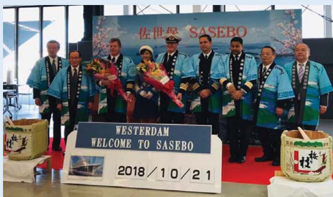
歓迎式典の様子(佐世保港)