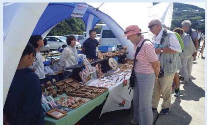
地元特産品販売の様子（青方港）