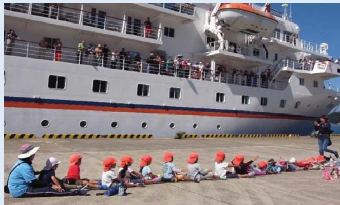
乗客を出迎える園児たち（青方港）