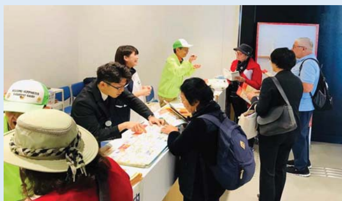
乗客に対応する地域の観光協会やボランティアの方たち(佐世保港)