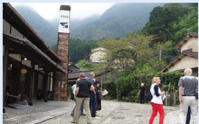
大川内山を観光する乗客（伊万里市）