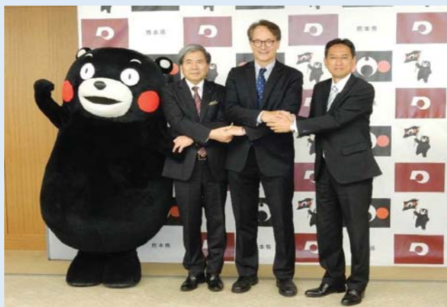
合同記者発表 フォトセッション

2018年10月5日に、八代港クルーズ拠点の基本計画について、熊本県、ロイヤルカリビアン社及び国土交通省の三者合同で記者発表を行いました。