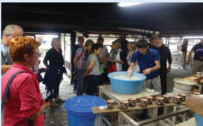
源右衛門窯の工房を見学する乗客（有田町）