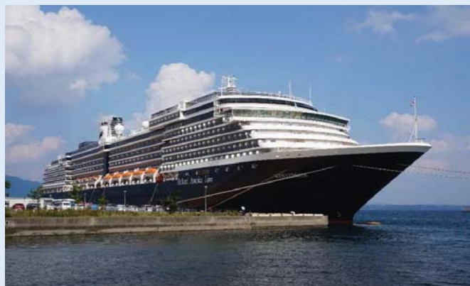
「ウエステルダム」(別府港)

別府港、佐世保港の各港で歓迎式典が催され、別府港ではミス別府から同船船長への花束贈呈や港湾関係者との記念品交換が行われました。別府港を訪れた乗客は、別府市内の地獄巡りや大分県内の観光地巡りを楽しみました。また、佐世保港を訪れた乗客は、九十九島やハウステンボスなど佐世保市内を中心に観光地を巡りました。