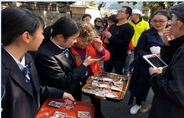
なまり節の試食の様子 (飫肥城下)