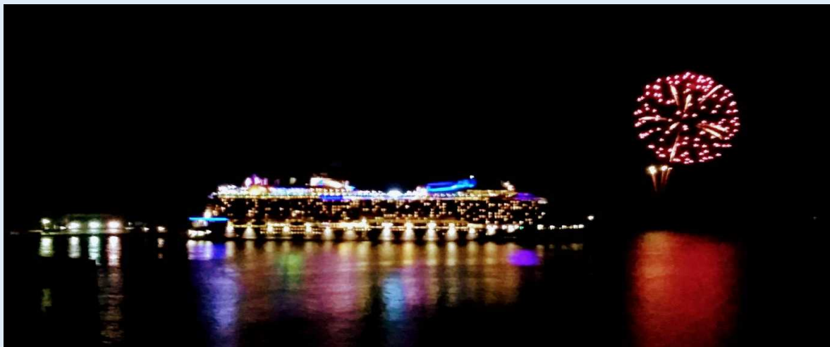
油津港出港時の「クァンタム・オブ・ザ・シーズ」