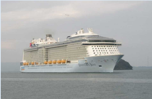
「クァンタム・オブ・ザ・シーズ」