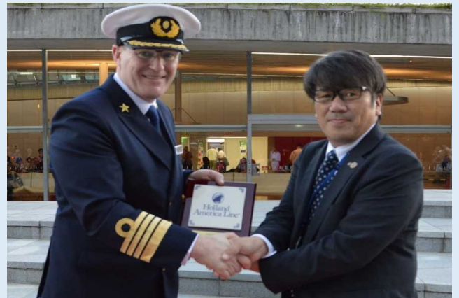
記念品贈呈の様子