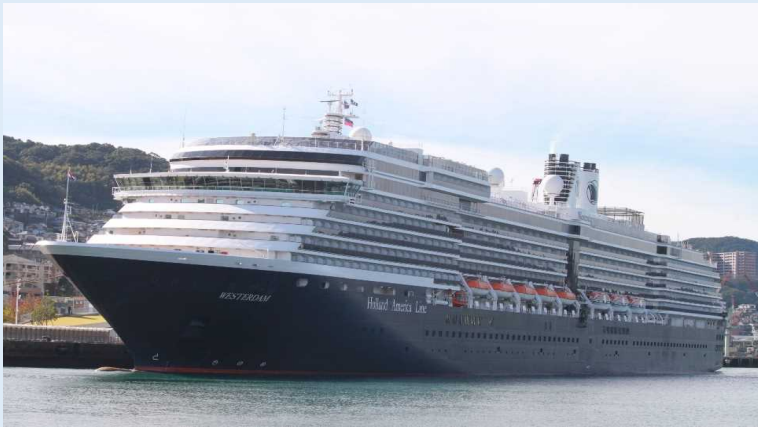
「ウエステルダム」（長崎港）

長崎港では歓迎式典が催され、同船船長から長崎市関係者へ記念品が渡されました。バスツアーの乗客は平和記念公園、原爆資料館や稲佐山展望台などの観光地を巡りました。また、個人で観光した乗客も多数おり、主に長崎市内の観光地を訪れたようです。