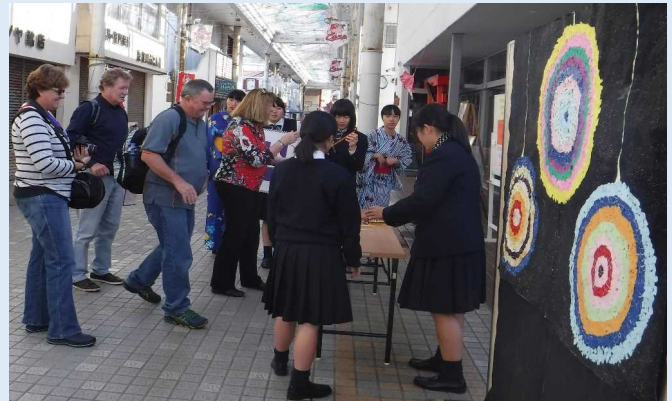
生徒たちによる観光案内の様子 (油津商店街)