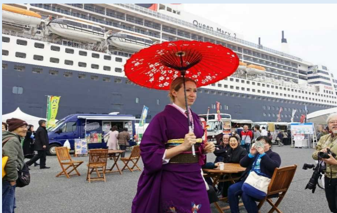
着物着付けショーの様子