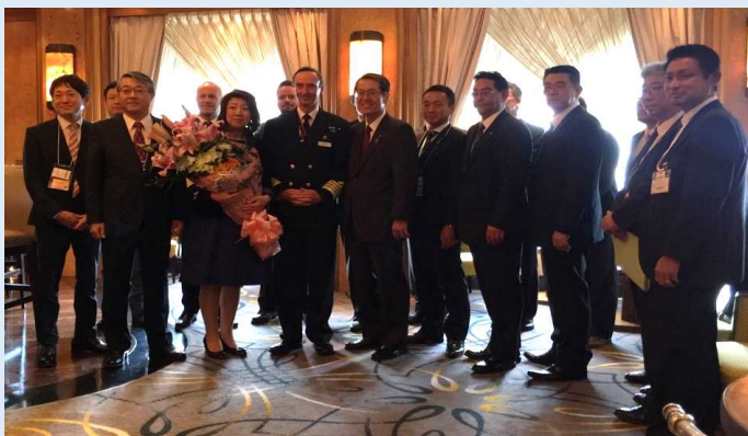
記念式典の様子(クイーン・メリー2 船内)