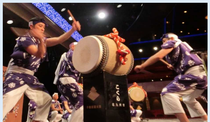
和太鼓演奏の様子(クイーン・メリー2 船内)