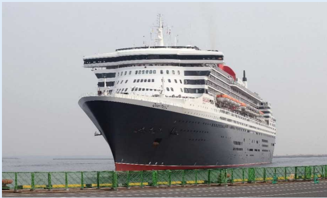
「クイーン・メリー2」北九州港

また、船内では、初寄港の記念式典が行われ、式典出席者は和太鼓の演奏を鑑賞しました。