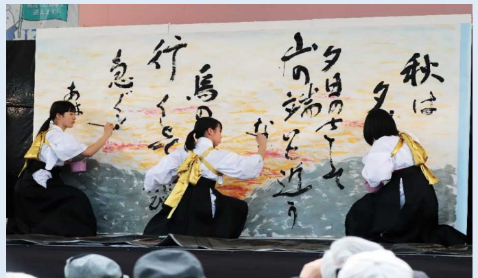
地元高校生による書道パフォーマンス