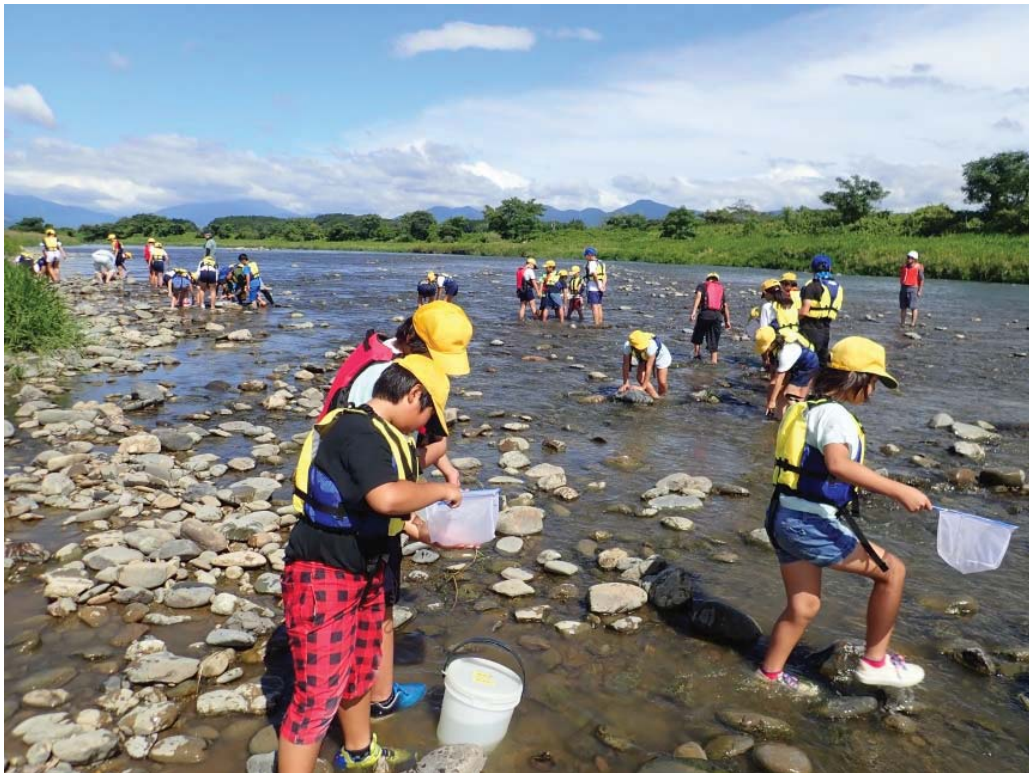
球磨川水系 球磨川 球磨大橋上流 木上小学校