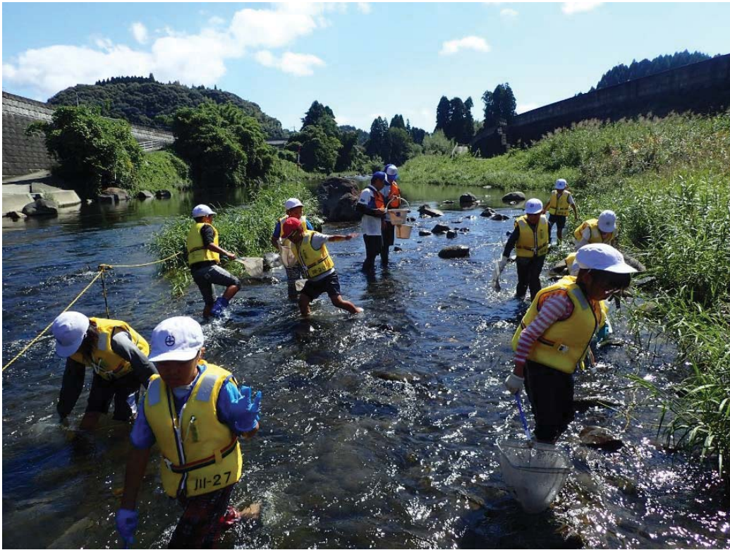
川内川水系 久富木川 東橋付近 さつま町立山崎小学校