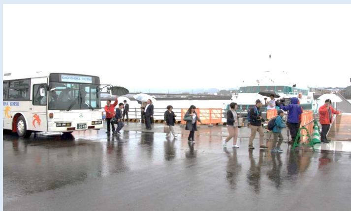
連結バスから高速船へ向かう乗客