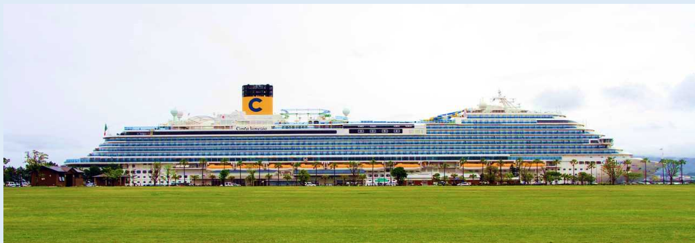
コスタ・ベネチア（鹿児島港マリポート）