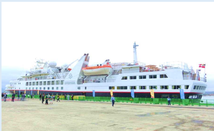
シルバー・エクスプローラー（唐津港）

下船後、乗客約120人（スタッフ込）はバスで唐津城や旧高取邸、鏡山展望台、曳山展示場、唐津焼の窯元などを巡り、唐津文化を堪能しました。出港時には地元の中学校・高等学校吹奏楽部の演奏が行われ、乗客を見送りました。