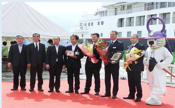
入港歓迎式での記念撮影の様子