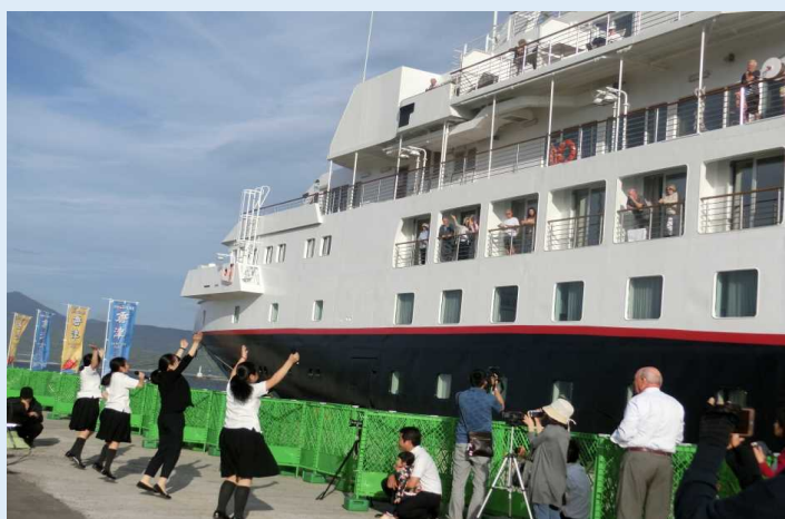
出港時 見送りの様子