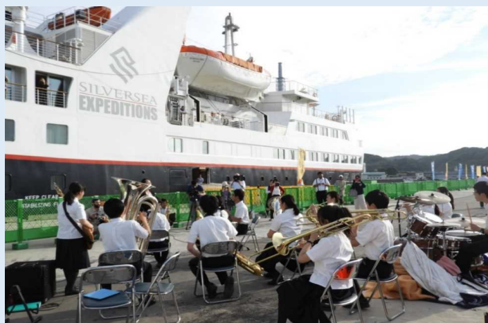
地元の中学校、高等学校吹奏楽部による演奏