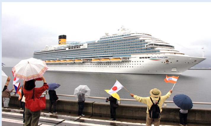
雨の中クルーズ船を出迎える人々