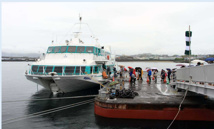
高速船に乗り込む乗客