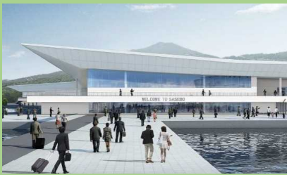
▲官民連携による国際旅客船拠点形成イメージ