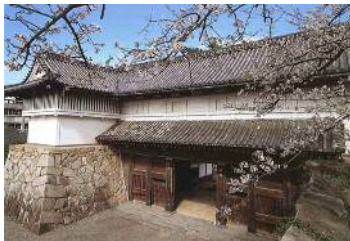
【佐賀城鯨の門及び続櫓】

佐賀市の「歴史まちづくり計画(第2期)」について、歴史まちづくり法に基づき、3月22日付けで主務大臣(文部科学大臣、農林水産大臣、国土交通大臣)が認定しました。