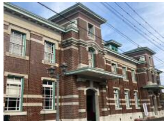
【長崎街道 (佐賀市歴史民俗館)】