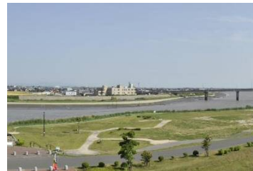
【史跡三重津海軍所跡】

今回の認定により、九州で歴史まちづくり計画に取り組む14都市のうち、第1期計画を完了し、第2期計画の取組を進める都市は2都市となります。