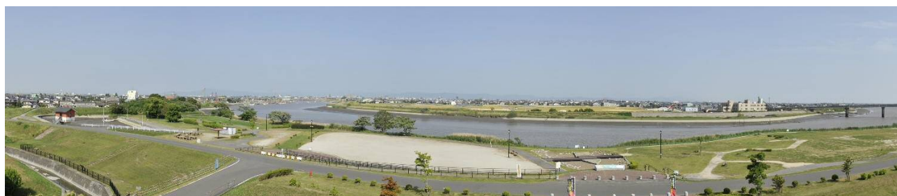
史跡三重津海軍所跡全景

第2期計画では、史跡三重津海軍所跡の遺構を恒久的に保護しつつ、来訪者の理解をより一層深めてもらうための史跡整備事業をはじめ、歴史的建造物の保存・活用、歴史資産等の周遊環境整備、地域固有の歴史文化の継承と市民の理解促進に、引き続き取り組みます。