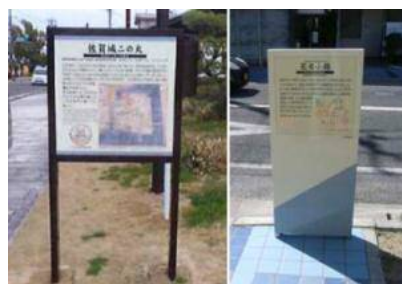
案内・説明看板等の整備