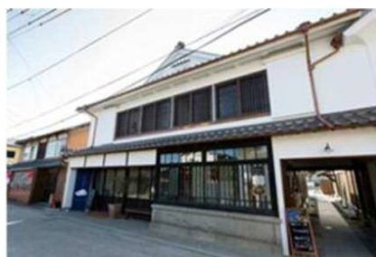
旧久富家住宅取得・保存改修