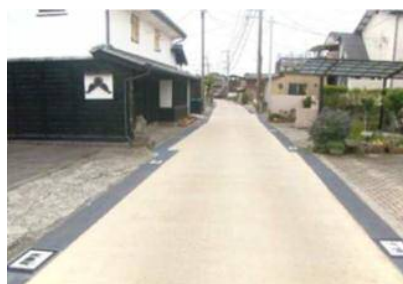
長崎街道 道路整備(カラー舗装)