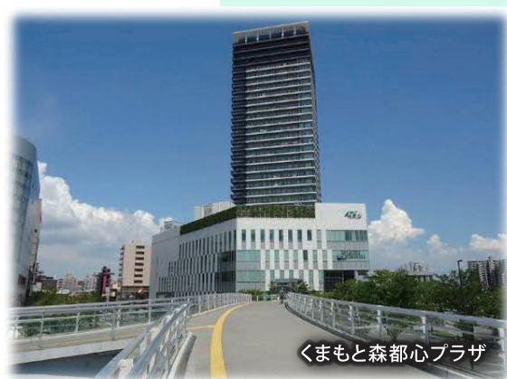
くまもと森都心プラザ