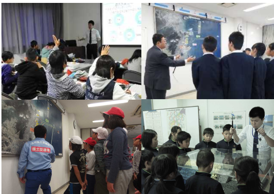
写真-2 講義内容の様子

苅田港全体の大型航空写真や防波堤の模型を使い、港がどうなっているかを空から海の中からと想像してもらいます。講師は、所長・課長や係長、係員など誰でもできる内容となっています。そして、人口約3万7千人の町が港を通じてどのように発展しているかを学習します。