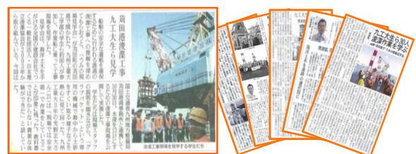
図-5 読売新聞外数紙の見学会掲載記事