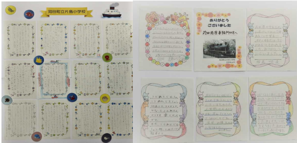
写真-4 子どもたちが書いた感想とお礼の言葉

の外から来る波を小さくして、港の中の波を静めるとい う役割をしているんだ。防波堤が波から港を守ってくれ ているそうだ。私は勉強で防波堤とはどんなに大切な物 かわかった」など、たくさんの意見や感想、自分の考え が書かれていました。講義の内容はしっかり伝わってい ます。