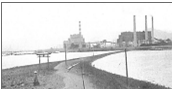
写真-7 1960年代までであった道中（みて：砂州の意） 現在の神ノ島から苅田発電所方向を撮影

そこには、父や母、多くの祖先の人生があります。港の学習や現場見学を通して、海から見る自分の町の姿はこれまでとは違って見えることでしょう。「現場見学会」は、歴史や自然・文化などの継承にも関連しています。港の現在・過去・未来を継承していく必要があります。