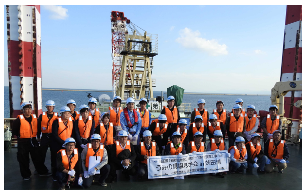
写真-8 作業船上での集合写真

とりわけ、地元小学生の「苅田みなと博士」育成は、時間軸の点からも未来につなぐ取り組みとして大切です。これからは、新型コロナウイルス感染拡大防止のため、新たな生活様式に対応した見学会のあり方を工夫していく必要がありますが、未来に種蒔く「苅田みなと博士」育成をはじめとして、引き続き港湾の広報活動を強化していくこととします。