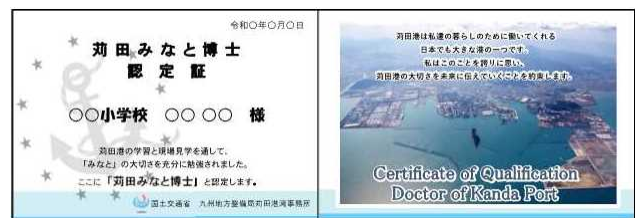
図-3 認定証 表