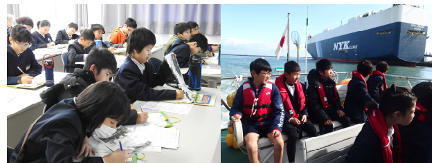
写真-3 室内講義と海上現場見学

講義を受講し、船で港内見学を終えた小学生は、「苅田みなと博士」として認定します。未来を担う小学生に、将来にわたって港の情報発信の役割を担当してもらうためです。未来に種蒔く取り組みです。すでに115人(2020年3月現在)の「苅田みなと博士」が誕生しています。