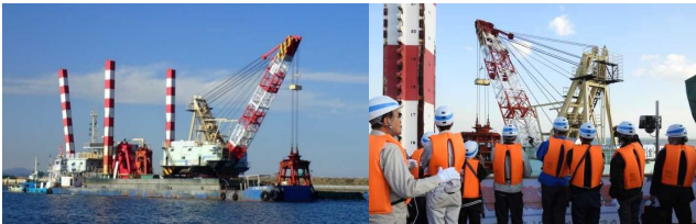
写真-5 作業船の浚渫状況と現場見学の大学生

2019年10月30日には、一般社団法人日本埋立浚渫協 会主催による「第25回うみの現場見学会」が苅田港で 開催されました。九州では3回目の開催です。九州工業 大学生27名を招き、苅田港湾事務所が発注している苅 田港の現場を浚渫作業船に乗船し、体感していただきま した。