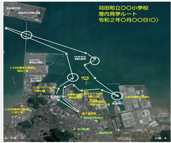
図-1 港内見学ルート図