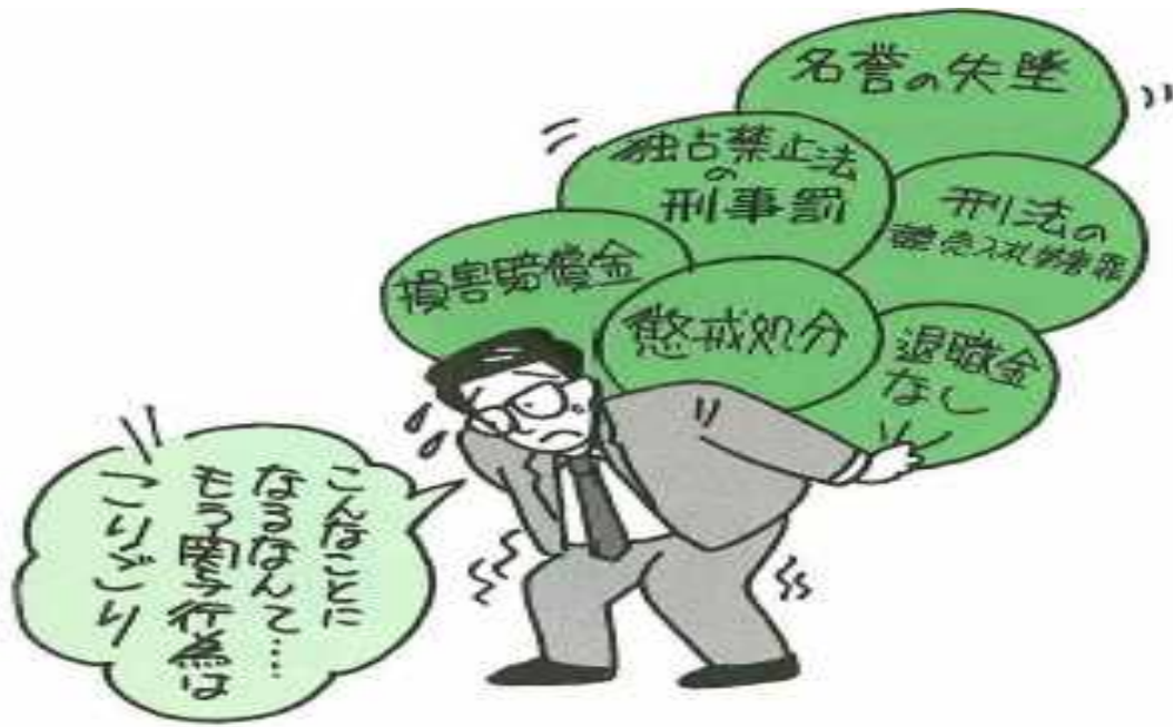
退職金なしは、懲戒免職の場合です

※マニュアル中に挿入しているイラストは、「官製談合防止の手引き」（発行：財団法人建設業適正取引推進機構）から出典。