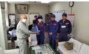
1/31手交式(被災状況調査)