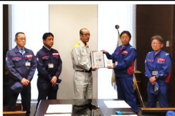
1/28手交式(通行可能調査)