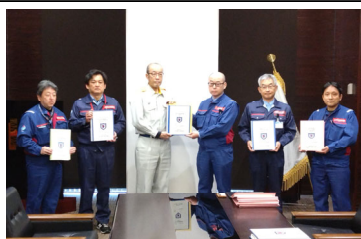
2/26手交式(被災状況調査)