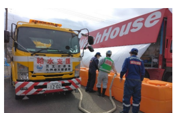
移動式ウォーターに給水(輪島市)