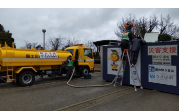
コンテナ型トイレに給水(能登町)