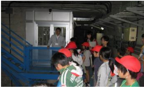
ダム内部を案内中