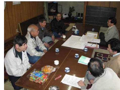
①集落元気づくりの基礎調査(区長への事前 聞取調査、全世帯アンケート調査)

基礎調査は対象集落すべての世帯をまわることにより、その後のワークショップを円滑に進めるための挨拶にもなる。