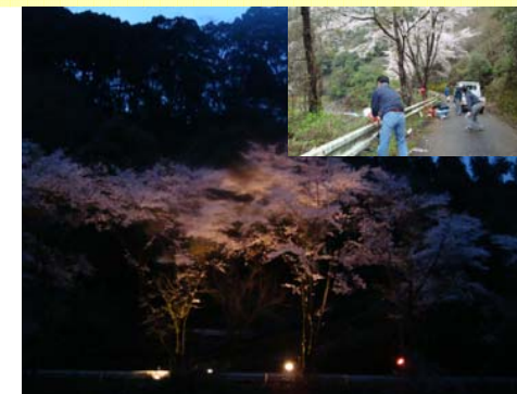
③WS後の集落元気づくりの実行状況 (桜のライトアップと清掃活動等)

集落元気づくりに関連する情報の提供や定期的な集落元気づくりの進捗状況の確認(フォローアップ)を行い、集落単独では行えない事項(人材、資金、技術、情報等)についての支援を検討する。