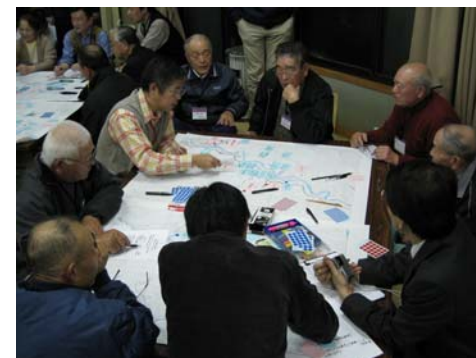
②集落元気づくりのきっかけづくり (集落元気づくりWS)

また、他出者等の集落外部居住者の集落に対する意向を把握し、Uターンや支援体制検討にあたっての課題をまとめる。