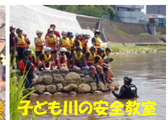
子ども川の安全教室