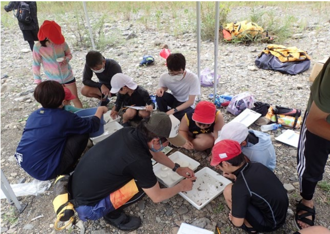
番匠川水系 番匠川 とぎわせき 常盤堰