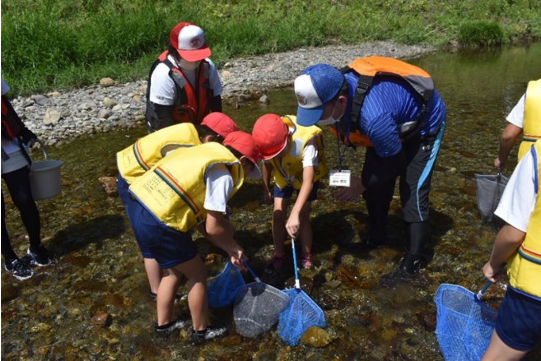
川内川水系 川内川 あまほし 麓橋上流