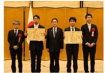
第7回表彰式（令和6年1月18日） 受賞者と岸田総理の記念撮影