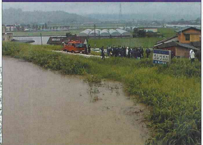
小城市牛津町砥川地区国道34号牛津大橋上流