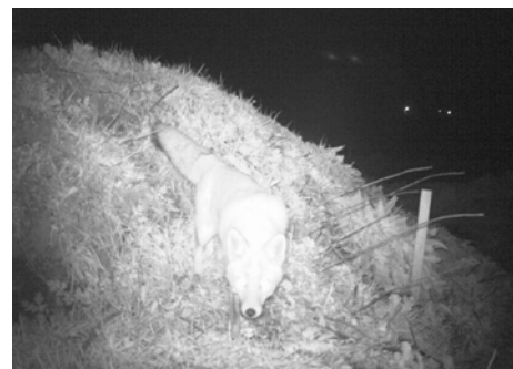
▲無人撮影で確認されたキツネ