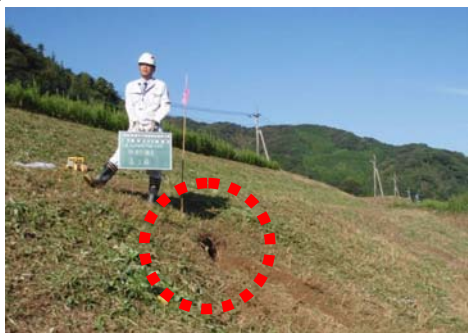
▲堤防で発見された巣穴