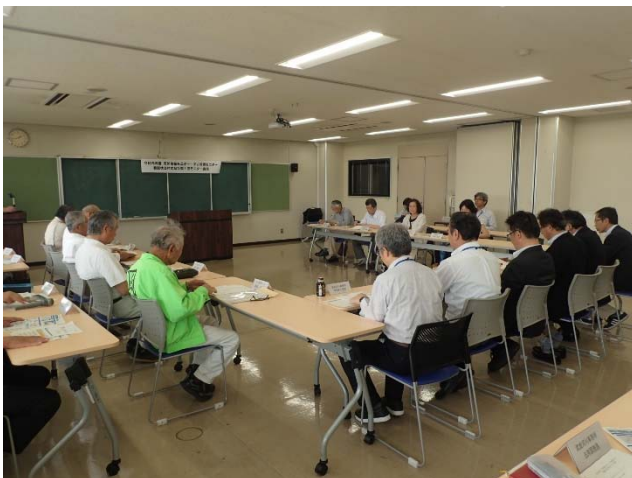
モニター会議（武雄河川事務所 会議室）