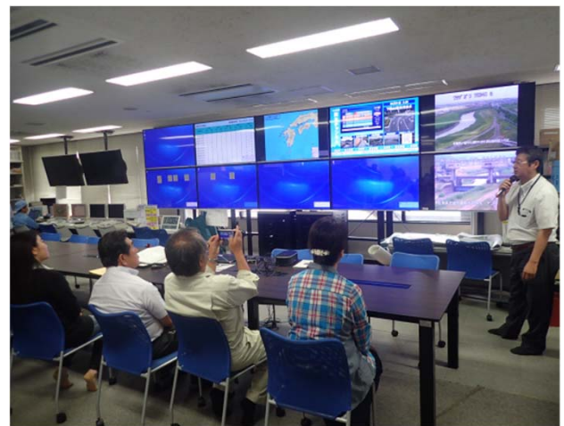
武雄河川事務所 防災情報室の見学会