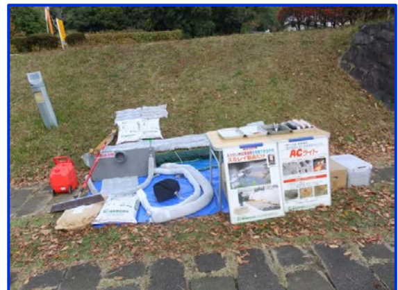
水質事故対応資材の展示 (昨年度)