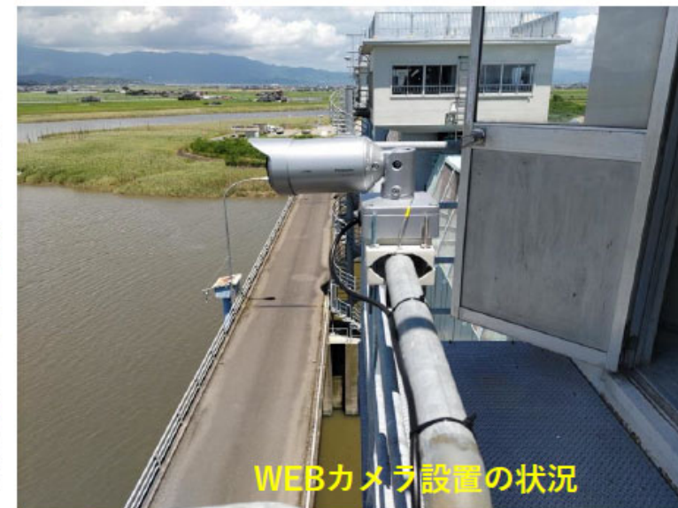
WEBカメラ設置の状況