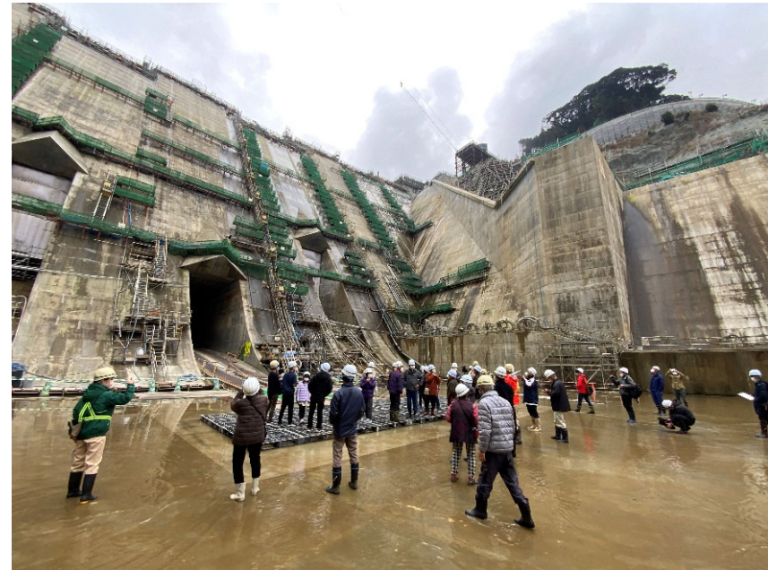
R5.1 一般募集 放流口ウォークイベント 【90名】