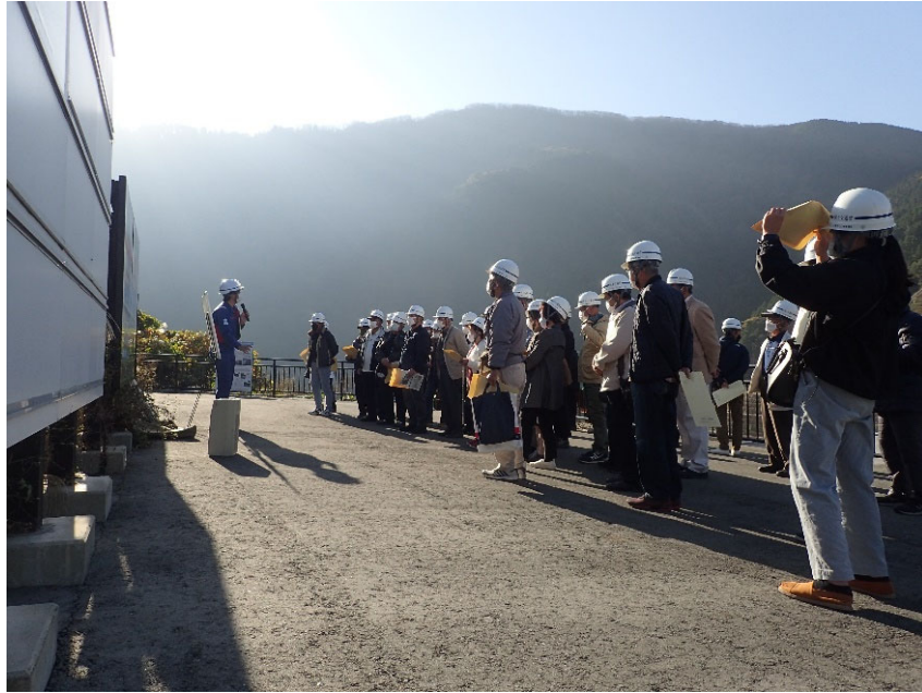
R4.11 熊本市住民現地説明【35名】