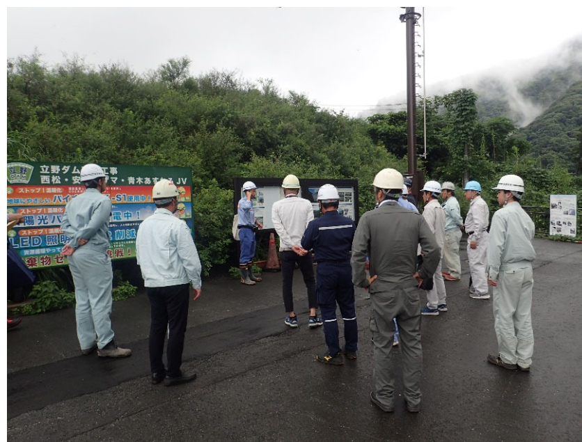
R5.7 宇土市建設業協会現地説明【20名】