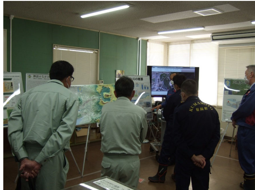
R4.11 菊陽町長・職員現地説明【4名】