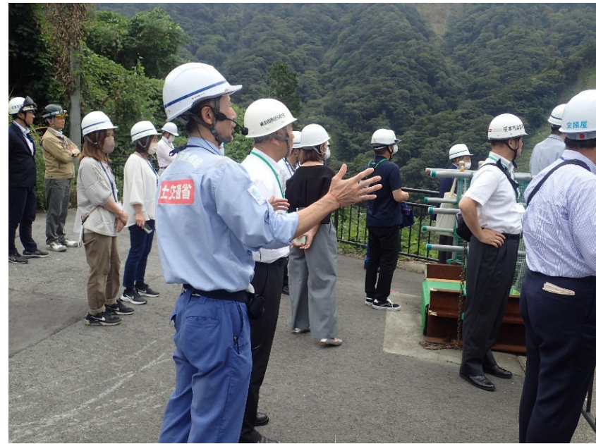
R5.9 熊本県防災協会【45名】