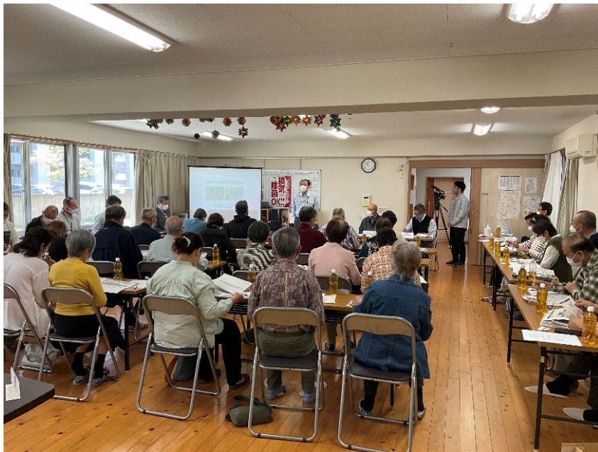
R4.4 熊本市大江校区住民事業説明【25名】