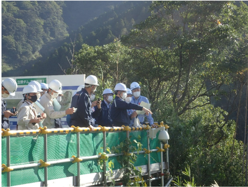
R3.10 熊本市首長・職員現地説明【14名】