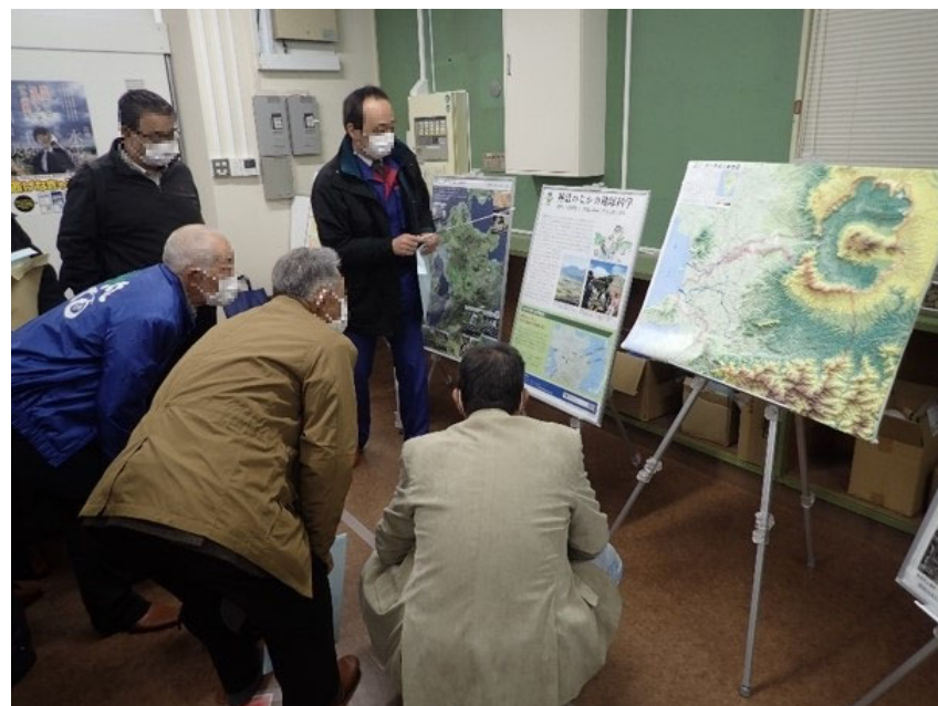
R3.2 流域外自治体住民現地説明【10名】