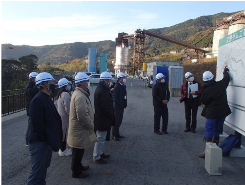
R2.12 大津町住民現地説明【8名】