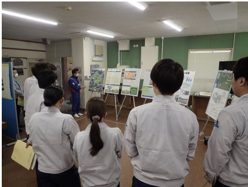
R5.4 九州建設マネジメントセンター新採研修現地説明【18名】