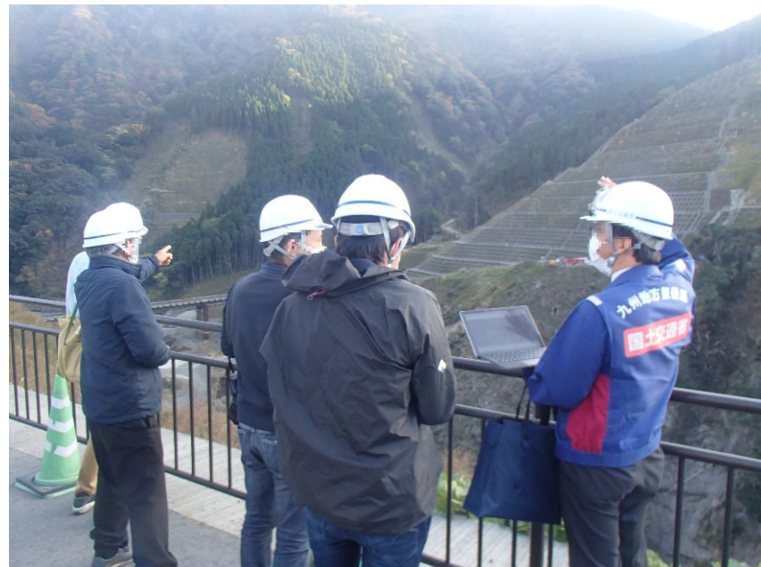
R3.11 一般住民現地説明【5名】