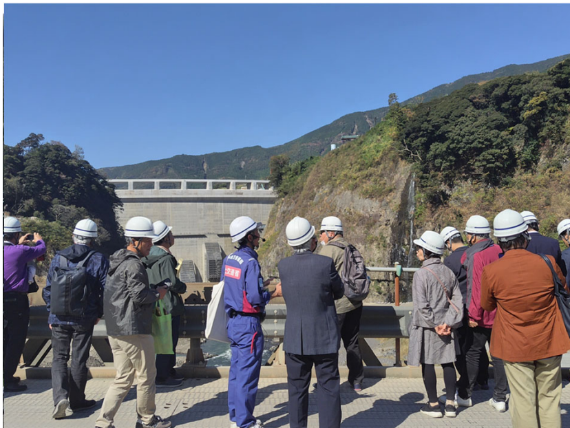
R5.11 一般住民現地見学【30名】