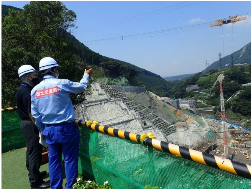
R3.7 大津町職員現地説明【3名】