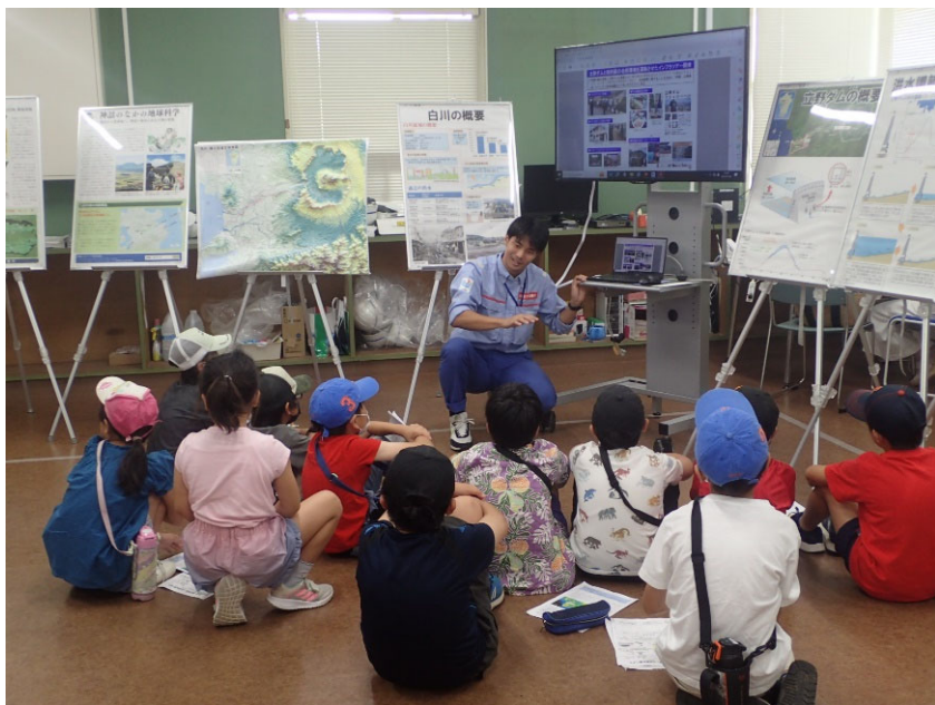
R5.7 一般市民現地説明【15名】