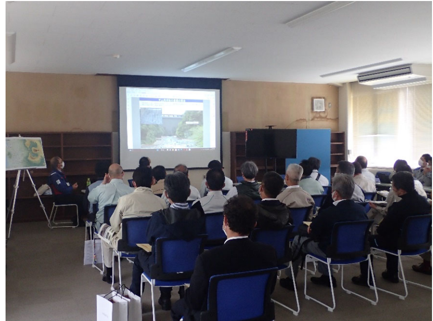
R4.11 日本建設業連合会現地説明【23名】