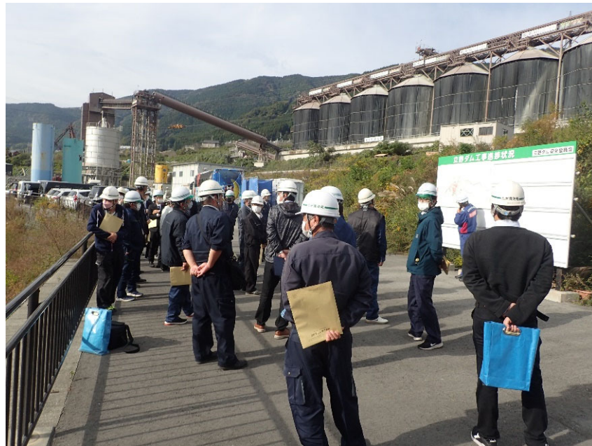
R4.11 九州農政局現地視察【32名】