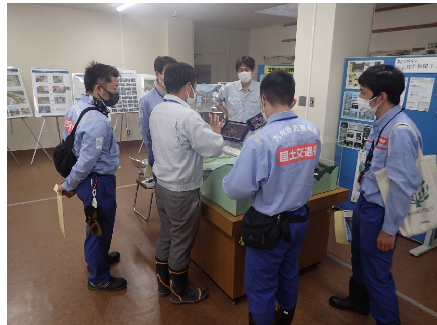
R4.9 大学生現地説明【1名】