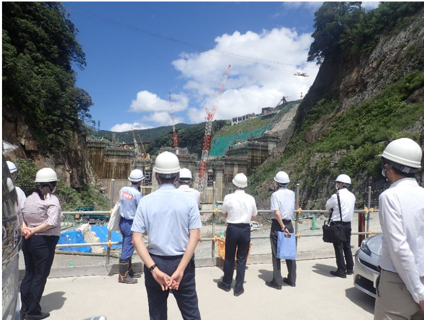
R4.7 熊本県職員現地説明【9名】