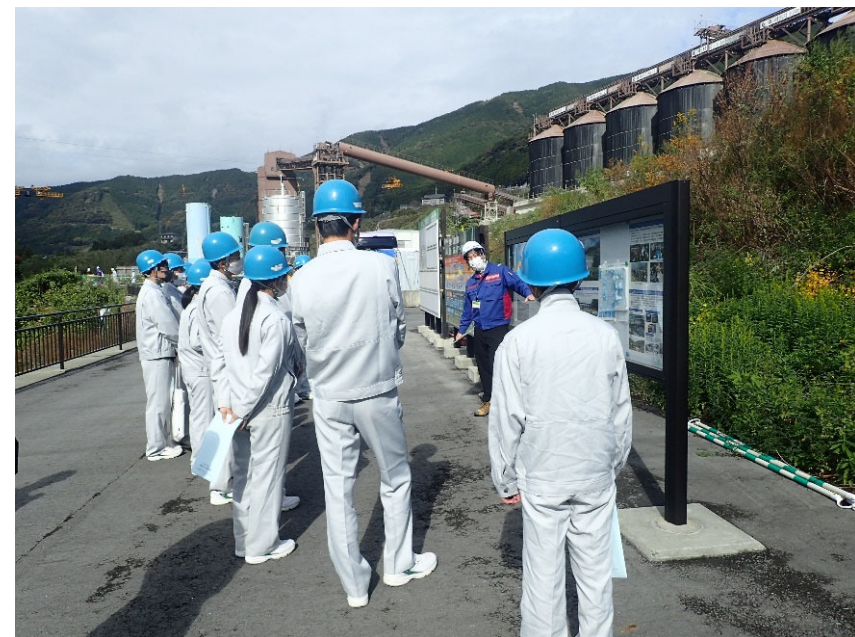
R3.11 高校生現地説明【81名】