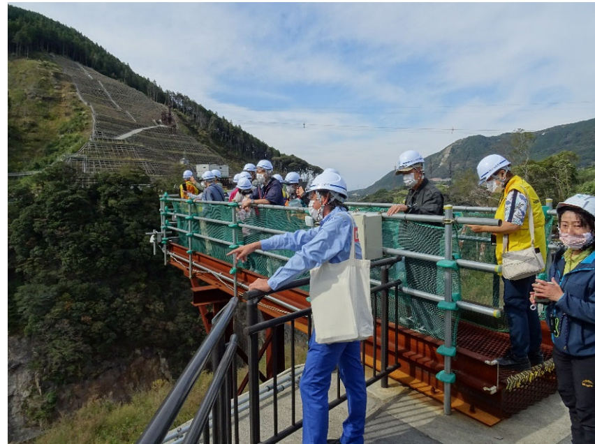
R3.10 一般住民現地説明【18名】