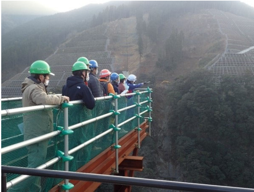
R2.12 一般住民現地説明【9名】