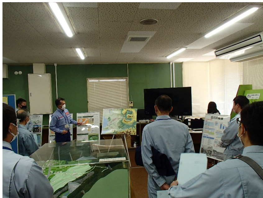
R3.10 行政機関現地説明【18名】