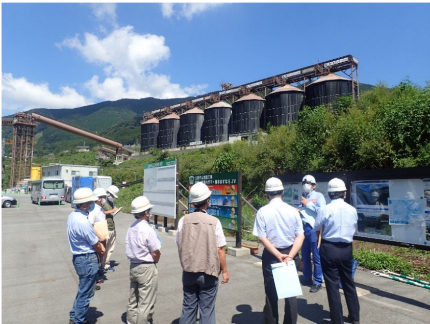
R3.9 大学関係者現地説明【10名】