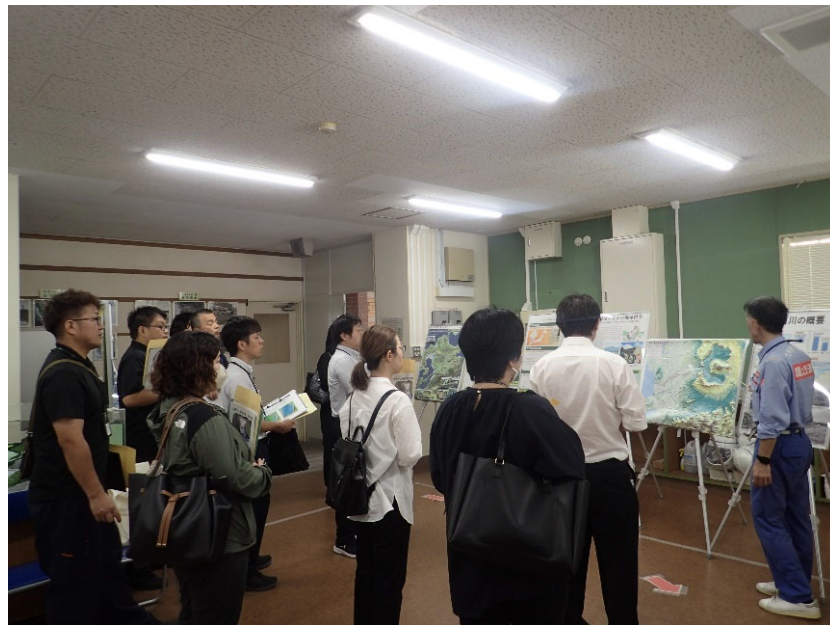
R5.9 流域外自治体職員【13名】