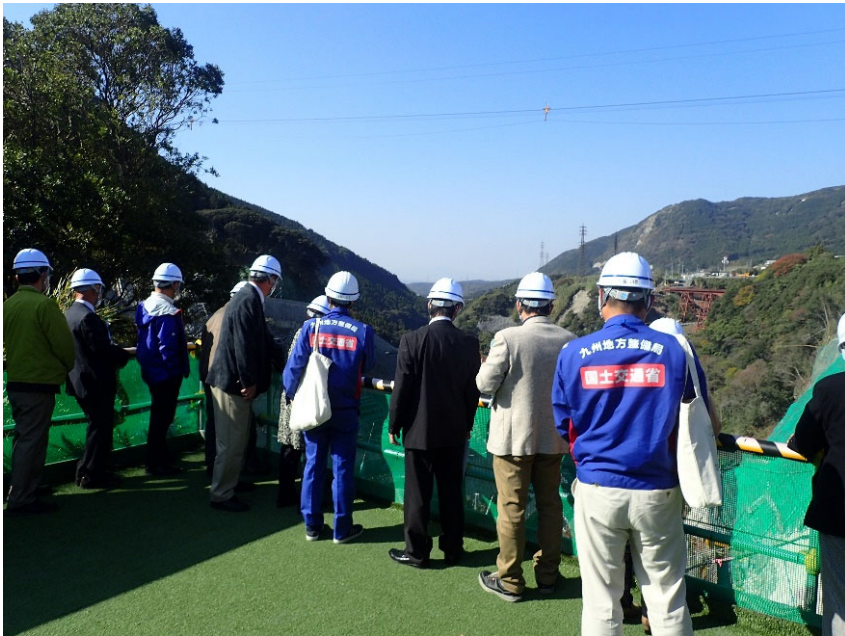
R3.11 流域外自治体議員等現地説明【12名】