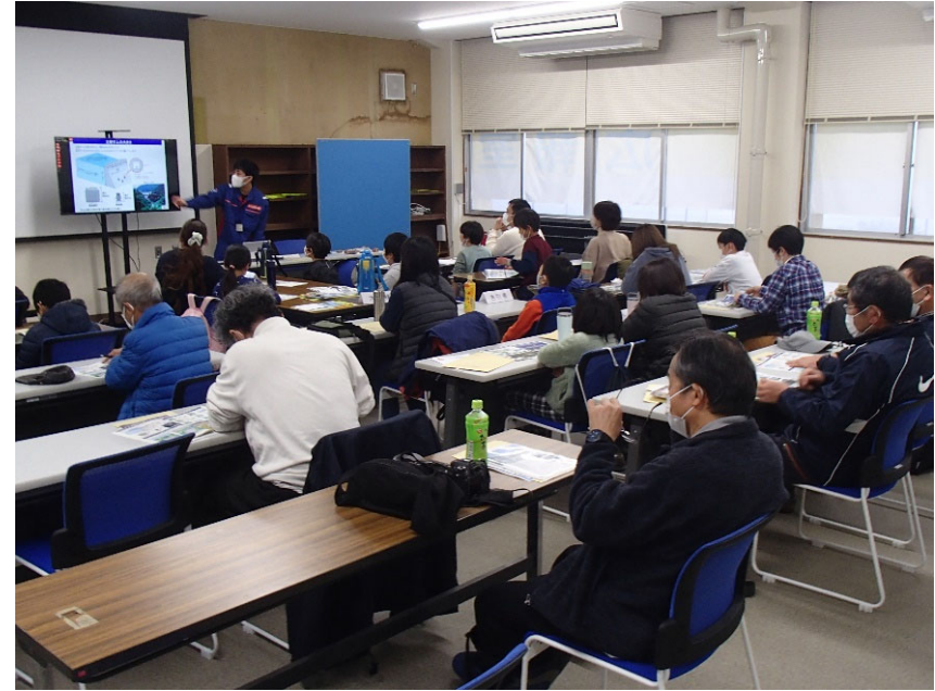
R4.11 白川上下流交流会【26名】