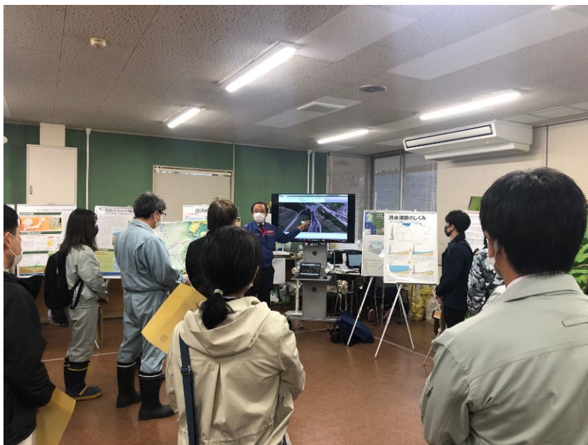
R4.11 ダム工学会現地説明【14名】