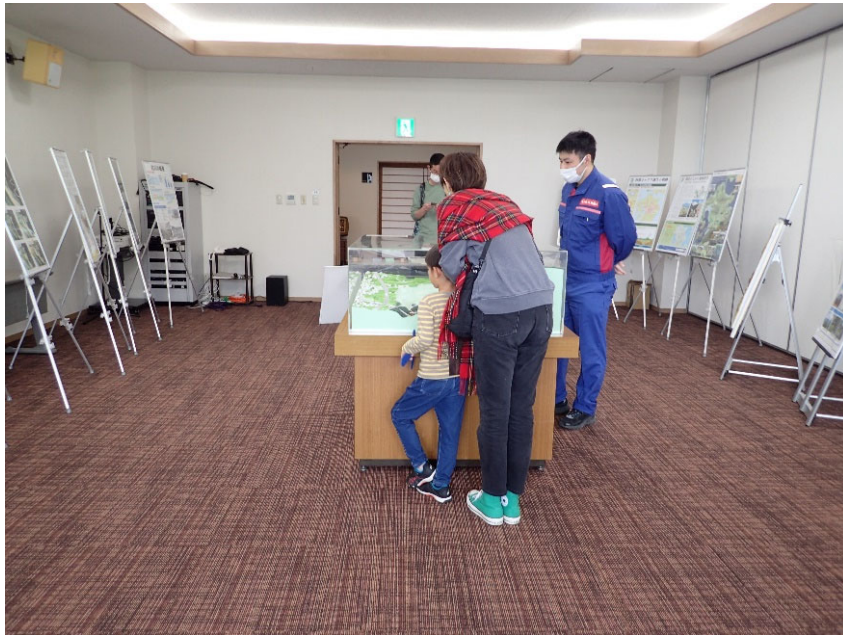
R5.4 第4回 阿蘇東急でアソぼうパネル展示【20名】