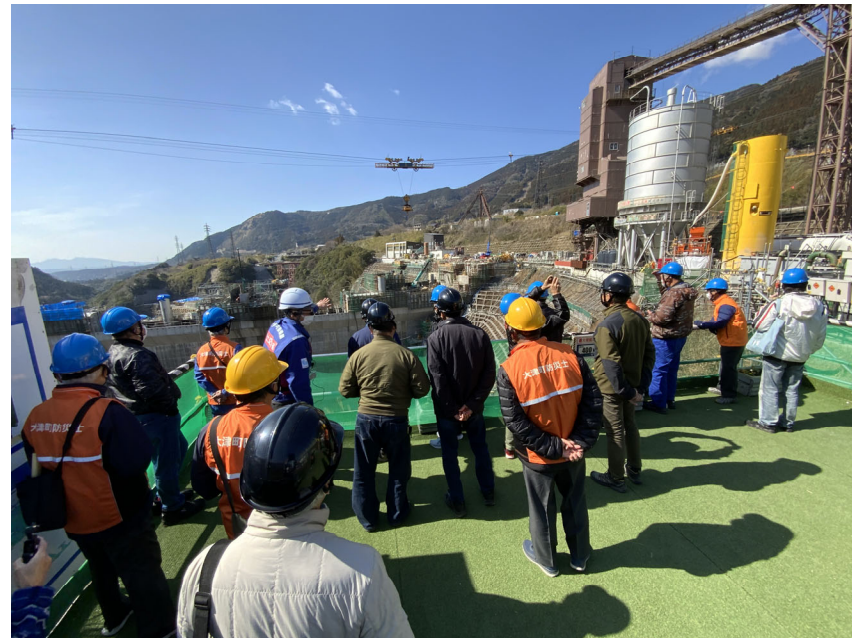
R5.3 大津町防災士現地説明【20名】