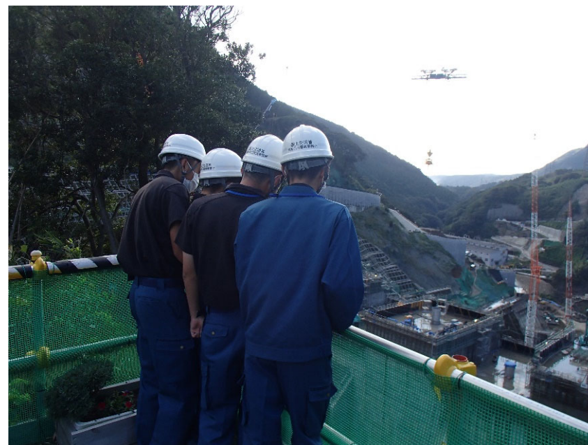
R4.10 高校生現地説明【4名】