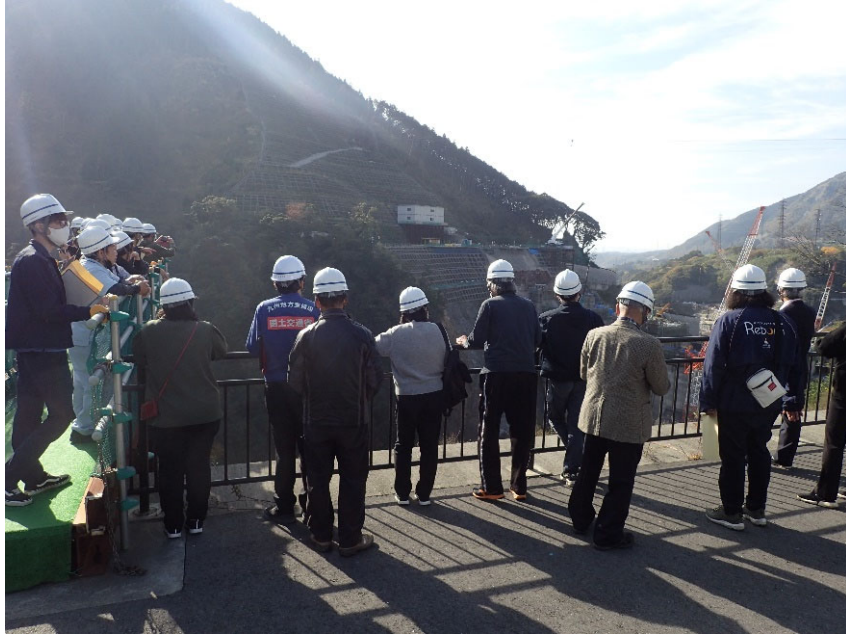
R4.11 流域外自治体区長等現地説明【23名】