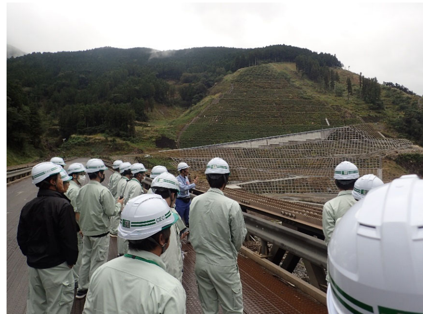
R5.10 建設コンサルタント現地説明【35名】