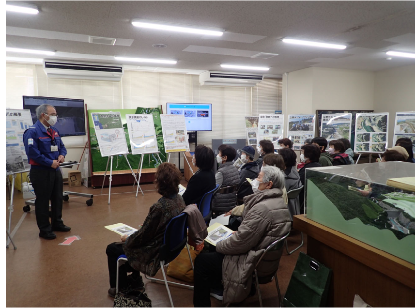
R5.3 大津町住民現地説明【23名】