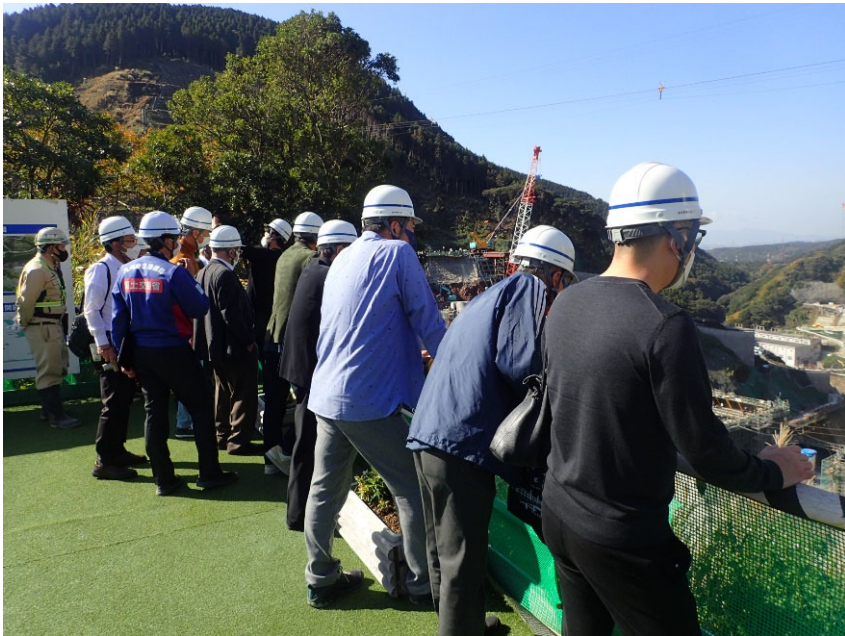
R4.11 一般住民現地説明【11名】