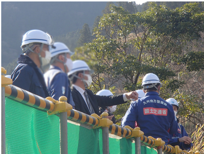
R3.12 流域外自治体首長等現地説明【6名】