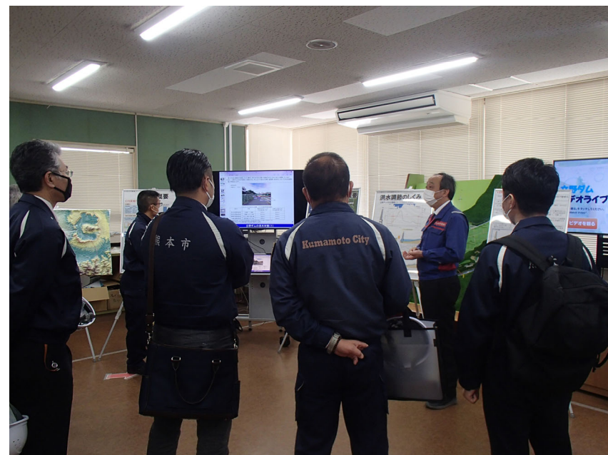
R5.3 熊本市危機管理防災総室現地説明【7名】