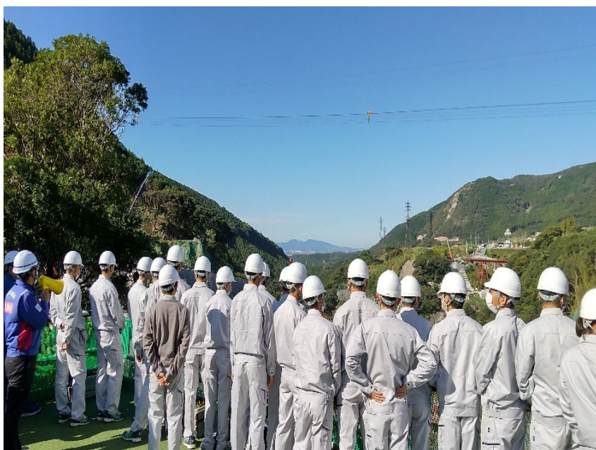
R4.10 高校生現地説明【43名】