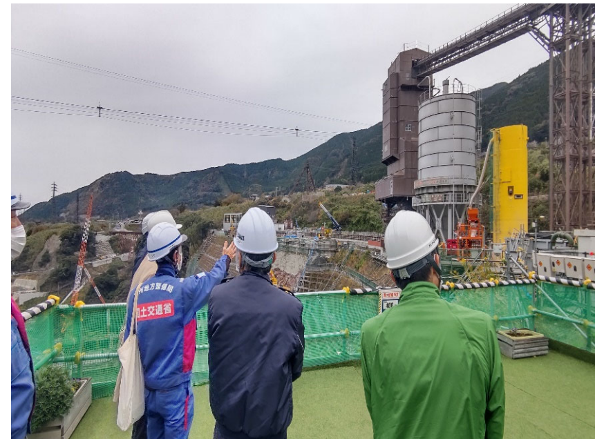
R4.12 熊本県副知事等現地説明【4名】