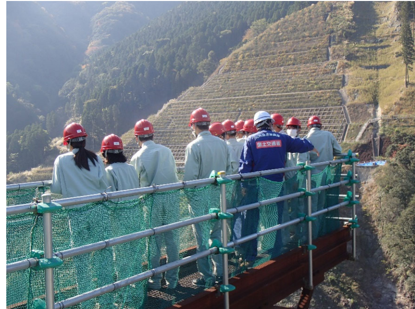
R3.11 高校生現地説明【30名】