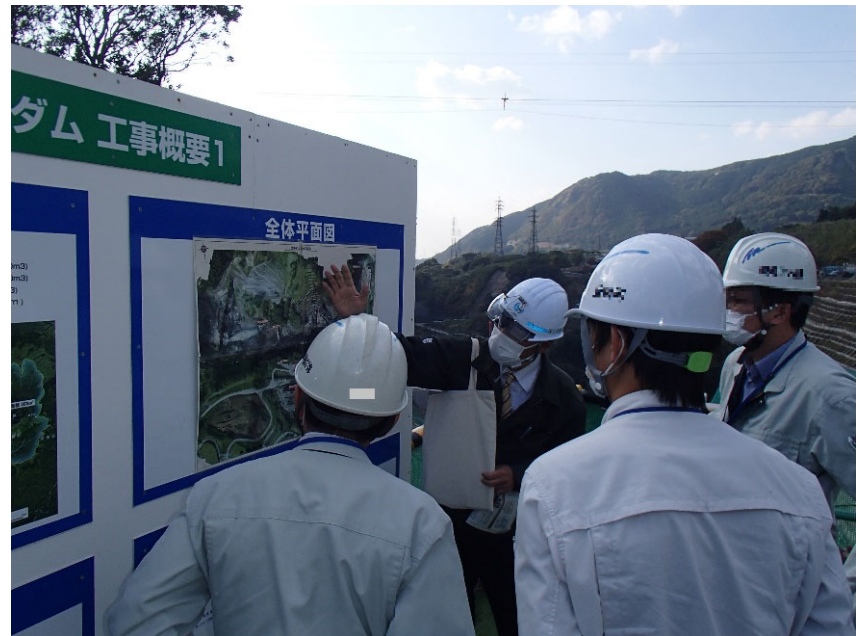
R3.11 菊陽町職員現地説明【4名】