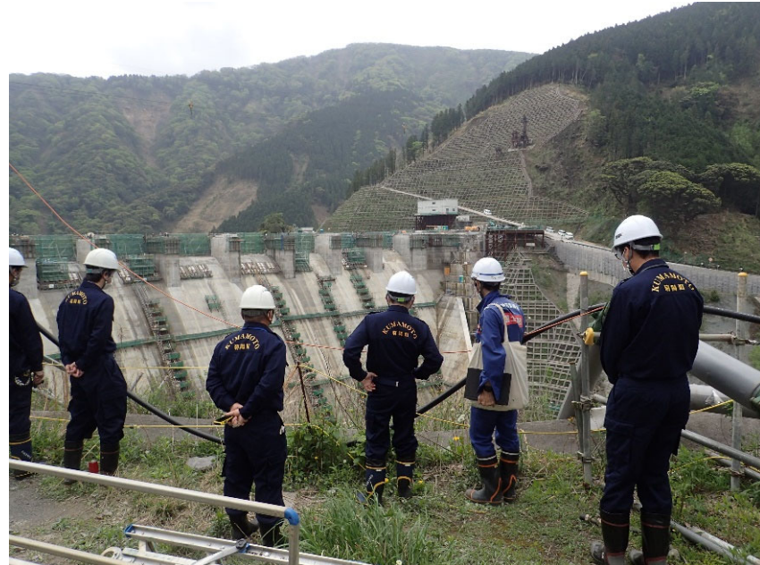
R5.4 菊陽町副町長・職員現地説明【7名】