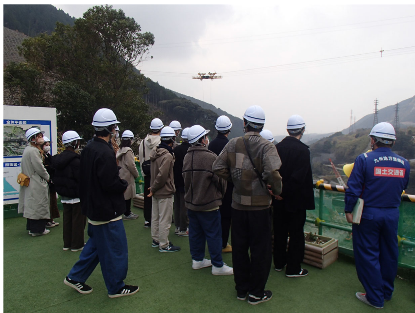
R3.12 大学生現地説明【34名】