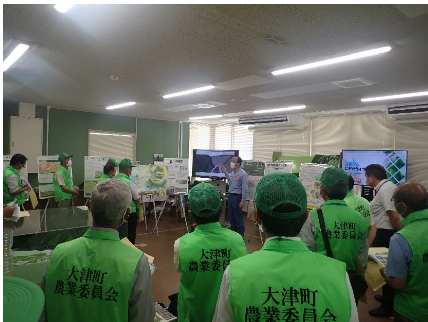
R4.7 大津町農業委員会現地説明【26名】