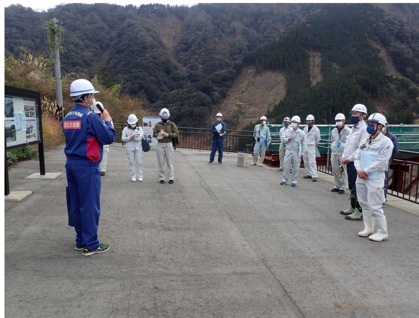
R3.12 熊本県測量設計コンサルタンツ協会現地説明【26名】