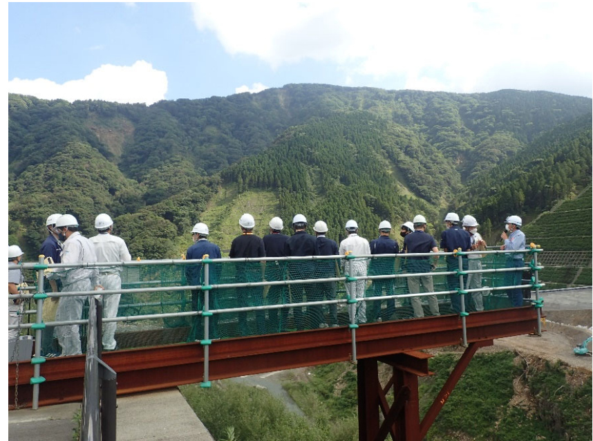
R4.7 熊本県職員現地説明【28名】