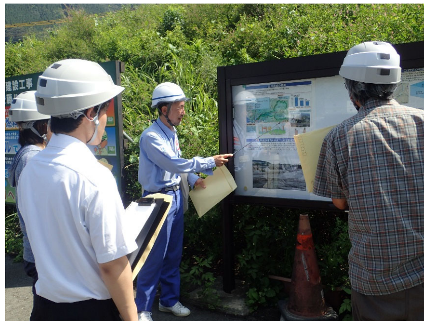
R5.7 南阿蘇村新任教員現地説明【5名】