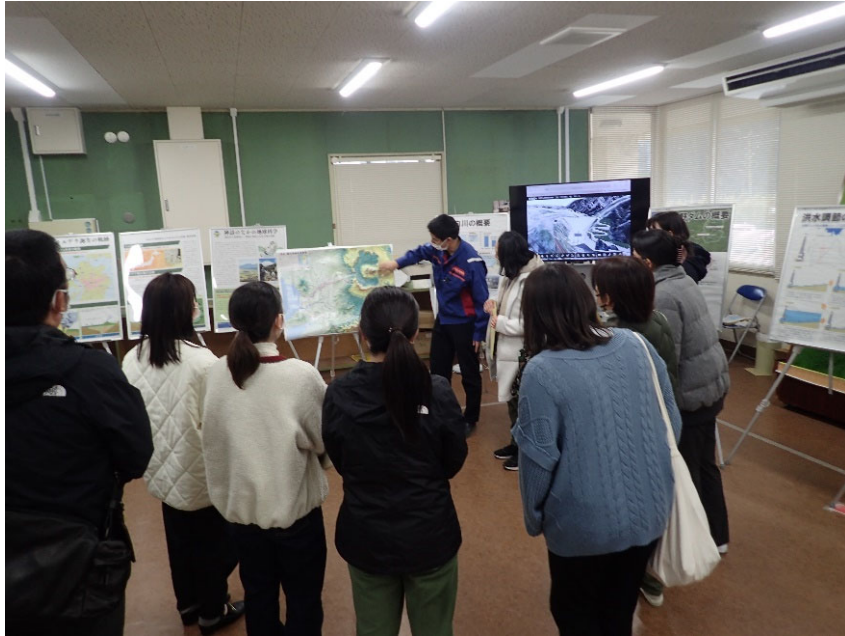
R5.2 一般住民現地説明【12名】