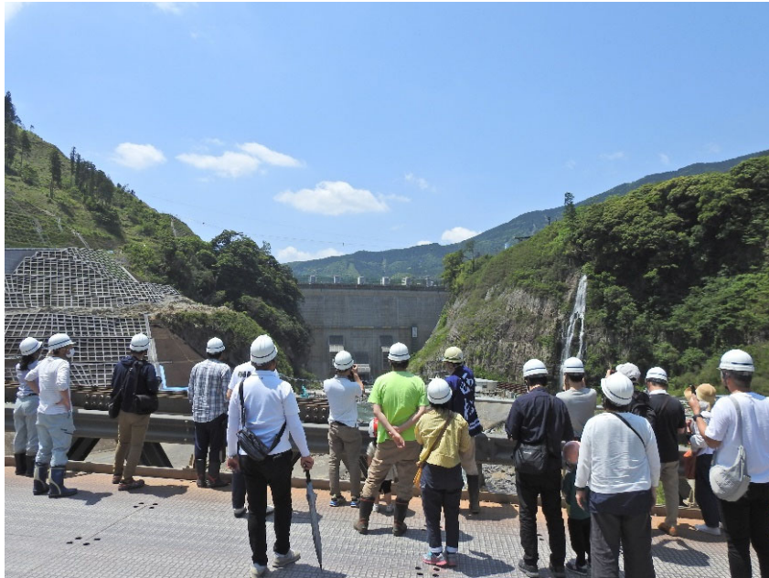
R5.5 立野ダム本体打設完了式見学会【110名】