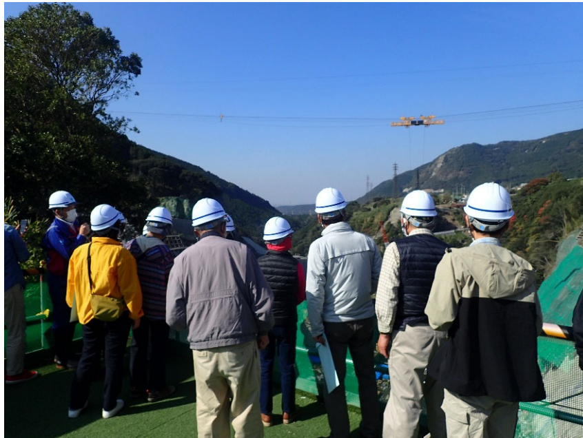
R3.11 一般住民現地説明【17名】