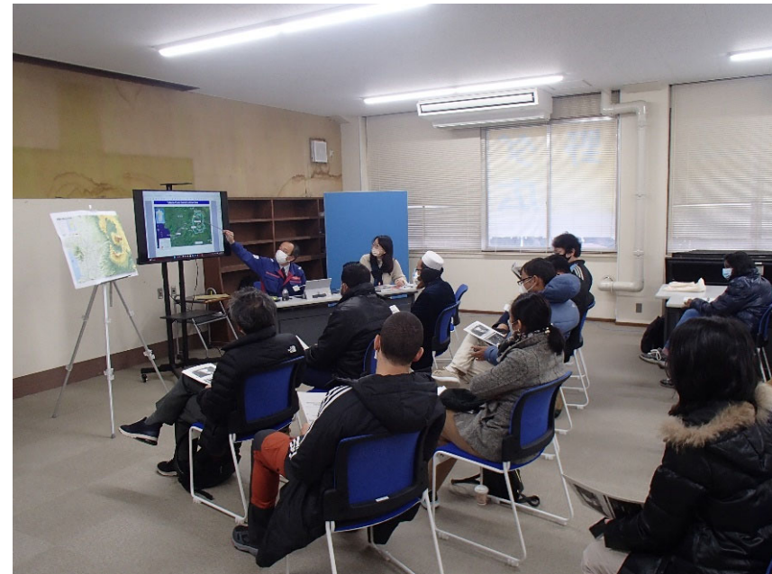
R5.2 JICA防災研修現地説明【11名】