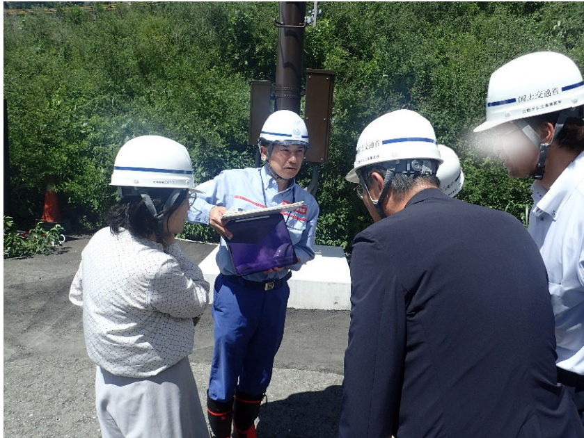
R5.7 熊本県職員現地説明【5名】