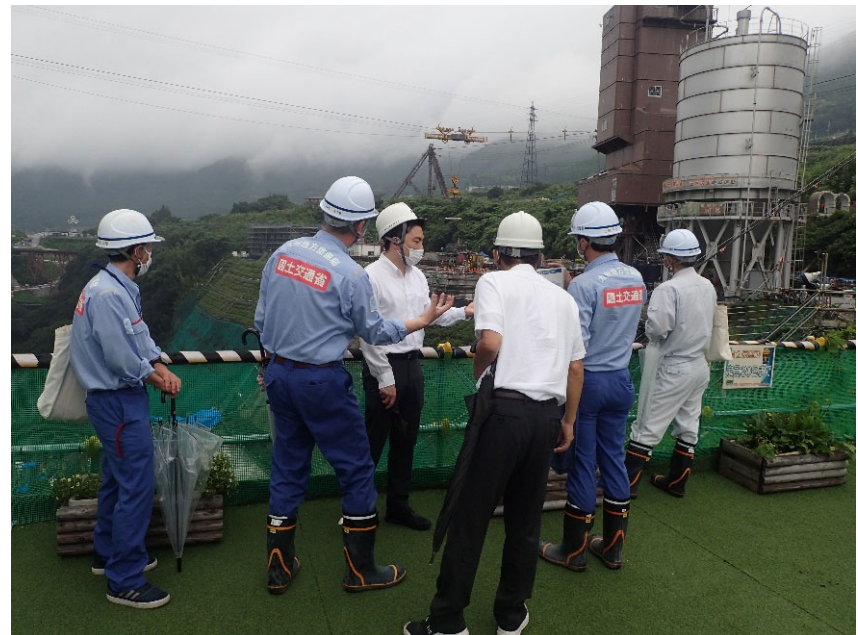
R4.7 熊本県職員現地説明【3名】