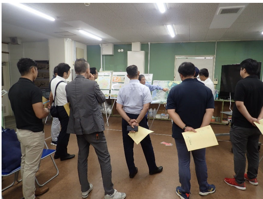
R5.7 熊本自民党市議団現地説明【20名】