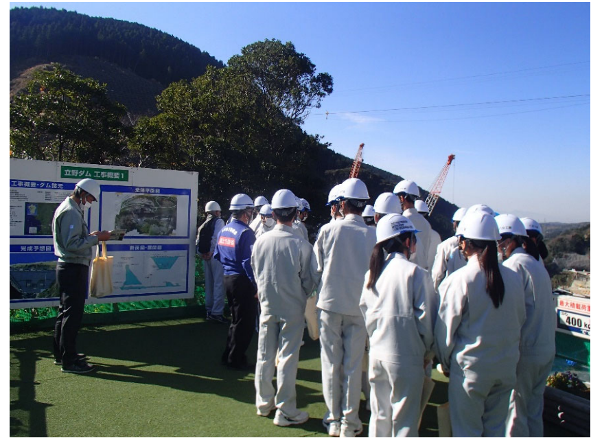
R4.12 高校生現地説明【43名】