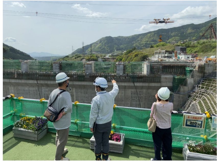
R5.4 絵本作家及び事務所職員現地説明【5名】