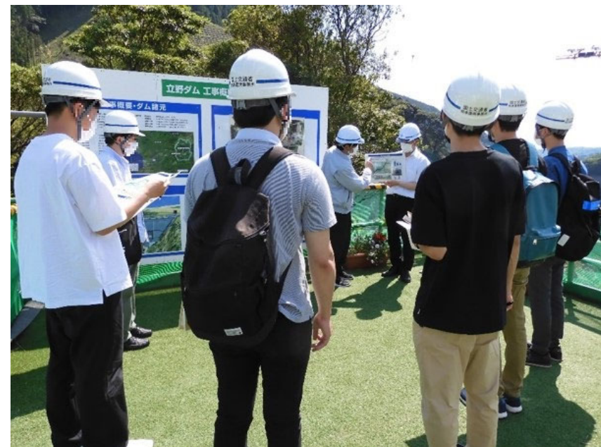
R3.6 大学生現地説明【7名】