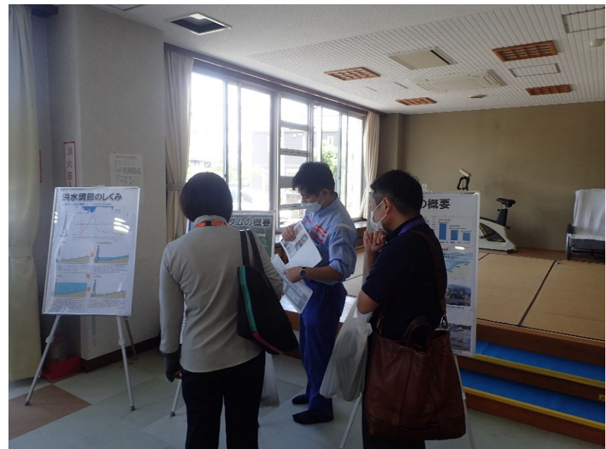
R4.8 熊本市日吉校区水防災体験学習【33名】