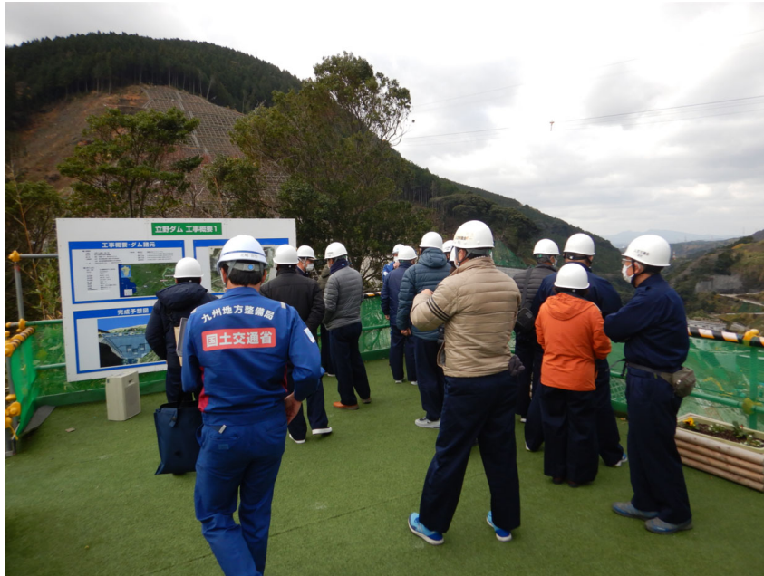
R3.12 流域外自治体議員等現地説明【35名】