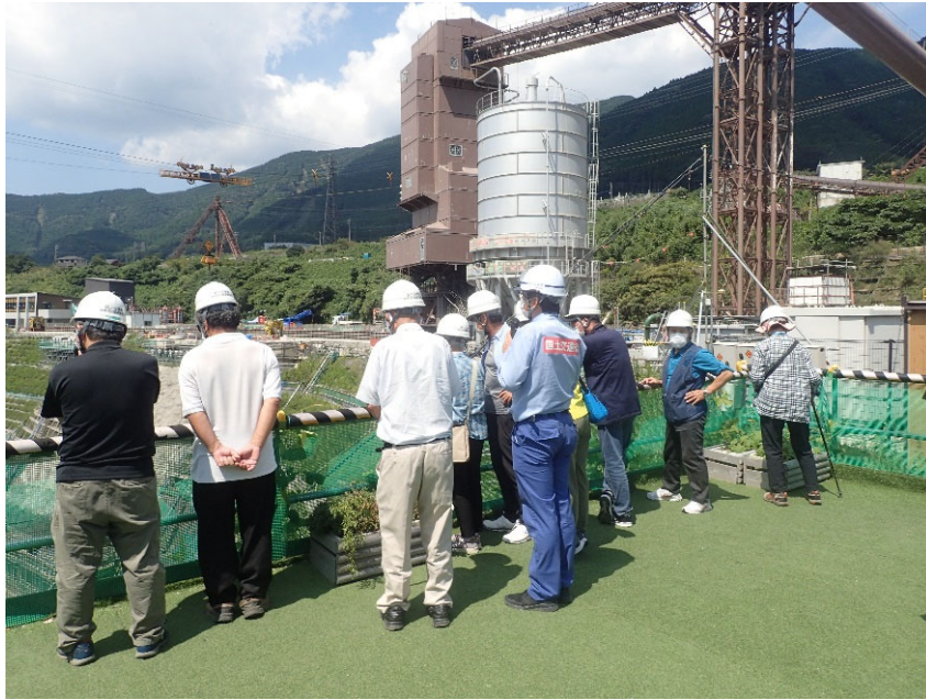
R4.9 一般住民現地説明【11名】