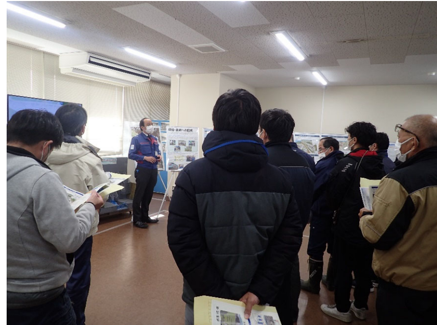
R4.12 熊本県職員現地説明【18名】