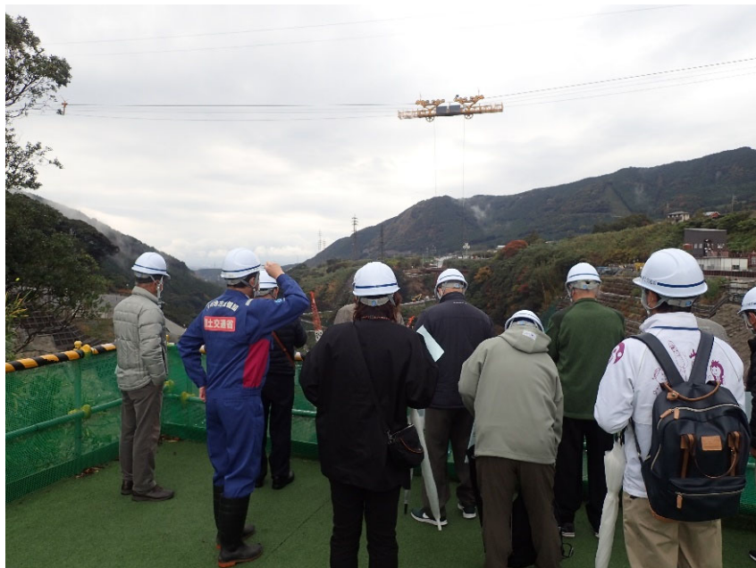
R3.11 一般住民現地説明【13名】