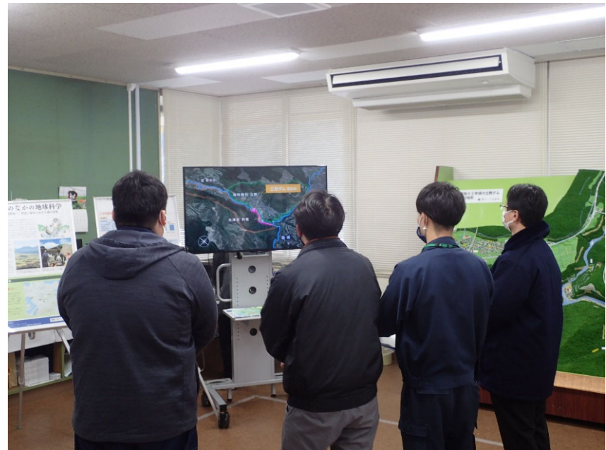
R4.3 西原村職員現地説明【4名】