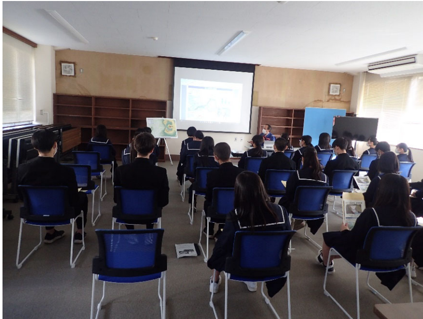
R4.10 高校生現地説明【32名】