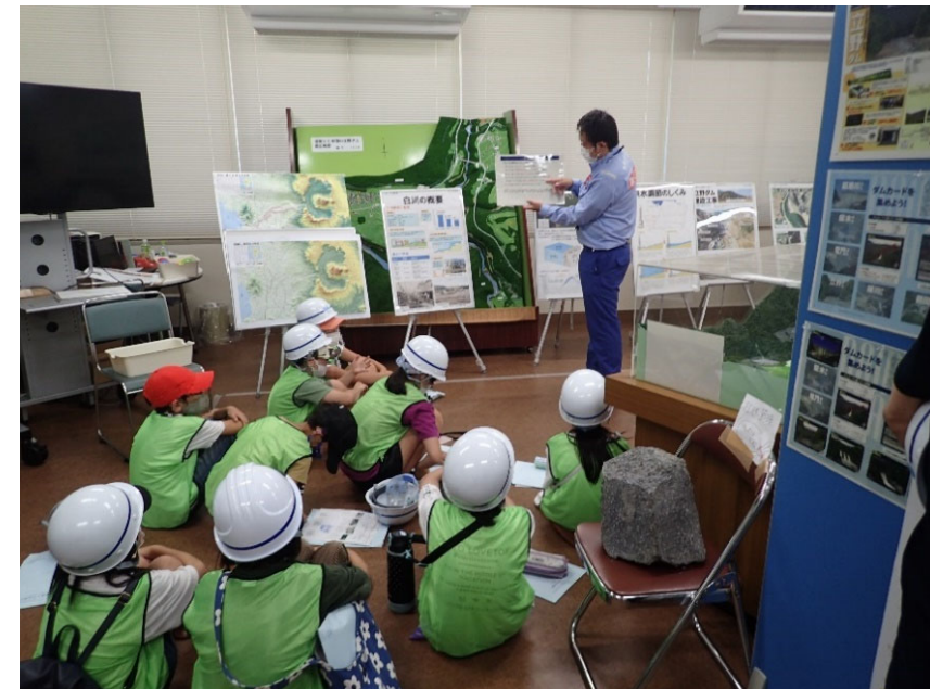
R3.8 一般住民現地説明【58名】