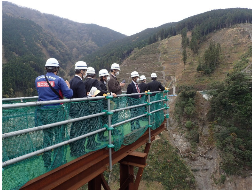
R4.11 一般住民現地説明【7名】