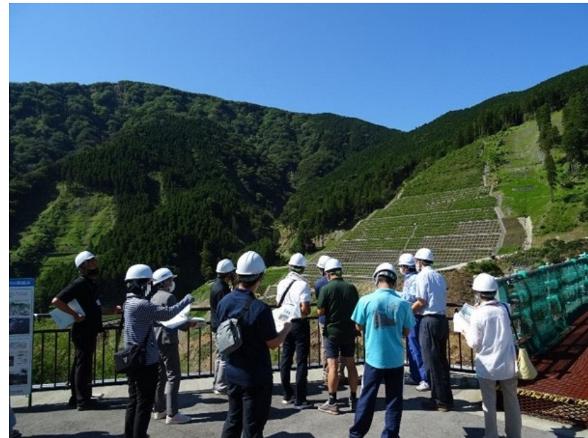
R3.7 南阿蘇村住民現地説明【15名】