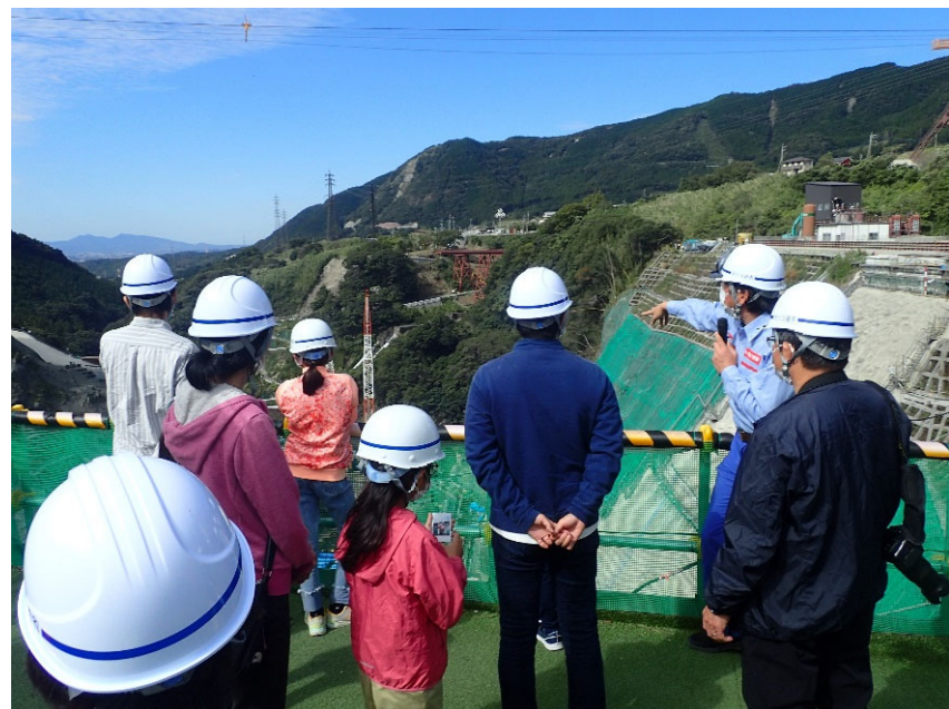
R3.10 一般住民現地説明【8名】