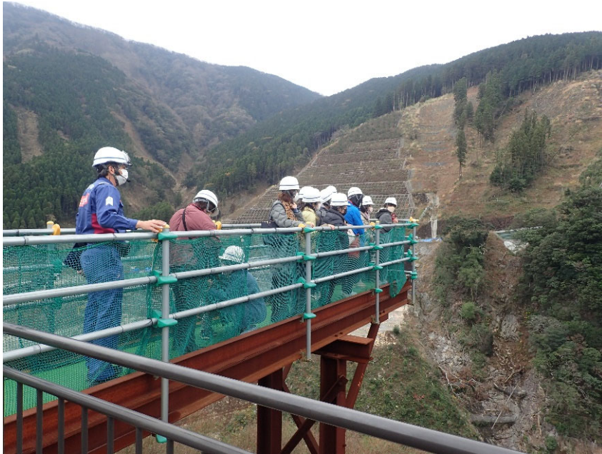
R4.12 大津町内牧地区住民現地説明【13名】