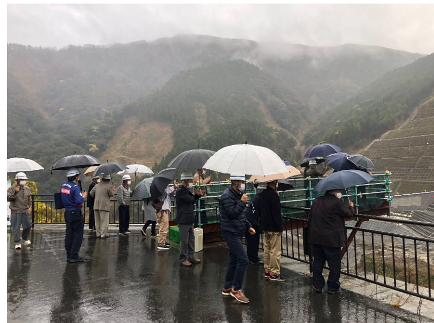
R4.11 熊本市住民現地説明【22名】