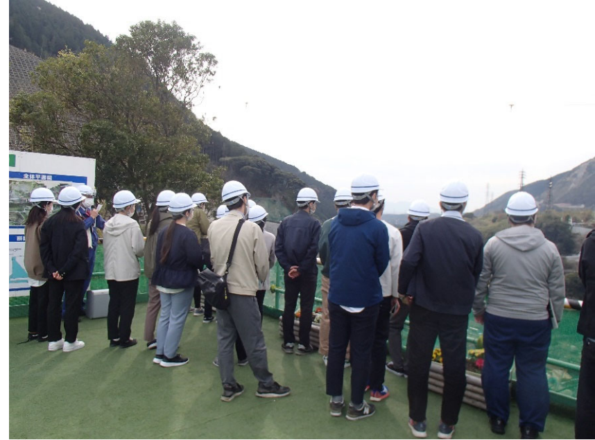
R4.4 熊本県職員現地説明【166名】