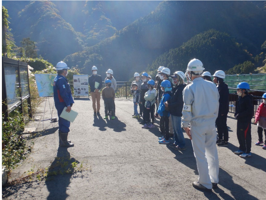
R4.11 土木の日バスツアー【64名】