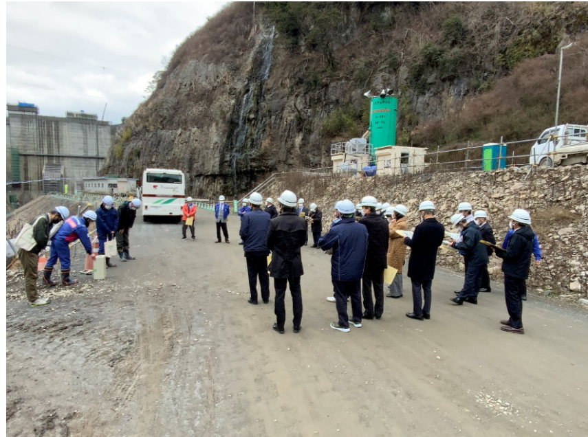
R5.2 大津町議会議員現地説明【32名】