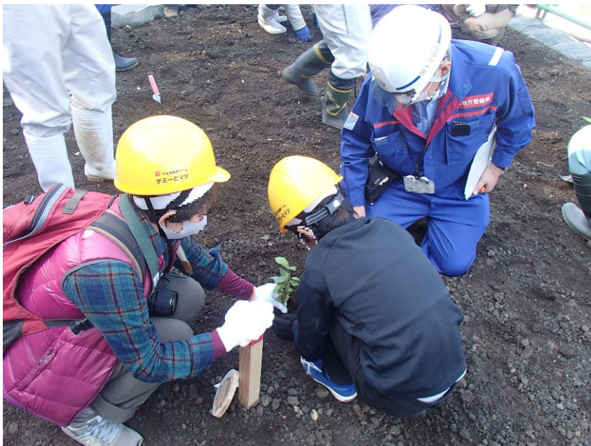
R3.11 デミーとマツの土木体験イベント【5名】