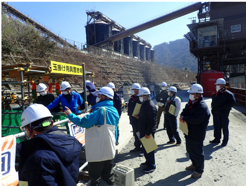
R4. 2 南阿蘇村議会議員等現地説明【11名】