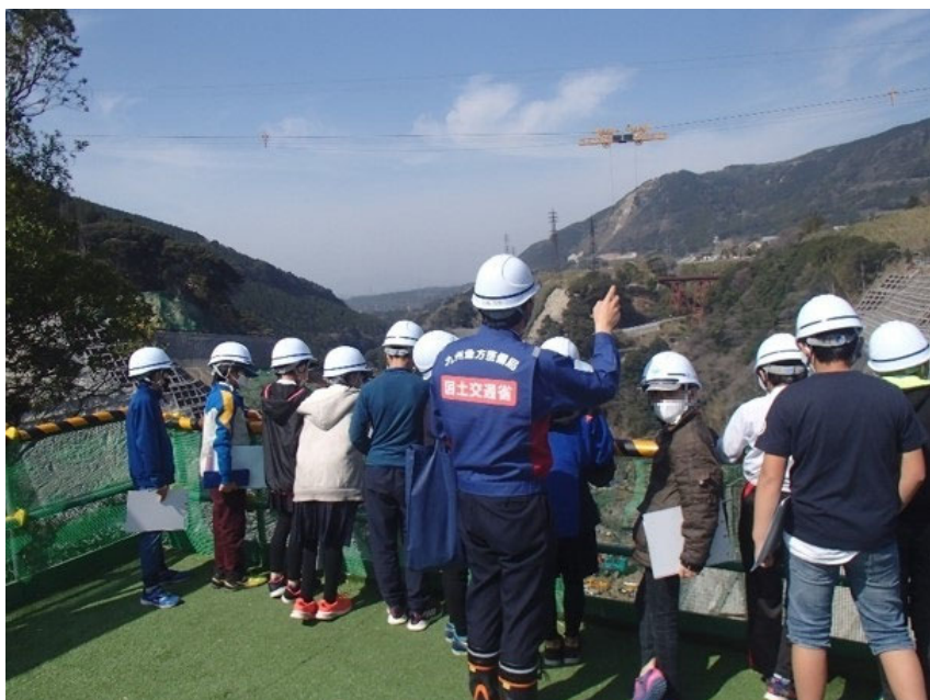
R3.3 小学生現地説明【10名】