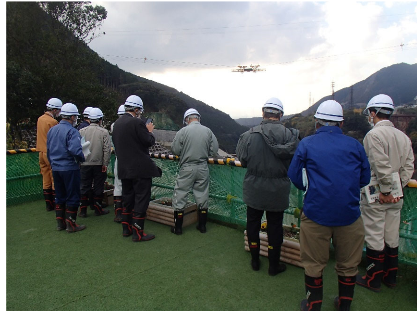
R3.11 一般住民現地説明【13名】