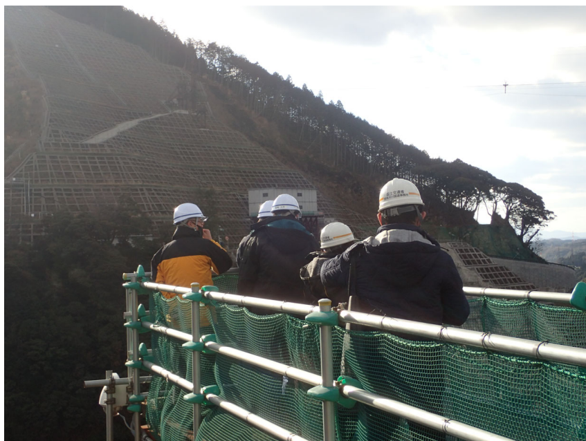
R3. 12 小学校教員現地説明【2名】