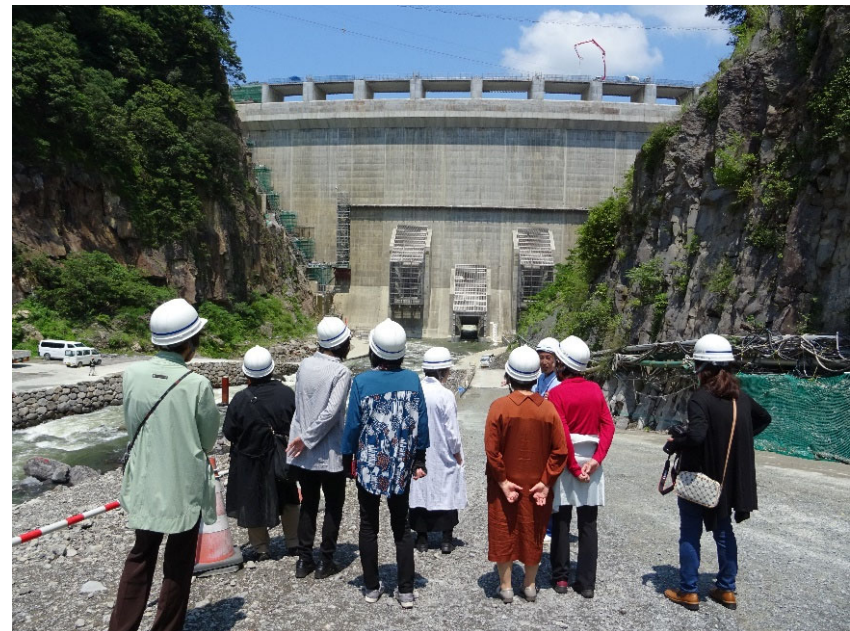
R5.6 一般住民現地説明【10名】