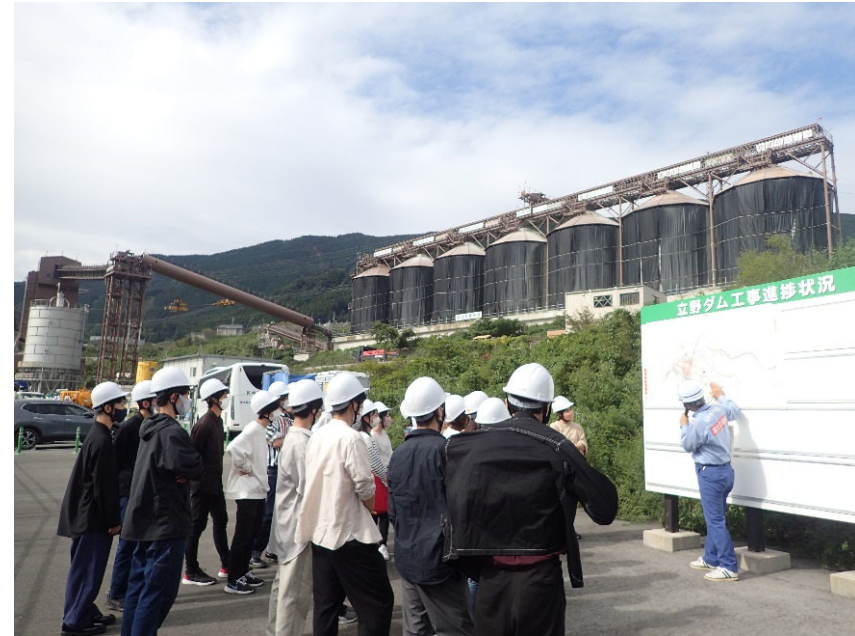
R4.9 大学生現地説明【49名】