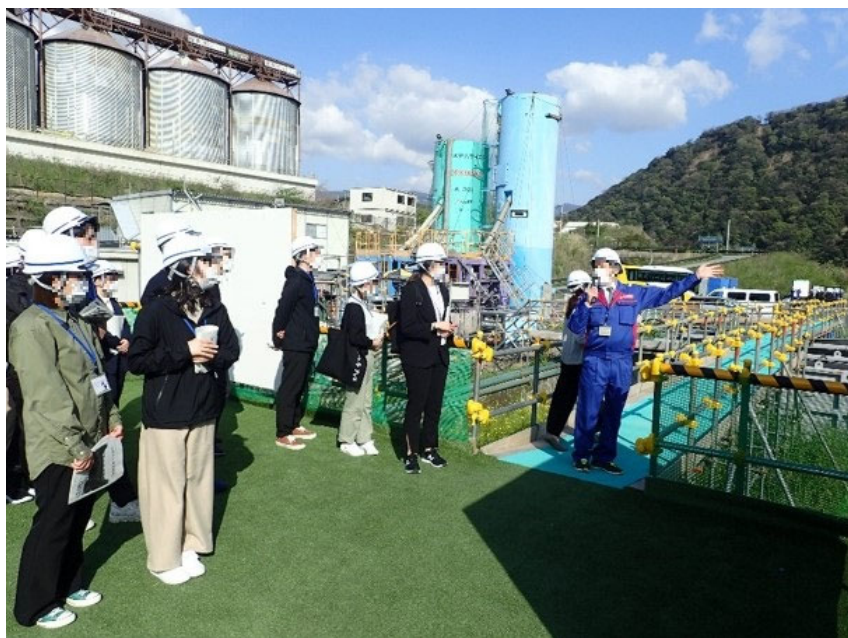
R3.4 熊本県職員現地説明【169名】