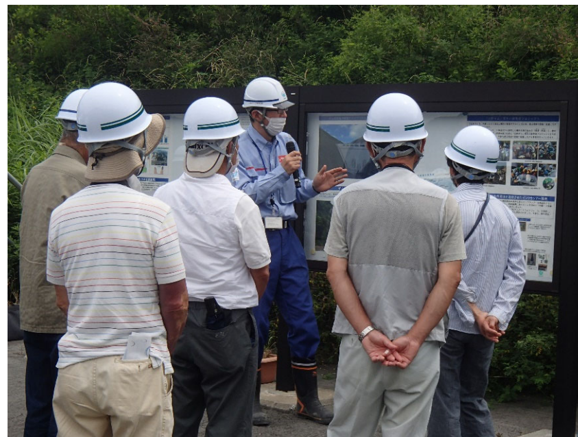
R4.6 南阿蘇村立野地区住民現地説明【95名】