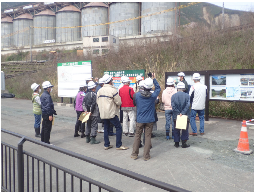
R5.3 阿蘇学会現地説明【23名】