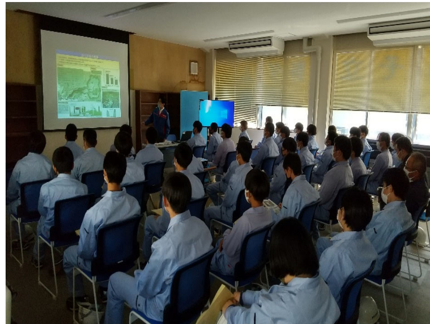
R4.10 高校生現地説明【40名】