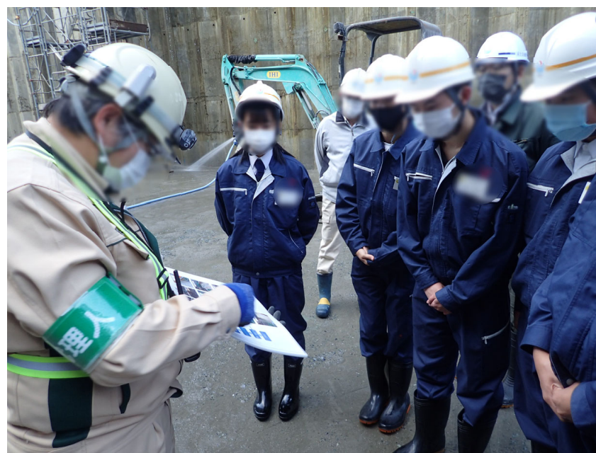
R3.12 高校生現地説明【6名】