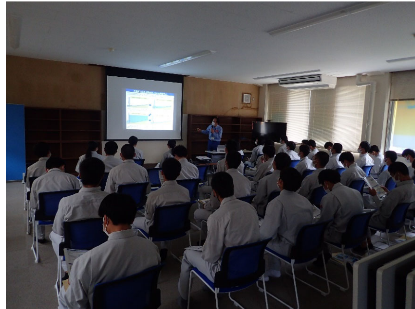
R4.5 高校生現地説明【42名】