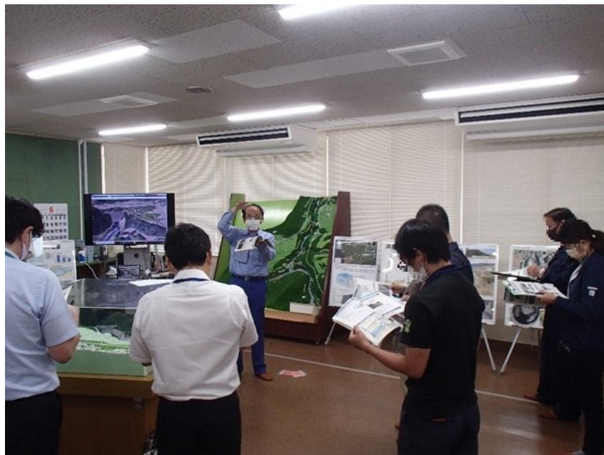
R3.6 行政機関現地説明【14名】