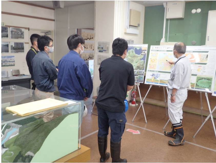
R4.8 阿蘇市議会議員・職員現地説明【16名】