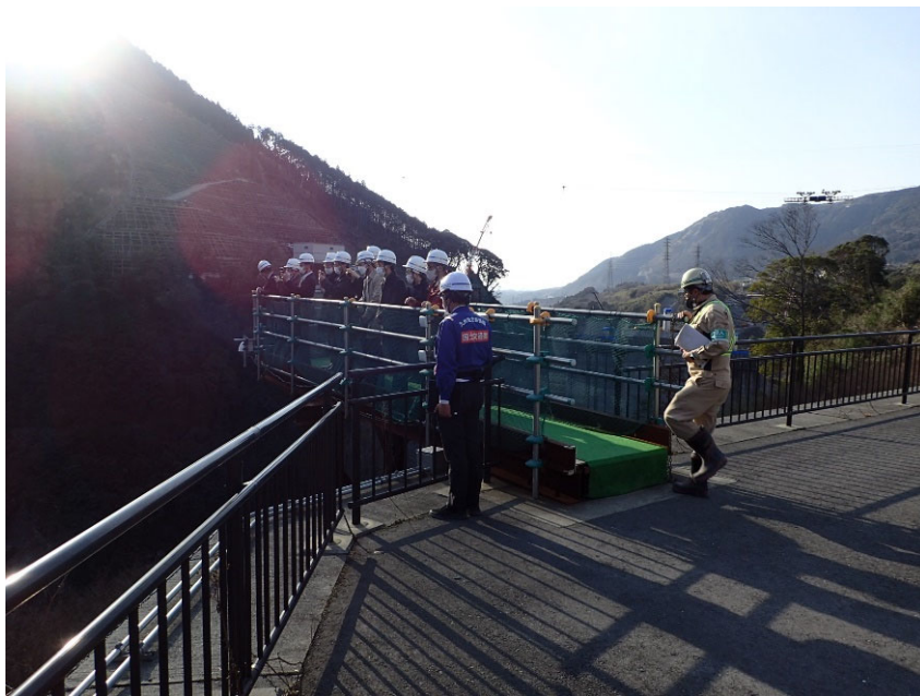
R5.2 日本建設業連合会災害対策部会現地説明【10名】