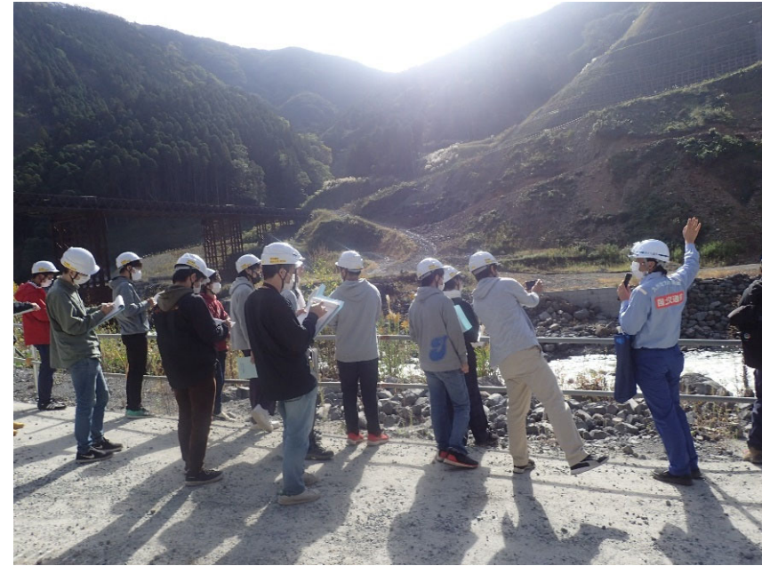
R3.10 大学関係者現地説明【18名】