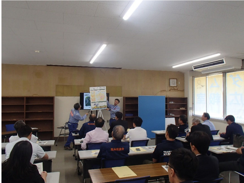
R5.6 自由民主党 熊本県議会議員団現地説明【30名】