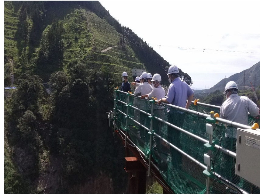
R4.9 大学生現地説明【3名】