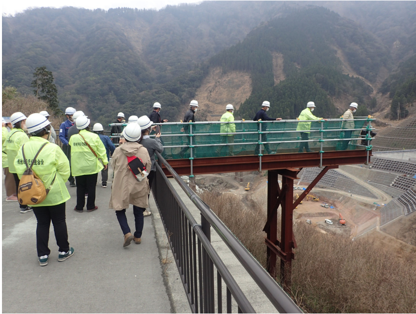
R5.3 菊池市民生委員連合会現地説明【17名】