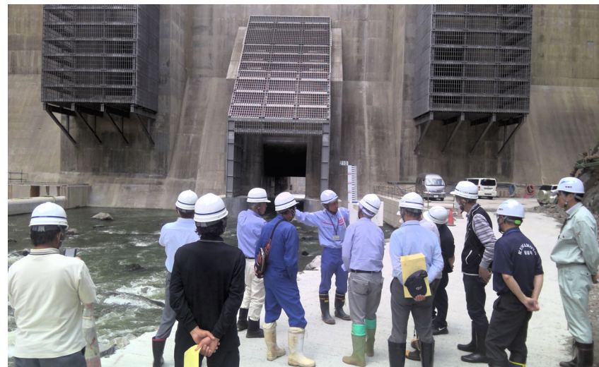
R5.5 菊陽町自治会長会現地説明【16名】