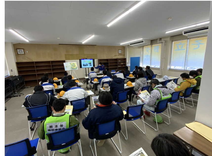
R5.3 高校生現地説明【23名】