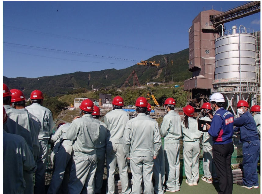
R4.10 高校生現地説明【24名】