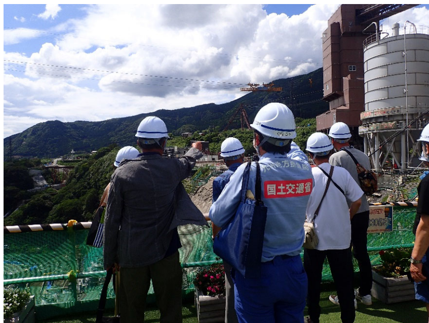
R4.6 熊本市住民現地説明【11名】