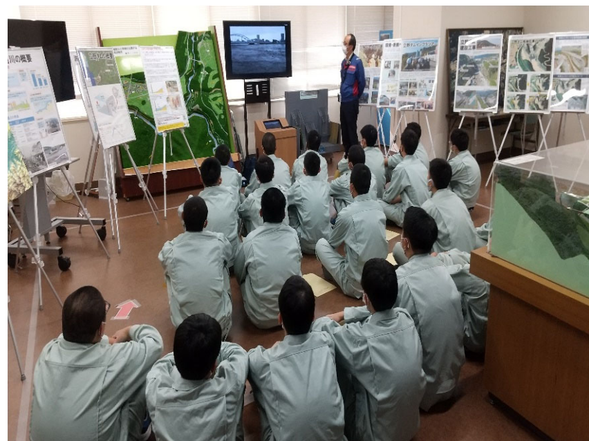
R4.11 高校生現地説明【165名】