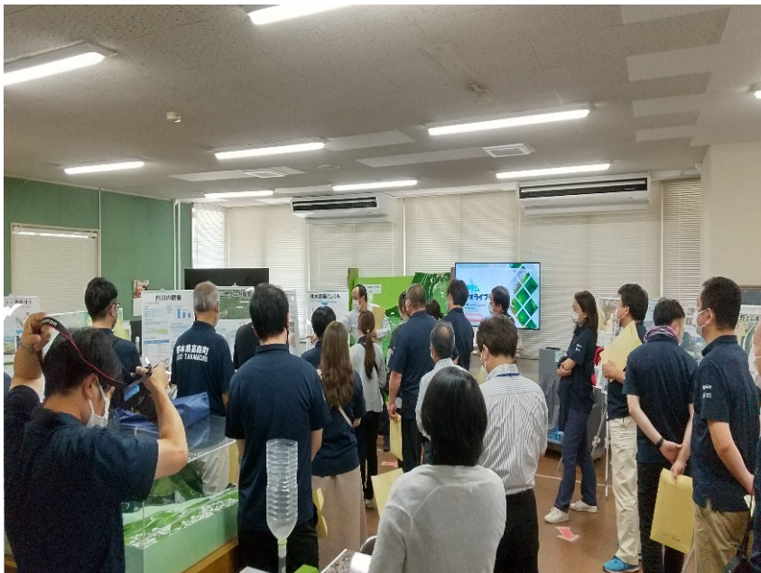
R4.8 高森町役場職員現地説明【70名】