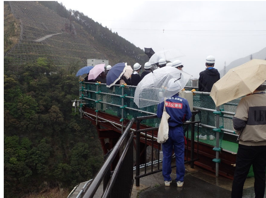
R5.4 熊本県職員現地説明【166名】