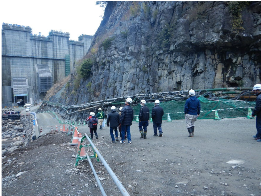
R5.1 立野地区住民 放流孔ウォークイベント 【61名】