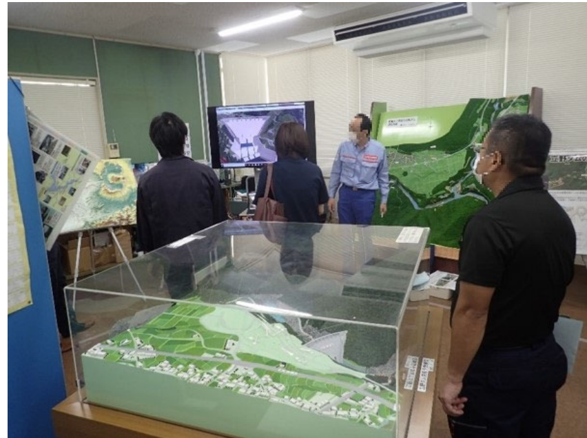
R3.7 行政機関現地説明【12名】