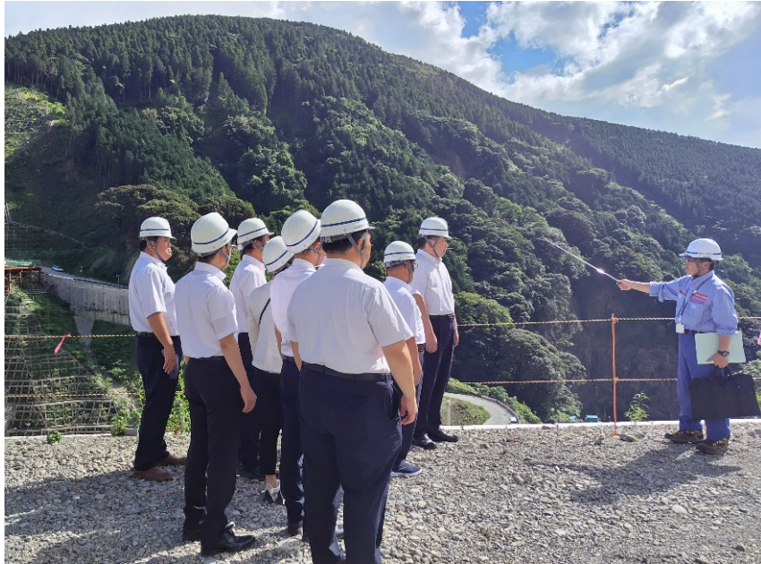
R5.8 熊本県議会議員、市議会議員【11名】