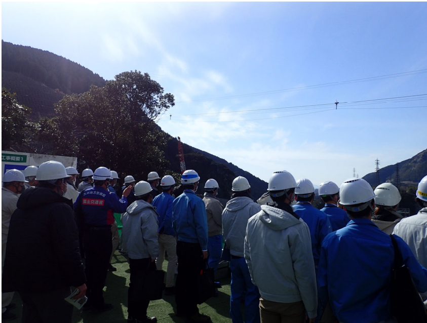
R5.3 熊本市震災対策課現地説明【30名】