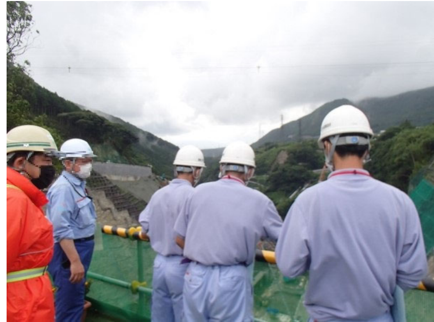
R3.7 高校生現地説明【5名】