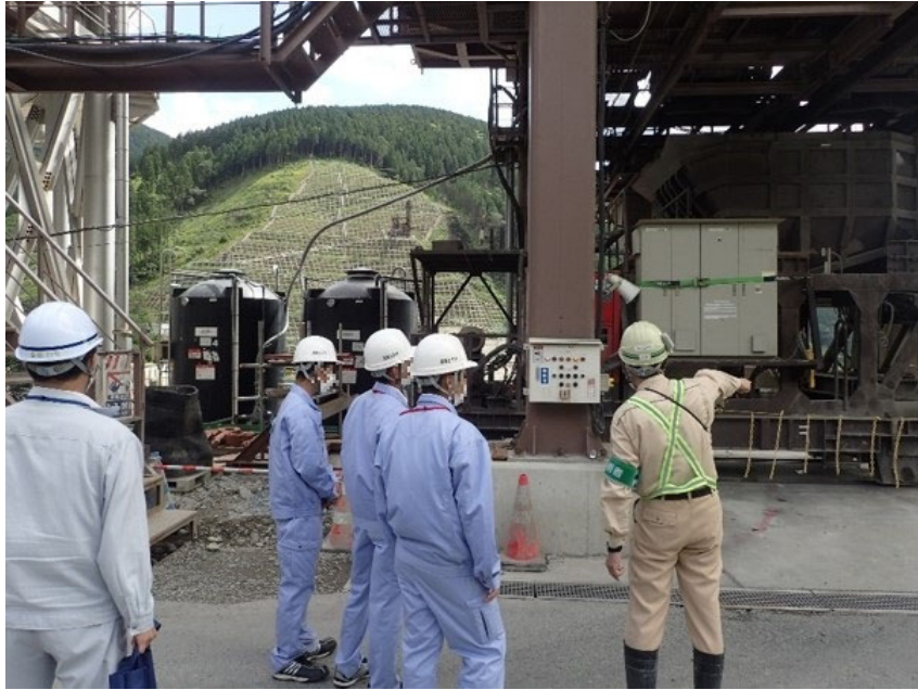
R3.7 高校生現地説明【3名】