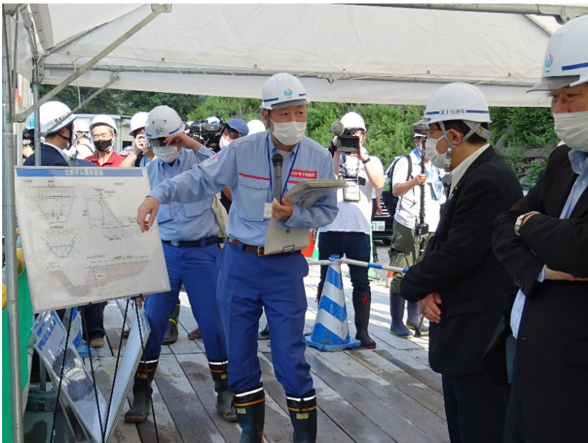
R4.7 総務大臣等現地説明【10名】