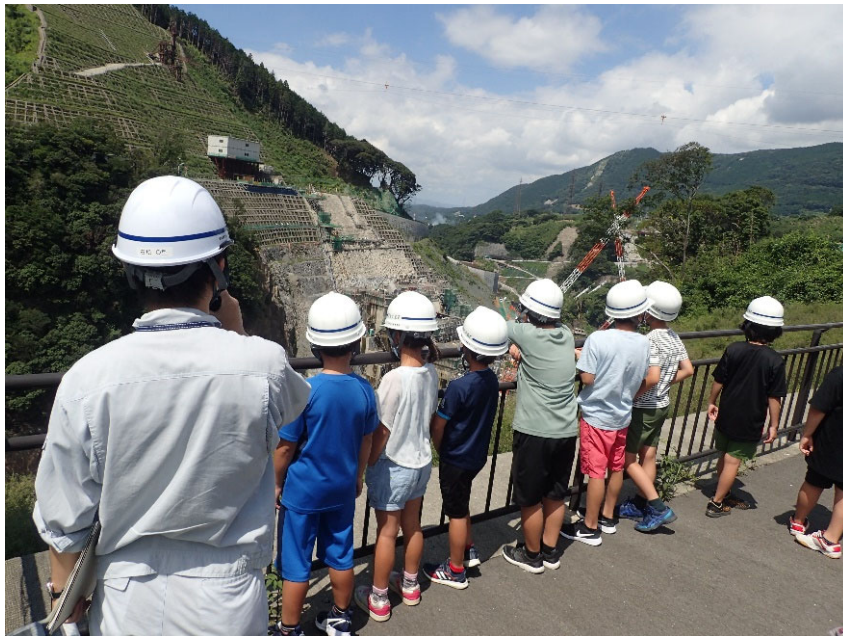
R4.8 一般住民現地説明【12名】