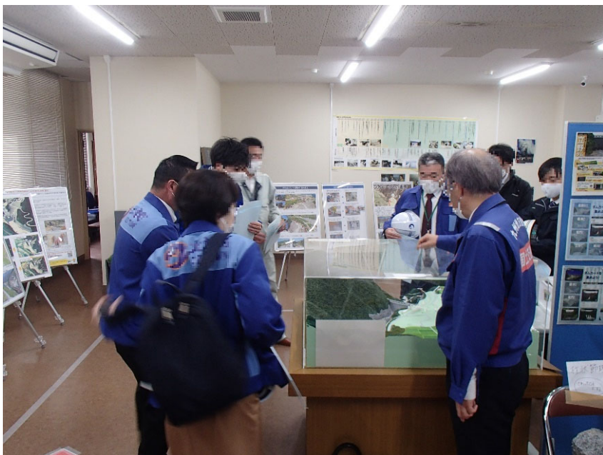
R3.11 大津町、菊陽町職員現地説明【8名】