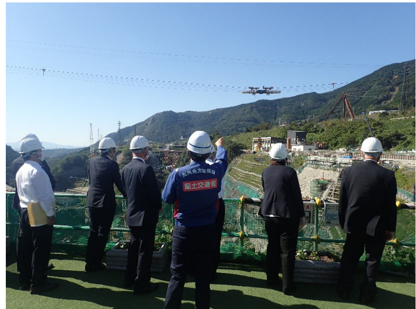
R4.10 流域外自治体議員等現地説明【13名】