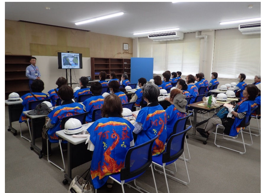
R5.8 一般市民現地説明【29名】