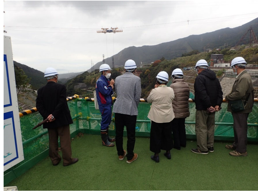
R3.11 行政機関現地説明【11名】