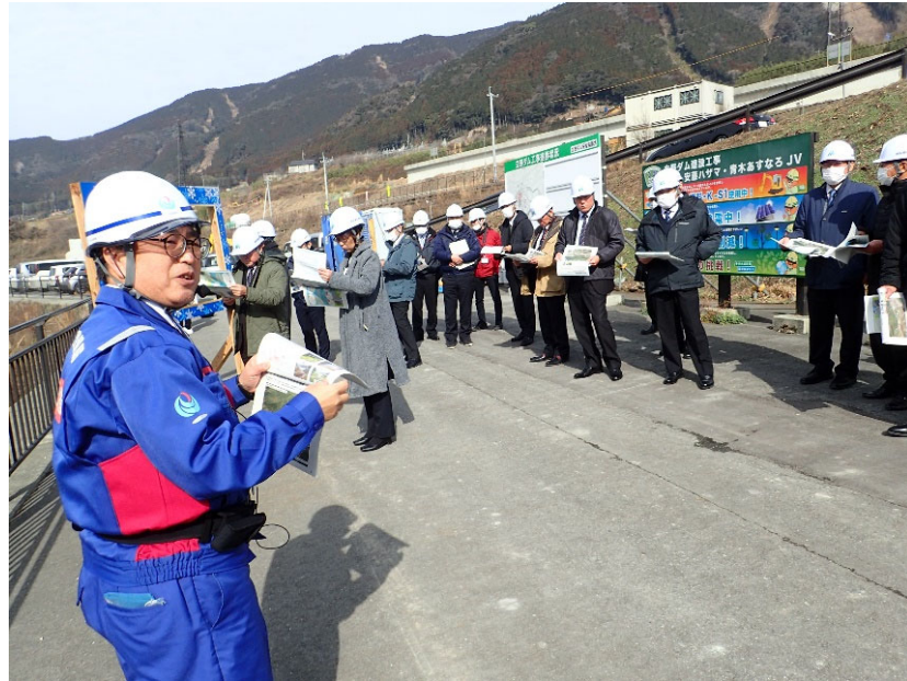
R6.1 南阿蘇村議会現地説明【20名】