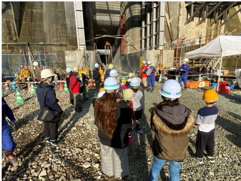
R5.1 立野地区子供会 放流孔お絵かきイベント 【22名】