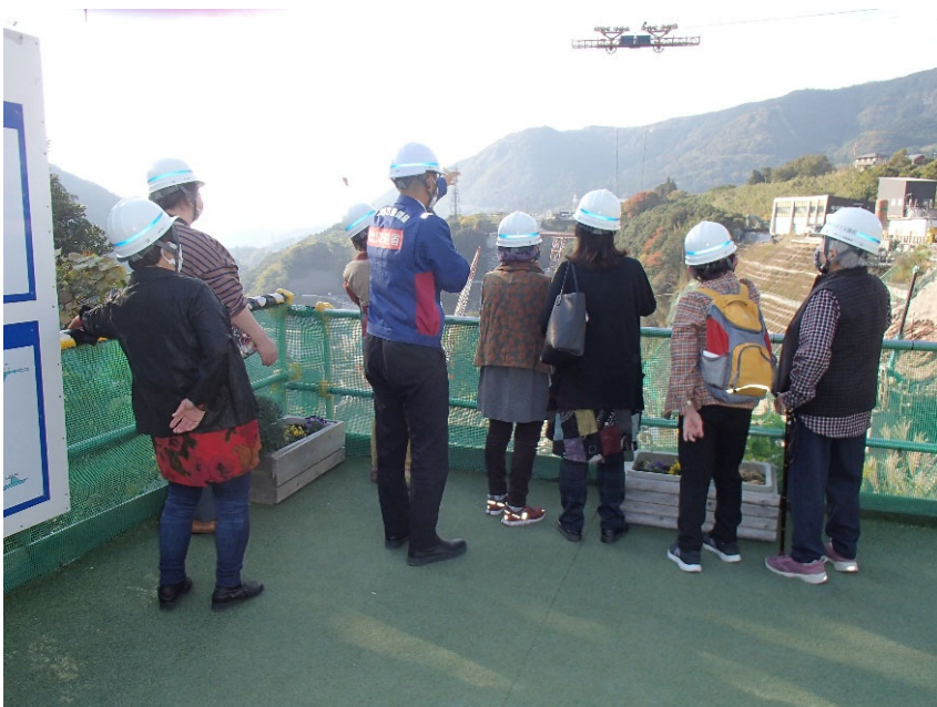
R4.11 熊本市住民現地説明【9名】