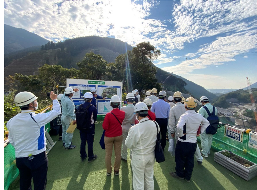
R4.11 日本応用地質学会現地視察【44名】