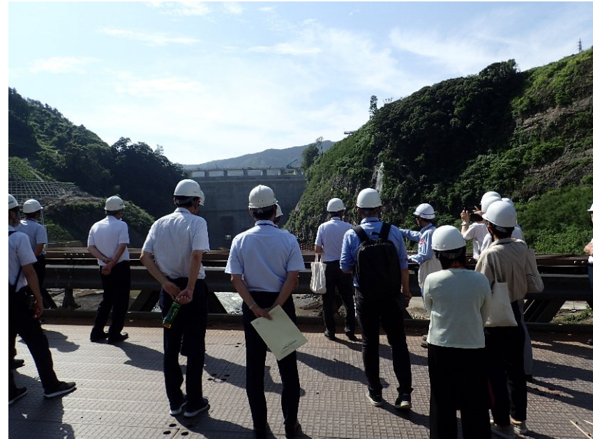
R5.7 熊本県職員現地説明【20名】