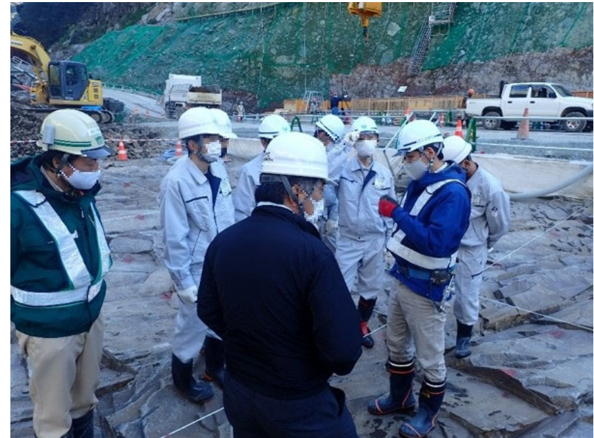
R2.12 高校生現地説明【6名】