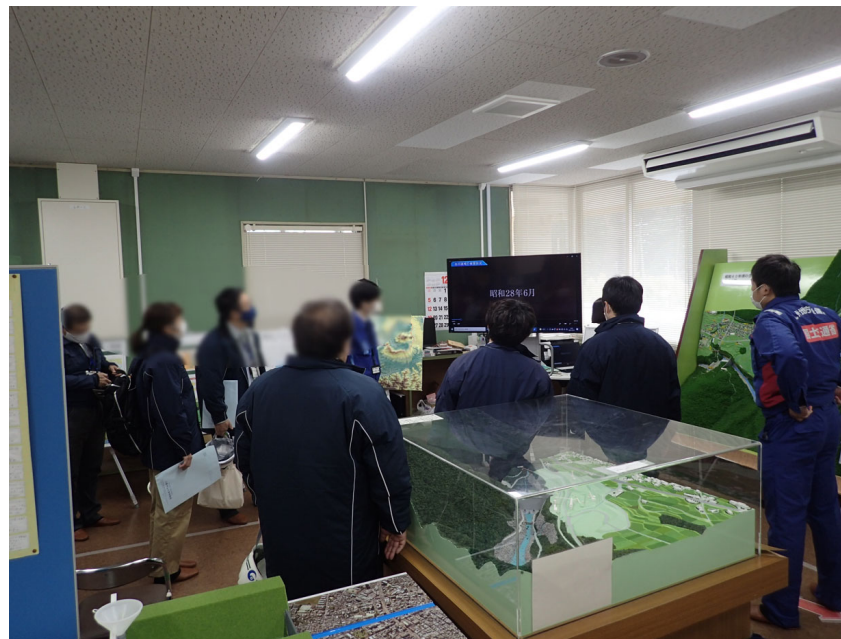
R3. 12 大津町職員現地説明【12名】