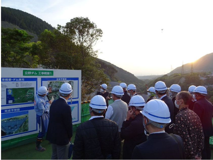
R4.4 インドネシア大臣等現地説明【30名】