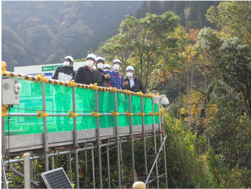
R3.11 大学関係者現地説明【6名】