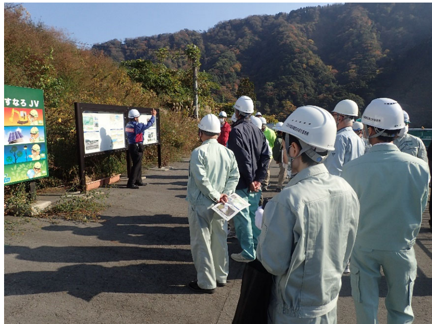
R4.11 行政機関現地説明【57名】