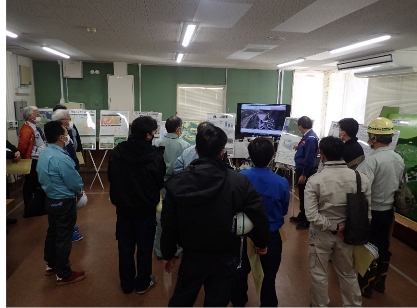
R4.11 熊本県土木施工管理技士会現地説明【16名】