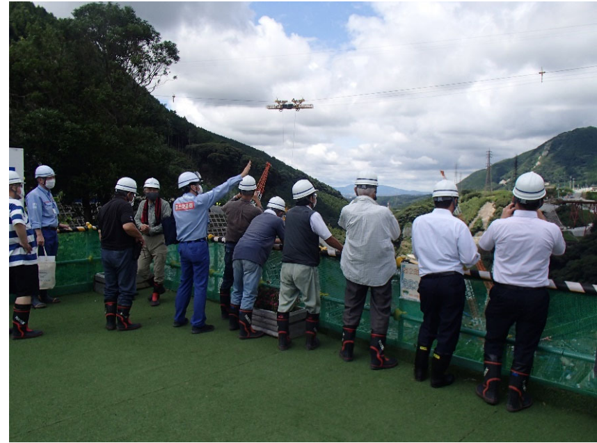
R4.8 環境文化部会現地説明【12名】