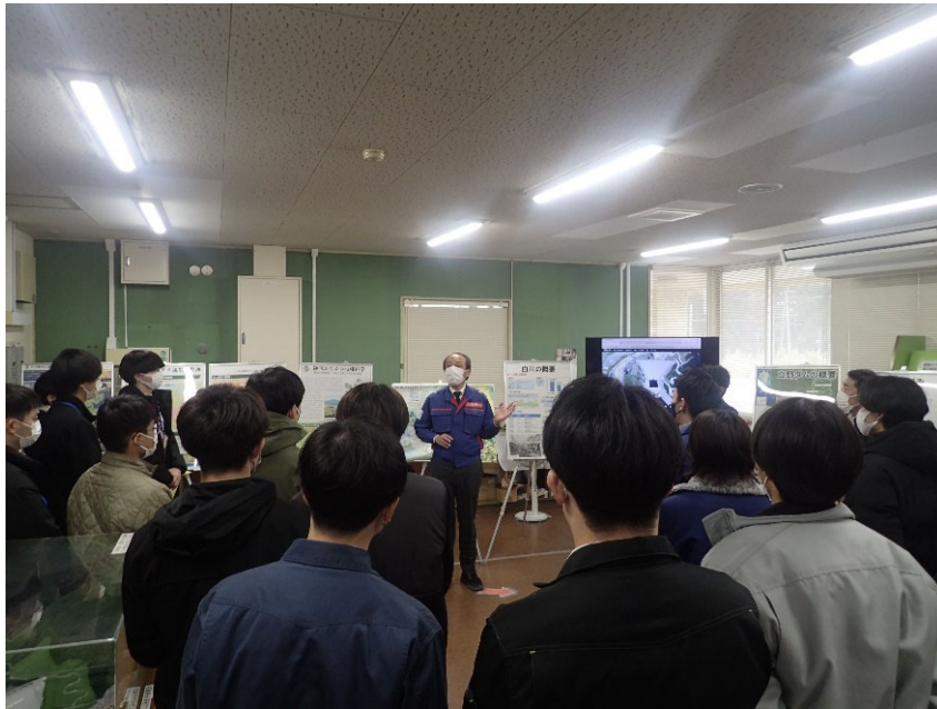
R5.2 熊本県職員現地説明【31名】