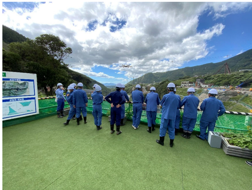
R4.9 南阿蘇村議会議員現地説明【19名】