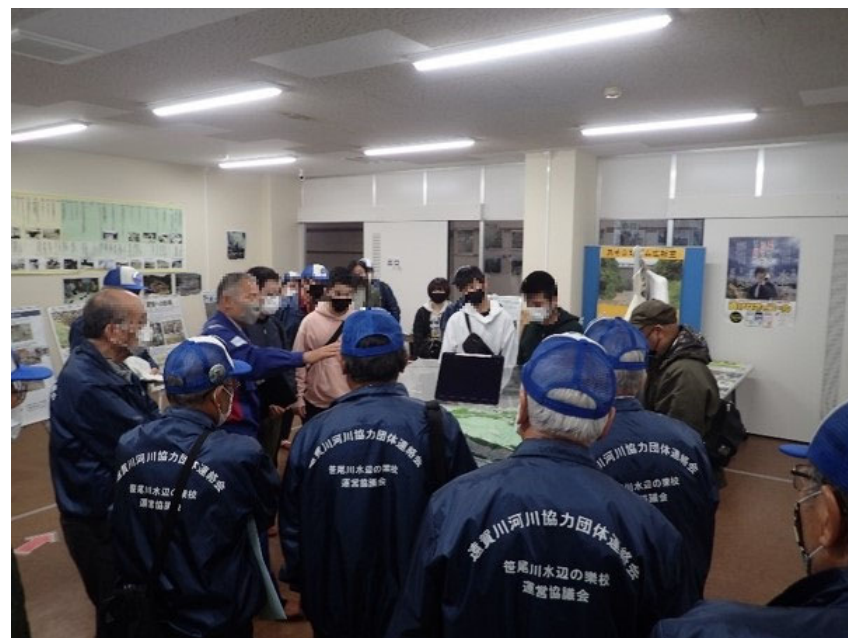
R3.3 流域外自治体住民現地説明【8名】