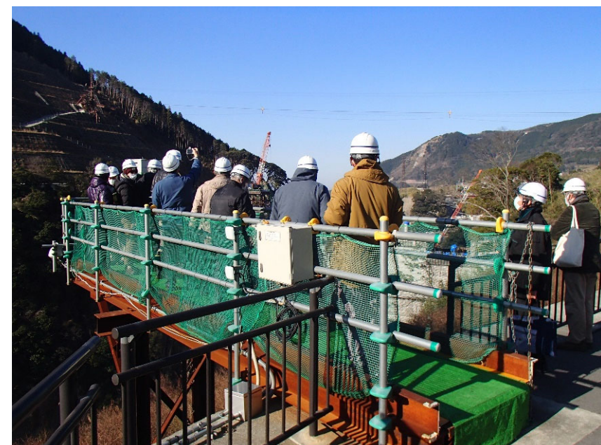
R4.12 日本地学教育学会現地説明 【12名】