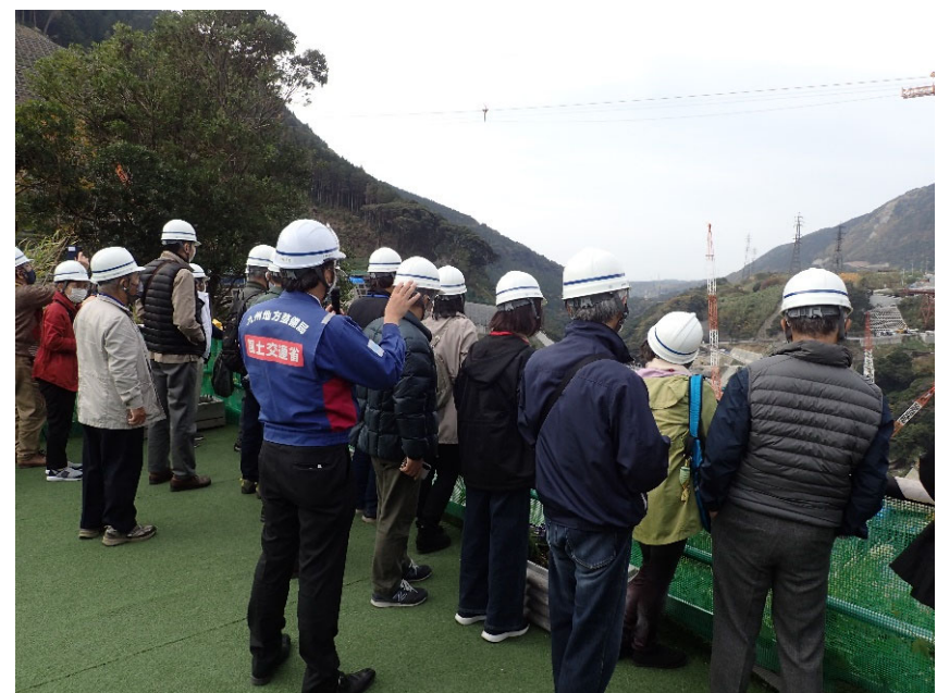
R4.11 熊本市住民現地説明【21名】