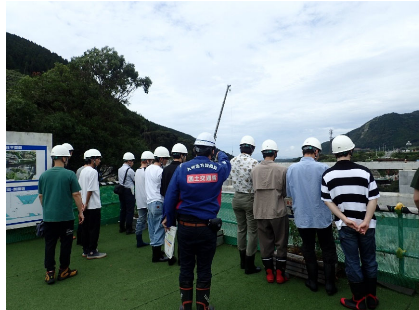
R5.9 大学生現地説明【70名】