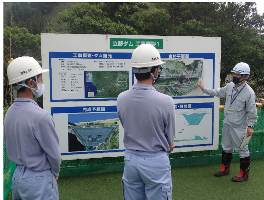
R4.7 高校生現地見学【2名】