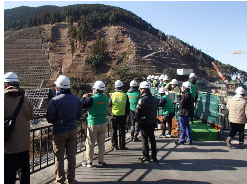
R5.1 菊陽町防災士現地説明【24名】