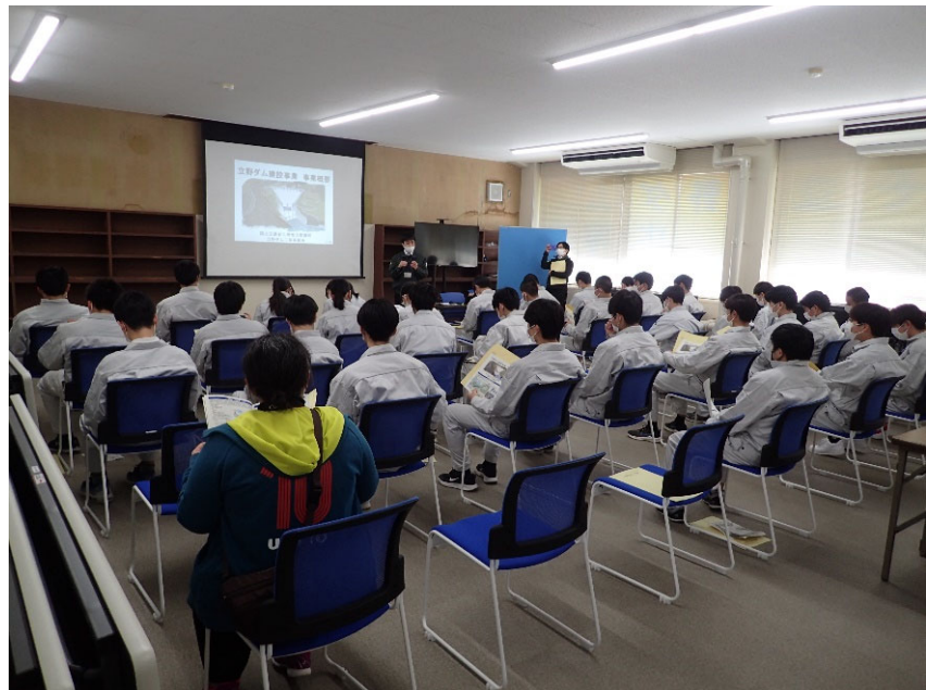
R5.2 高校生現地説明【38名】