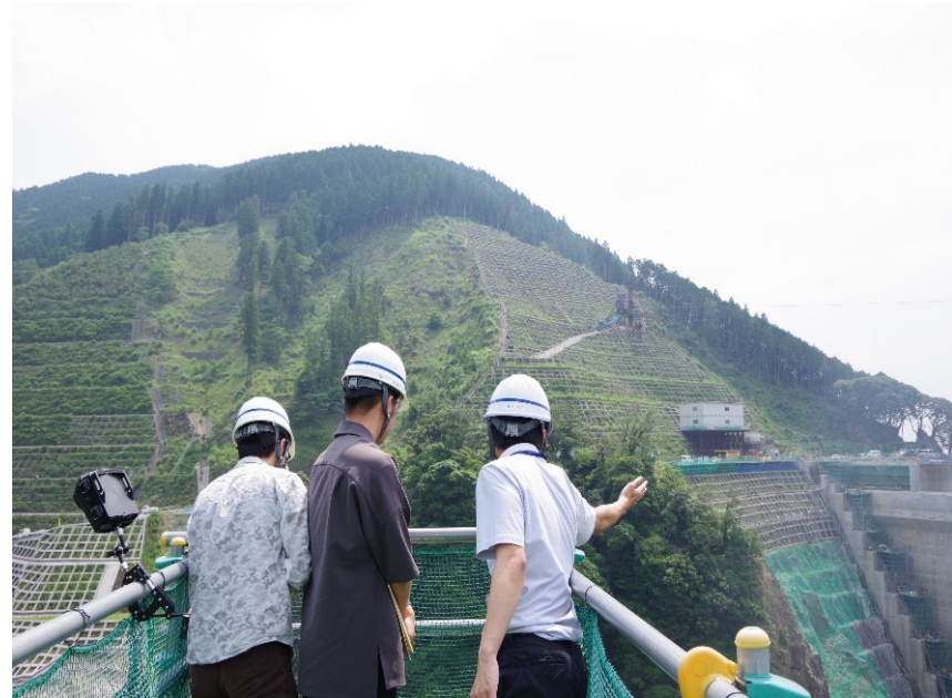
R5.6 大学生現地説明【2名】