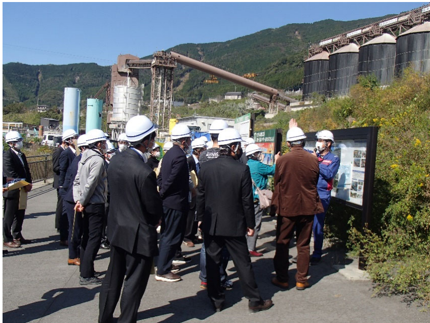
R4.10 九州圏内道路関係者現地説明【78名】