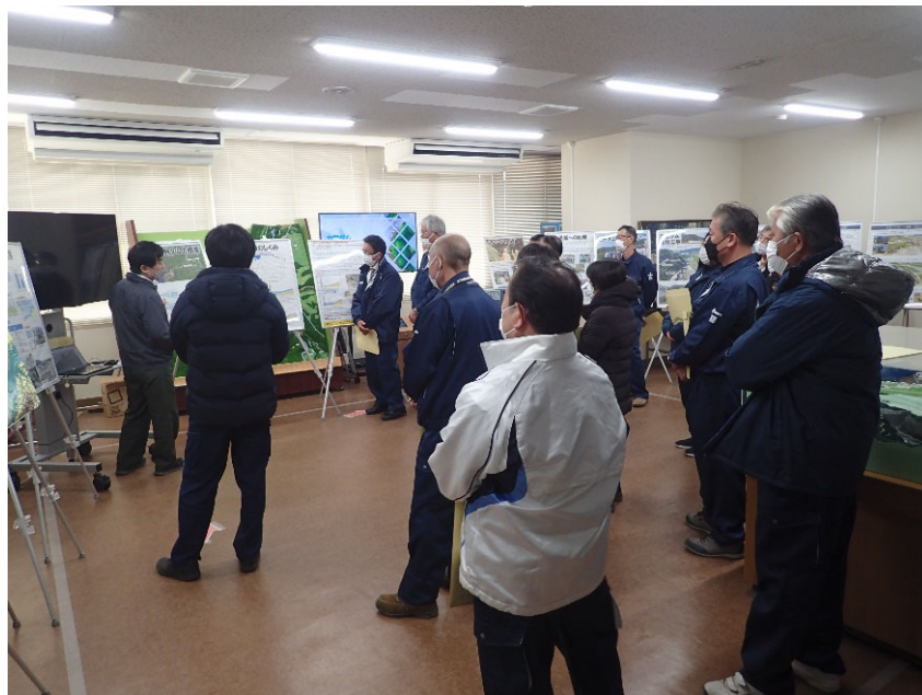
R5.2 南阿蘇村農業委員会現地説明【24名】