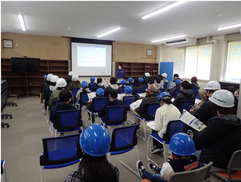
R5.3 大規模工事現場親子見学会【39名】