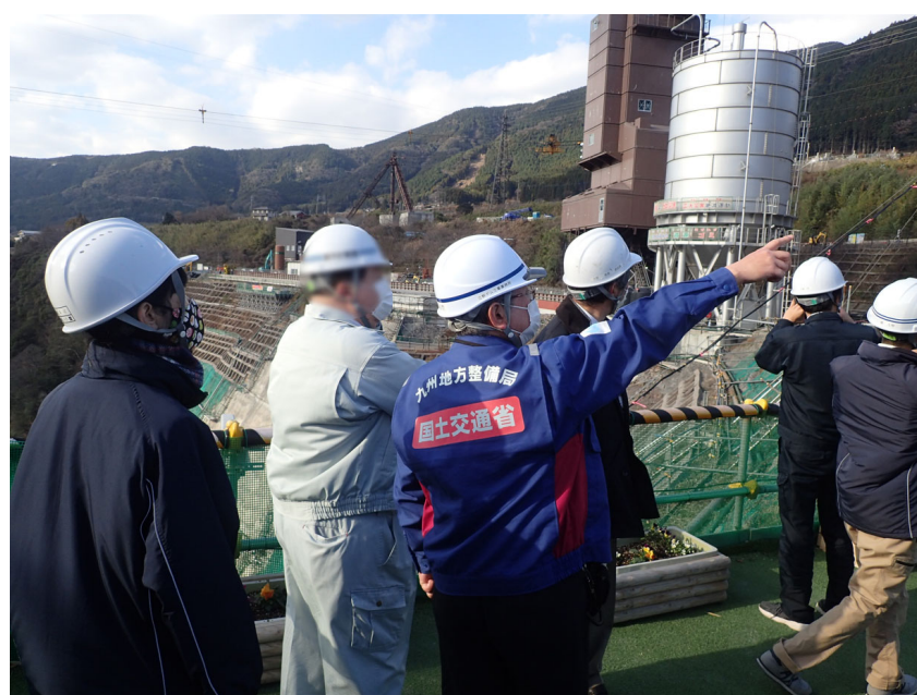
R3. 12 大津町職員現地説明【5名】