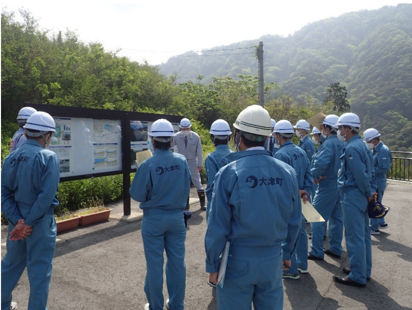
R4.4 大津町長、議会議員等現地説明【31名】