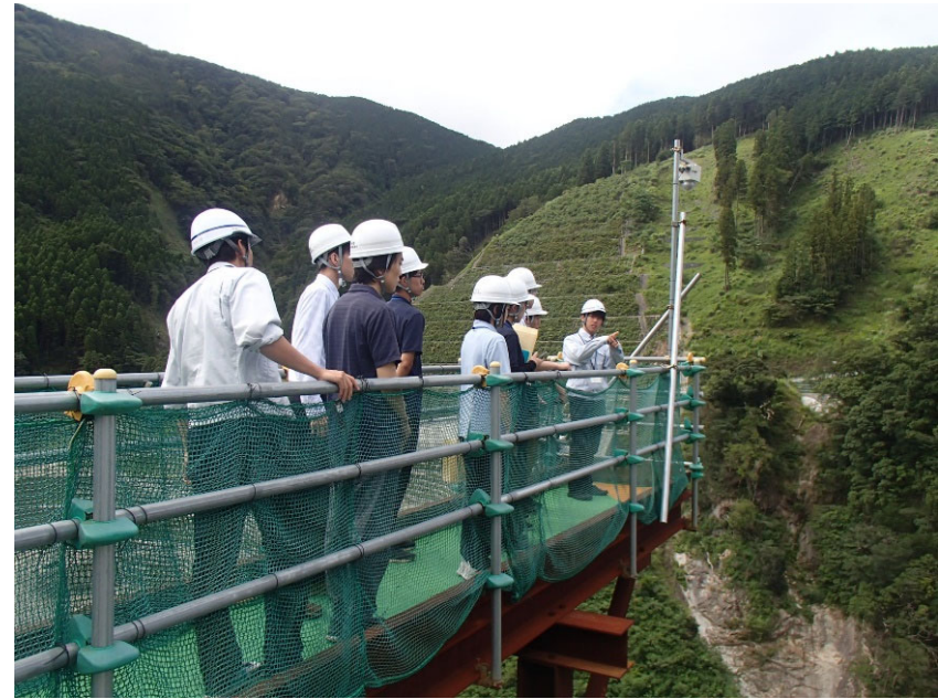
R5.8 大学生現場説明【7名】