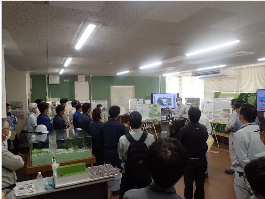
R4.9 熊本県コンクリート診断士会現地説明【35名】