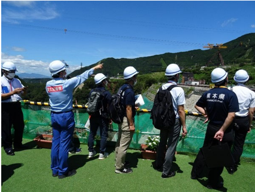
R3.8 行政機関現地視察【35名】