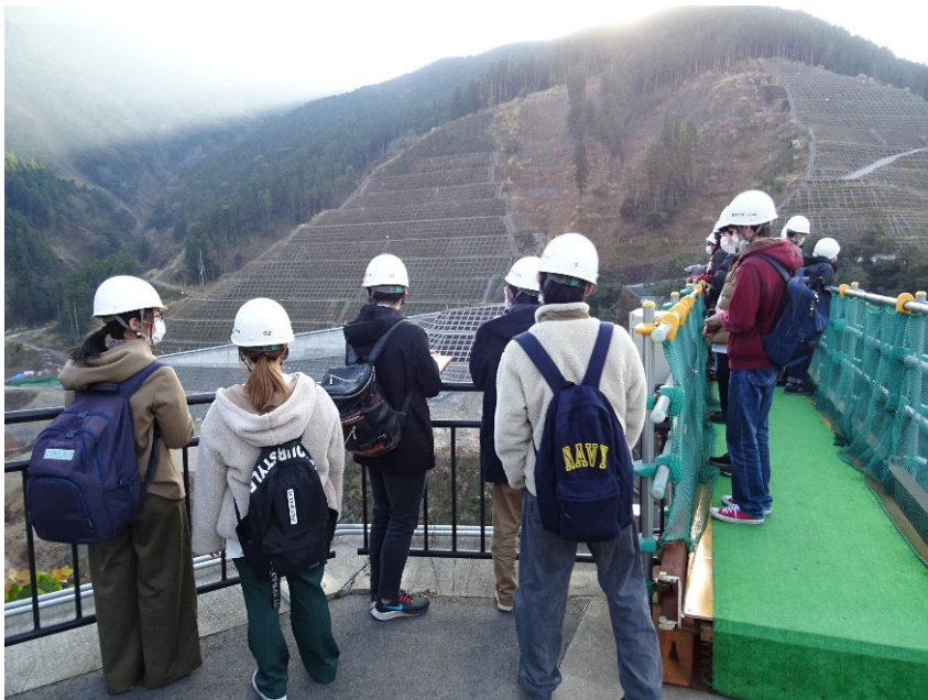
R4.12 大学生現地説明【84名】