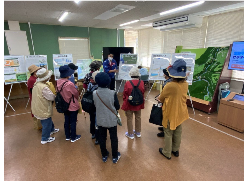
R4.10 熊本市力合地区住民現地説明【12名】