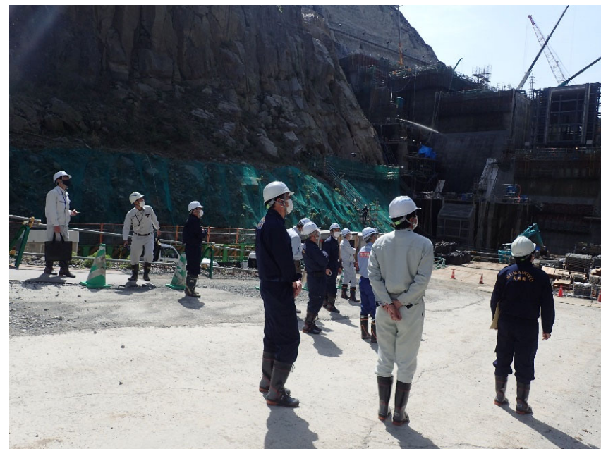
R4.4 菊陽町長、議会議員等現地説明【10名】