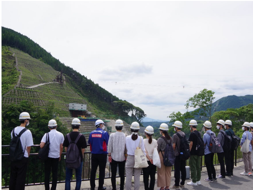
R4.6 大学生現地説明【14名】