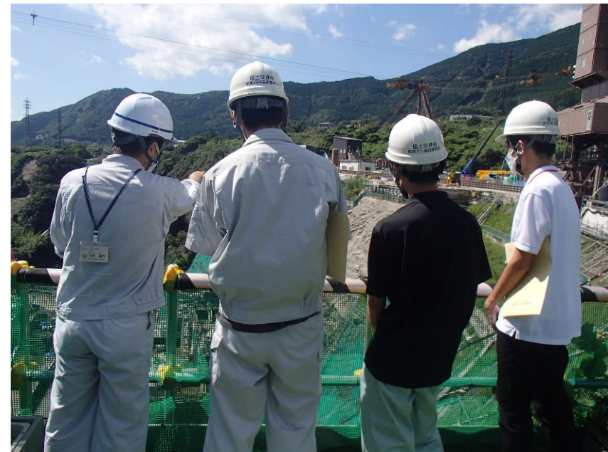
R4.8 大学生現地説明【3名】