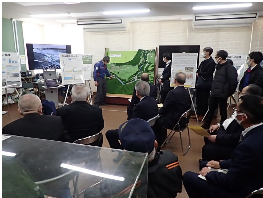
R5.2 流域外自治体議会議員現地説明【19名】