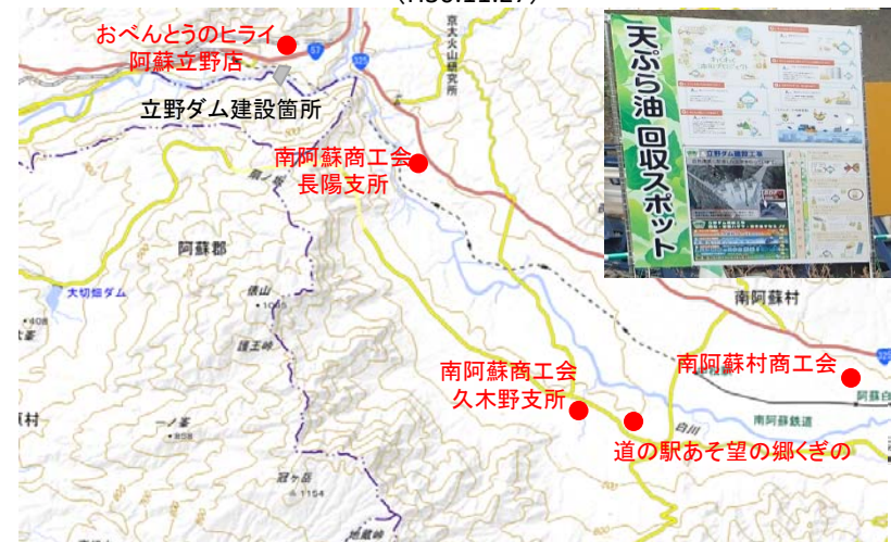
廃食用油回収場所(5カ所)