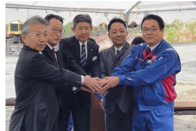
バイオディーゼル燃料使用に関する協定書 調印式 (H30.11.27)