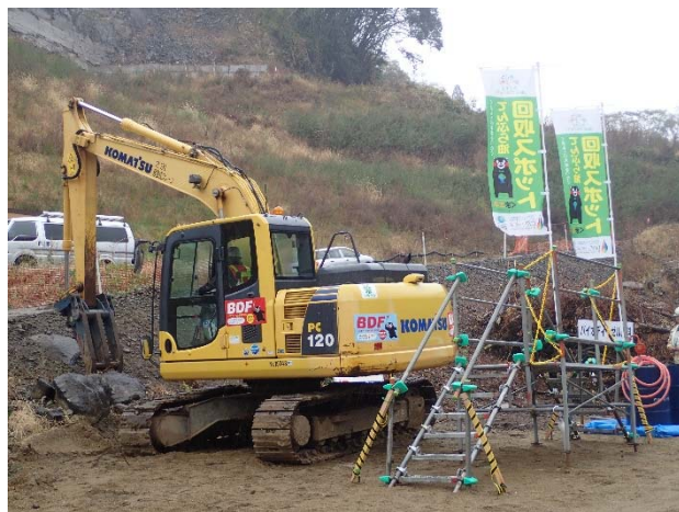
BDFを使用したバックホー