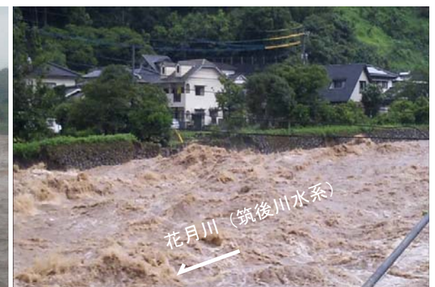
日田市三和 明德橋下流右岸の護岸崩壊状況 (平成24年7月14日 8:10)