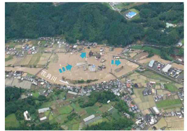
日田市三和地区 (花月川 7/700付近) 浸水状況 (平成24年7月3日 空撮)

1時間雨量: 63mm (7月14日6:00~7:00) 3時間雨量: 124mm (7月14日4:00~7:00)