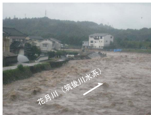
日田市西有田 坂本橋下流左岸の護岸崩壊状況 (平成24年7月14日 8:40)