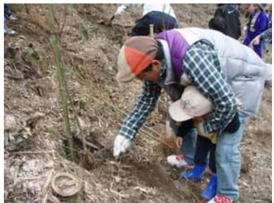
写真 5.2 植樹祭