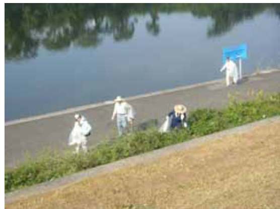
写真 5.1 河川一斉清掃

また、耶馬溪ダムでは、水源地域の自治体・住民等とともに策定した「耶馬溪ダム水源地域ビジョン」に基づき、貯水池周辺での植樹活動、水源地と受益地との交流会などの事業に取り組んでいます。今後はこれらの活動を継続し、河川に対する正しい理解の啓発に努めるほか、洪水等の被害