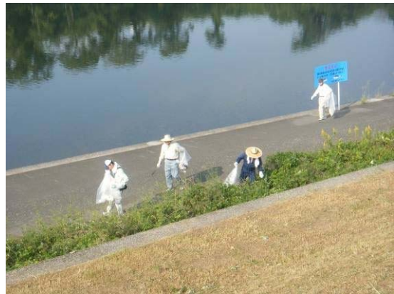
写真 5.1 河川一斉清掃

今後ともこれらの活動を継続し、河川に対する正しい理解の啓発に努めるほか、洪水等の被害から自らを守る意識を高揚するための水防情報の発信等に努めていきます。