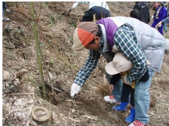
写真 5.2 植樹祭