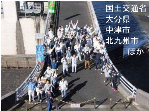
国土交通省 大分県 中津市 北九州市 ほか

10月15日「山国川の日」に、山国川・中津川の河川清掃を行いました。参加者は、国土交通省関係者や大分県・流域市町村だけでなく、地域の皆様にもご協力いただき、 総勢220名 が参加!