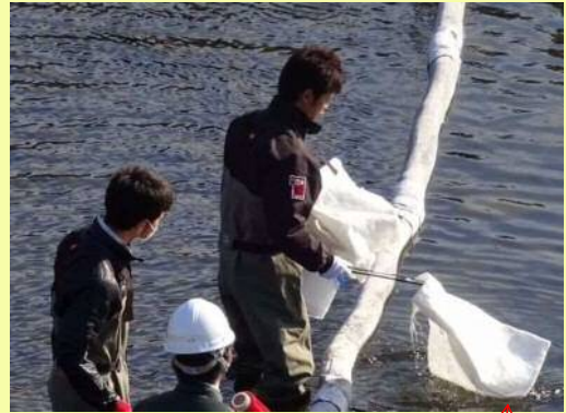
これで油を吸い取ります