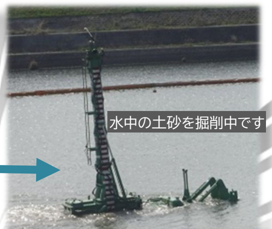
水中の土砂を掘削中です