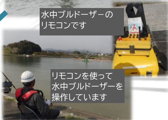
水中ブルドーザーの リモコンです