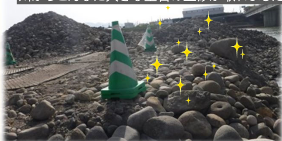
川からこんなに大きな玉石の土砂が取れました