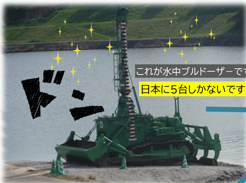
これが水中ブルドーザーです 日本に5台しかありません！

リモコンで操作でき、雨の時の避難が簡単なこと や、工事期間が短縮でき、工事費用も抑える優れ ものです。