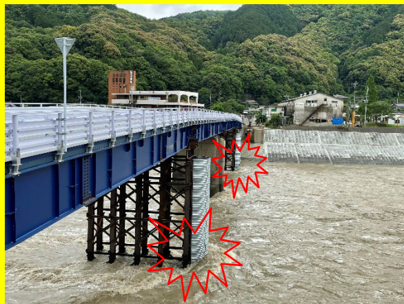
仮橋に河川流入物等が接触