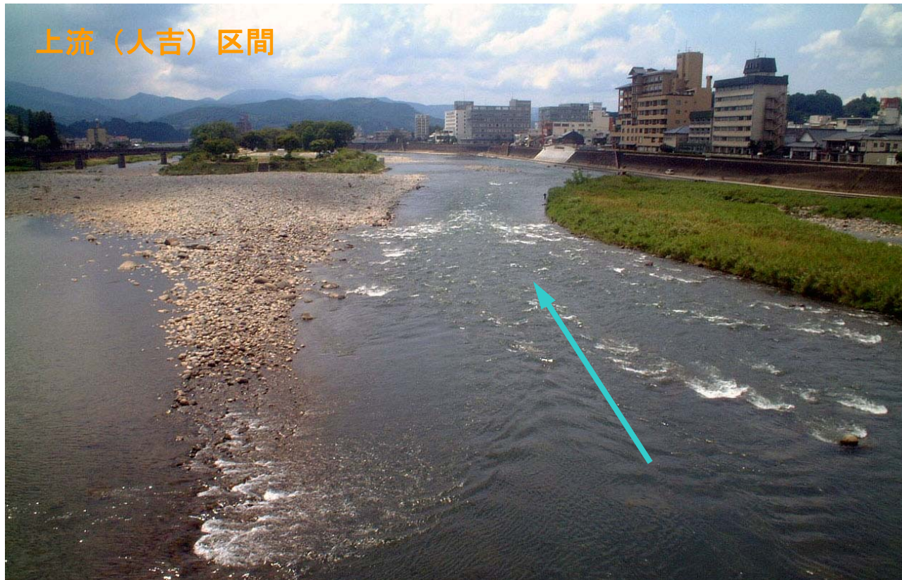
写真 人吉区間 (61k800付近)