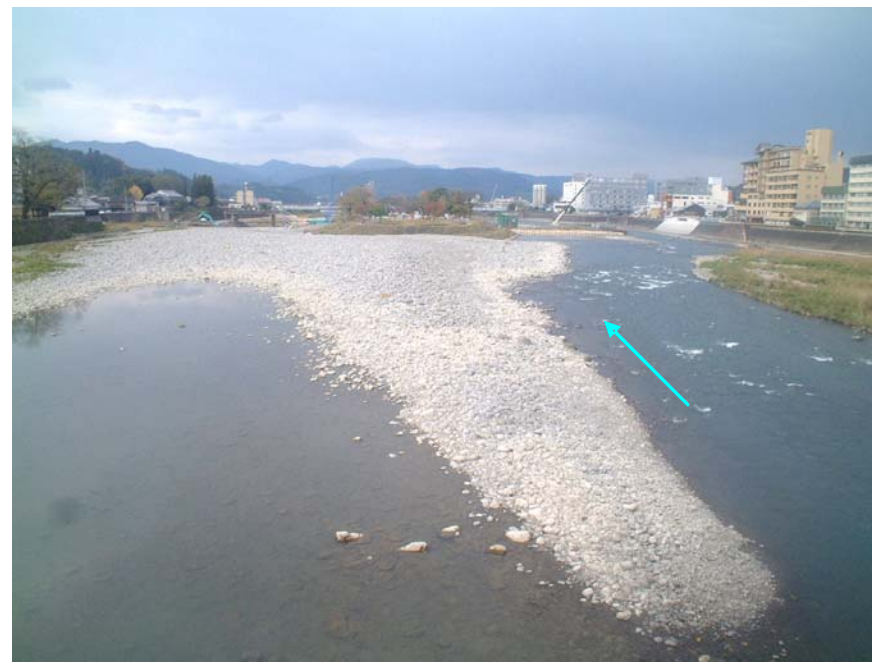
写真 61k800付近（上流から撮影）