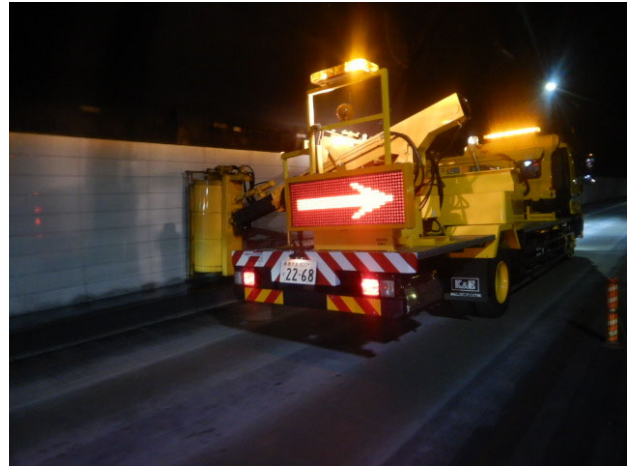
<トンネル壁面清掃>