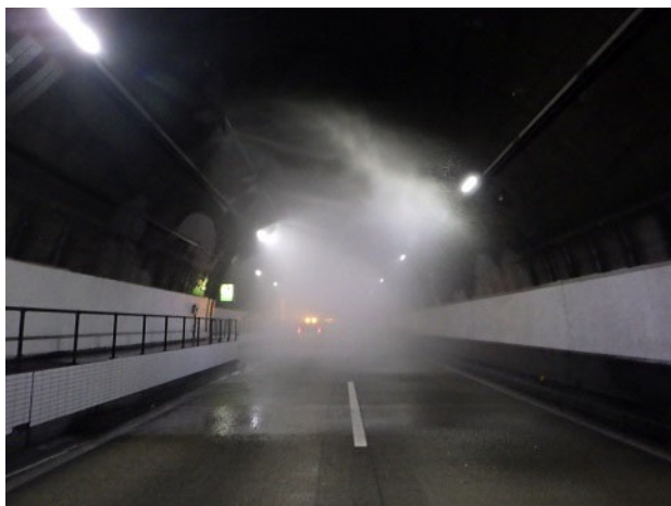
<水噴霧装置放水試験>