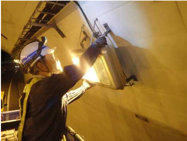
<トンネル照明設備点検>