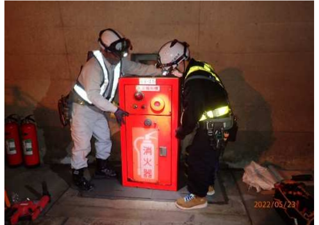
<トンネル非常用設備更新>