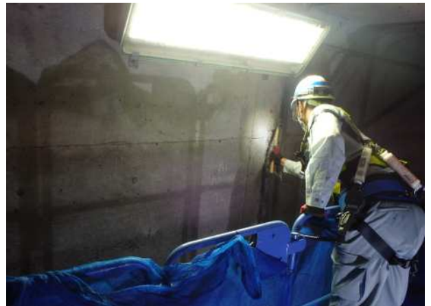
<ボックスカルバート点検>